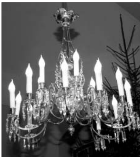
Pirmā lustra pēc restaurācijas, 2013. gadā