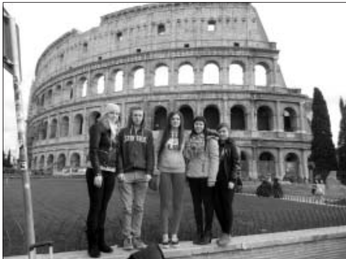
Romā pie Kolizeja

Mālpils Profesionālās vidusskolas astoņi audzēkņi ir pirmie Erasmus+ programmas projekta " Jauna pieredze četrus specialitāšu skolotājiem un audzēkņiem " dalībnieki.