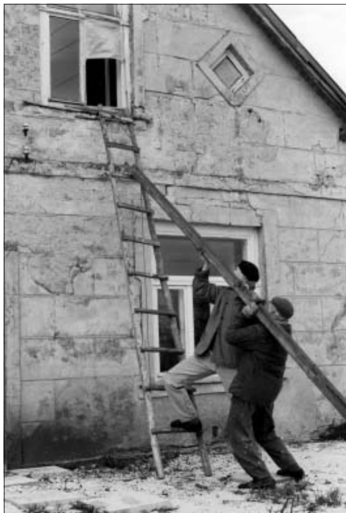
Atgriešanās 1998. gads