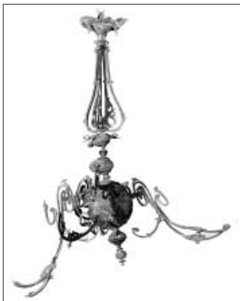
Pirmā lustra pirms restaurācijas, 2012. gadā