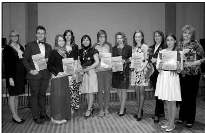
Mālpils novada vidusskola