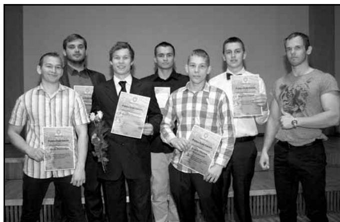
Mālpils Profesionālā vidusskola