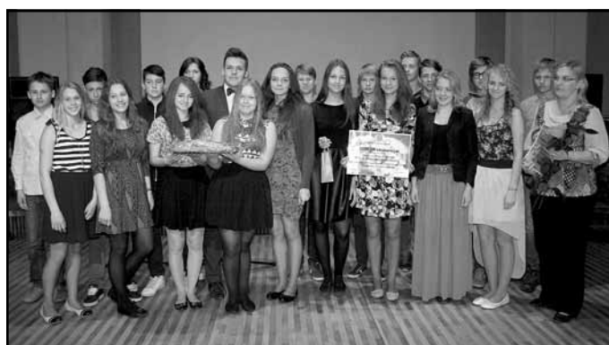
Deju kolektīvs "Dunda"