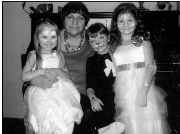
Vecmāmiņa mazmeitas dzimšanas dienā, 2013. gads