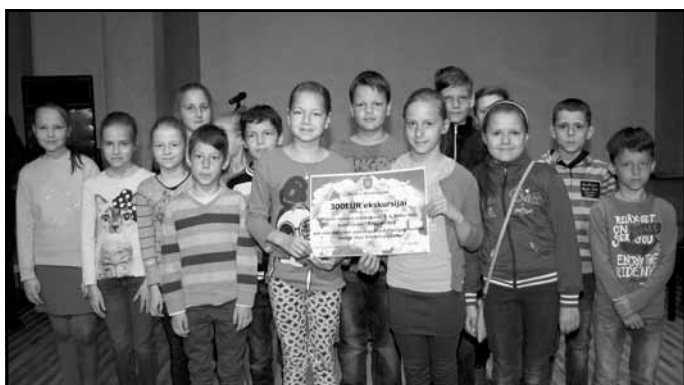
Deju kolektīvs "Atsperītes"