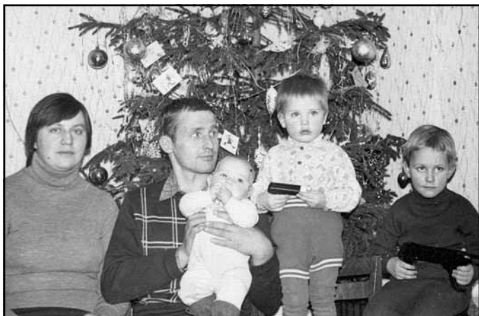
Jevgenija ar vīru un bērniem sagaidot jauno 1984. gadu