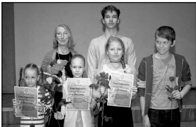
Mālpils Mūzikas un mākslas skola