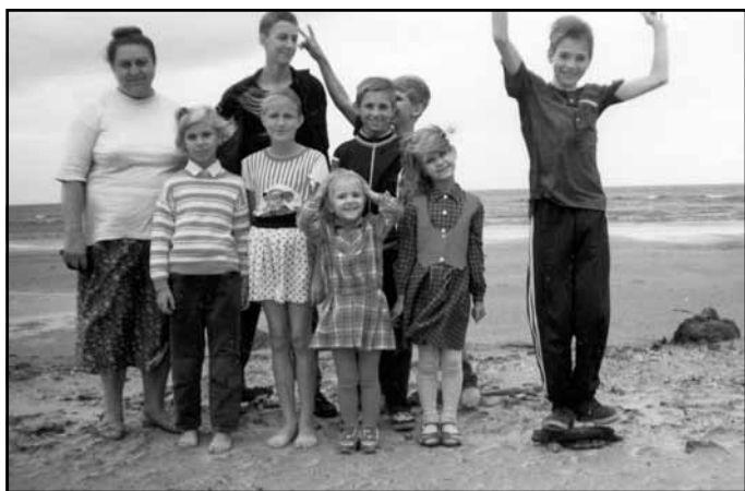
Rīgas jūrmalā ar saviem un audzēbērniem, 1995. gads