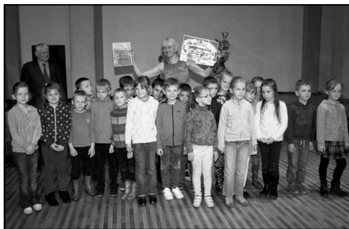
PII "Māllēpīte" deju kolektīvs