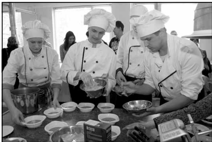
Šefpavāra palīgi - Mālpils Profesionālās vidusskolas audzēkņi