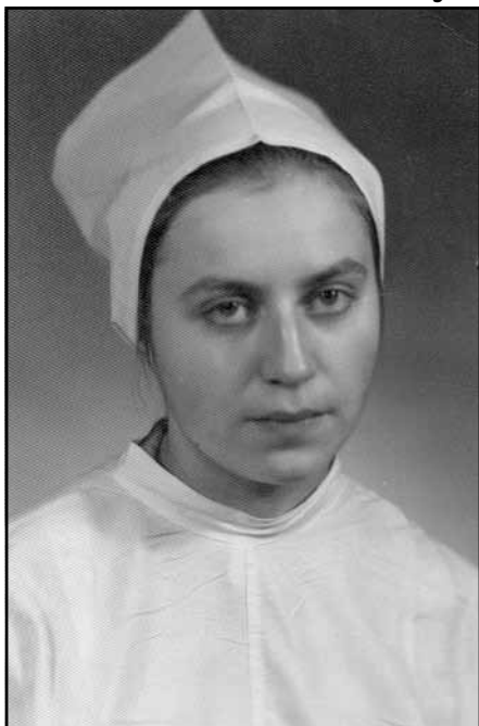
Topošā mediķe. Rīga, 1974. gads