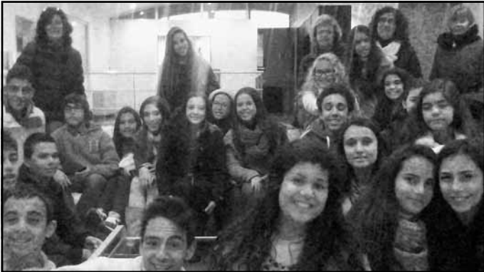
Kopā ar portugāļu skolēniem

Projekta mērķis ir nodrošināt pedagoģiskajiem darbiniekiem profesionālās pilnveides iespējas ārvalstīs, apmeklējot kursus, piedaloties darba vērošanā un pasniedzot stundas partnerskolās.