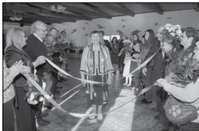
Daktere radu pulkā skaistā dzīves jubilejā Mālpilī