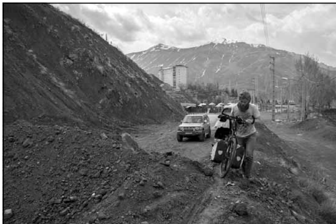
Redzamo iemeslu dēļ ceļš slēgts, bet uz mums tas neattiecas

Chalus ceļš ir bīstams tādā ziņā, ka ir ļoti līkumots un šaurs, arī vairāki tuneļi - riteņbraucējiem vienkārši nav īsti vietas."