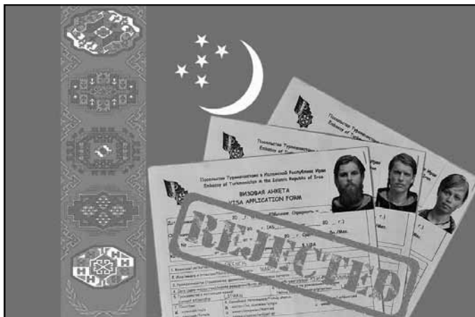
Turkmenistānai nevēlami - vīzu atteikums

"Aizbraucam uz Turkmenistānas vēstniecību. Trešo dienu pēc