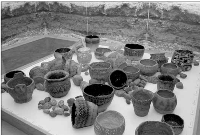
Podi izstādē "Zemes spēks un zemes maigums"