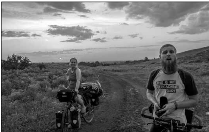
Piedzīvojumi Ile-Alatau Nacionālajā parkā beigušies laimīgi

Taču arī šis piedzīvojums tomēr ir beidzies laimīgi, gan tikai cieta riteņi, un tālāk jau par Ķīnu.