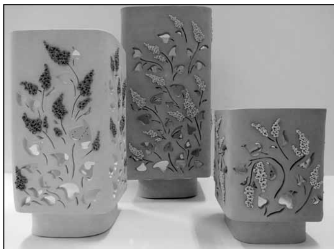
Indras Lapiņas sveču trauki "Persijas ceriņi"

sies. Vispirms par jaunākās paaudzes veiksmēm.