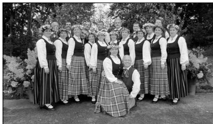
Deju kopa "Kniediņš"