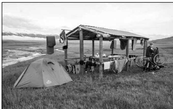
Kempingā, Ile-Alatau Nacionālajā parkā