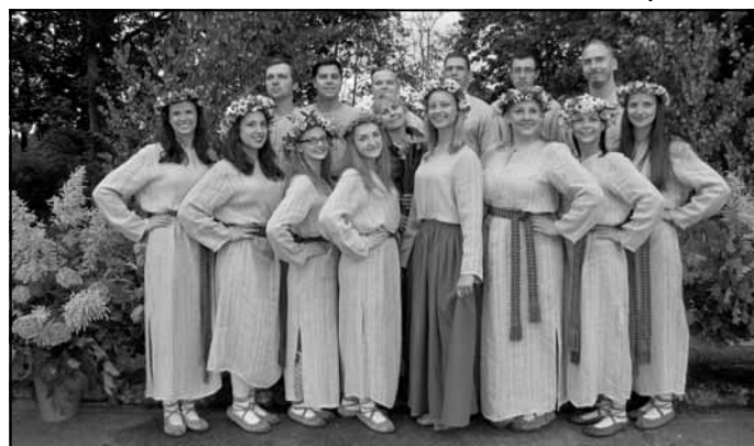
Deju kopa "Māra"