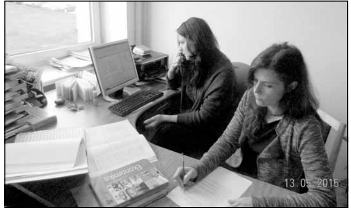
Top uzņēmējdarbības mācību moduļi