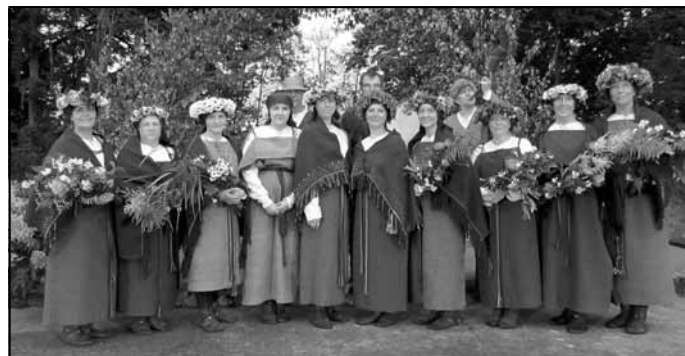
Folkloras kopa "Mālis"