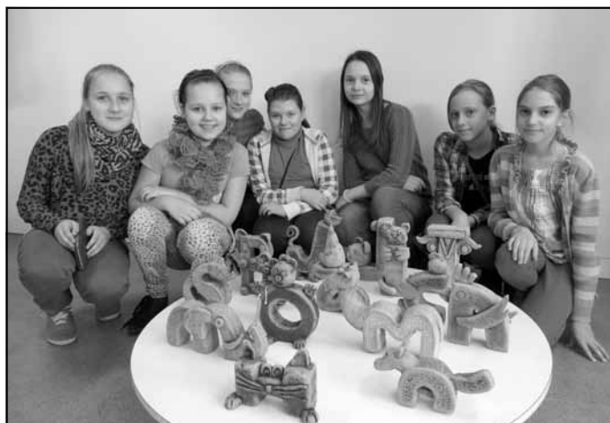
4. kl. konkursa "Rakstu darbi" noslēguma pasākumā Bulduru dārzkopības vidusskolā