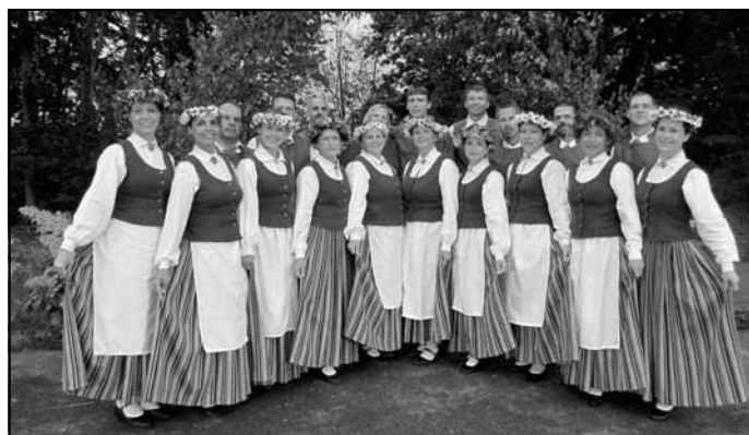
Deju kopa "Sidgunda"