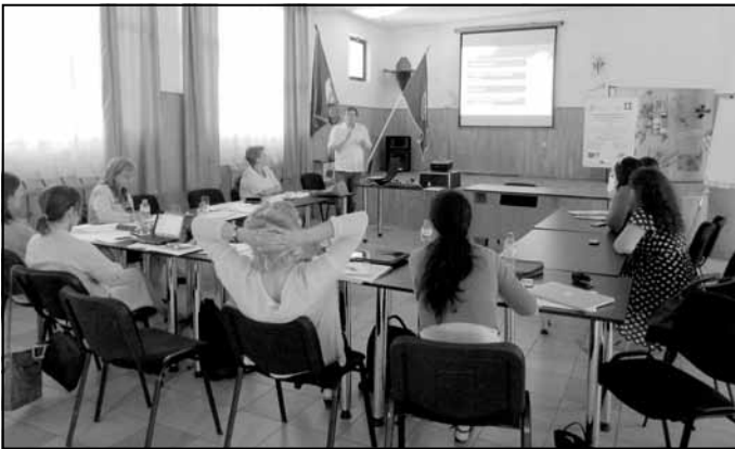
Projekta pirmā gada izvērtēšanas sanāksmē