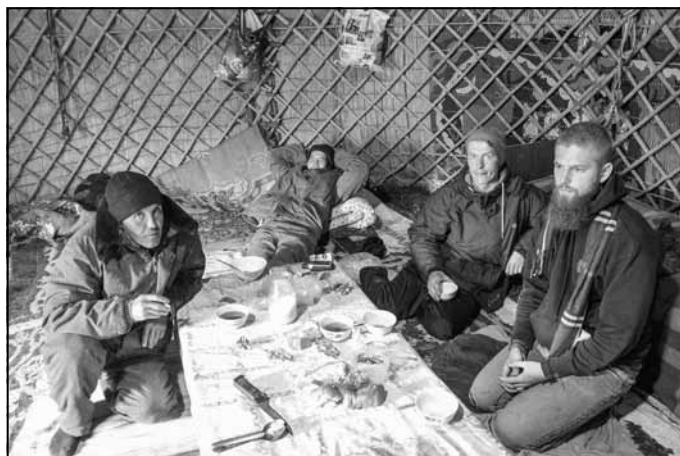
Jurtā pie kazahu nomadiem sildoties ar karstu tēju