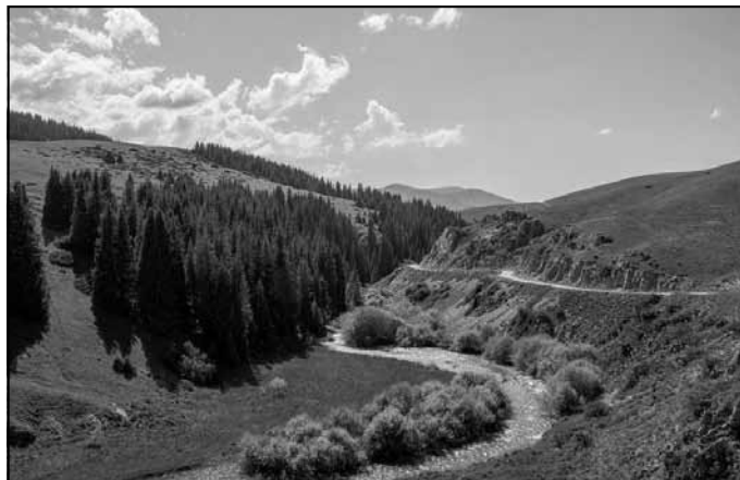
Ile-Alatau Nacionālā parka ainava

Pirmās pazīmes, ka brauciens būs smags, parādījās jau nākamajā dienā pēc izbraukšanas no Almati. Pēc jauka uzbrauciena kalnā no Turgenas līdz Batanai ceļš pēkšņi kļuva samērā akmeņains. Jau pēc pārsimts metriem mūs apturēja barjera, ko apšargāja parka darbinieks. Sākumā viņš atteicās mūs laist tālāk, paziņojot, ka tikai vietējiem vai darbiniekiem esot atļauts tur doties. Pierādījumam kalpoja pat diezgan oficiāla izskata papīrs. Pēc īsas draudzīgas sarunas mēs pārliecinājām viņu laist mūs tālāk un, ignorējot brīdinājumus par vilkiem un lāčiem, nekavējoties devāmies uz priekšu. Tas bija garš, stāvs, akmeņains un karsts ceļš, kuru pievarējām, tikai pateicoties mūsu stūrgalvībai un vēlmei negriezties atpakaļ. Pēc pamatīgas apdegšanas saulē mums izdevās sasniegt Asi Plato. Daži posmi bija pārāk akmeņaini un stāvi, tāpēc mums nācās stumt mūsu smagi apkrautos