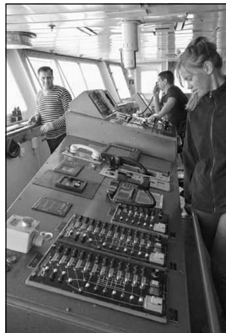
Uz kuģa un tā komandtiltiņa

"Neliela aizķeršanās pie vilciena bija riteņu dēļ - lai nevajadzētu formēt atsevišķu bagāžas biļeti, ko mēs vairs varbūt nepaspētu, bet varētu riteņus likt iekšā pašā vagonā, mums nācās samaksāt pirmo kukuli līdzšinējā ceļa laikā - vagona "provodņiks" prasīja 15000 kazahu tenges par šo prieku, ko mēs nokaulējām līdz 10000 tengēm. Rezultātā, visticamāk, tas tomēr bija