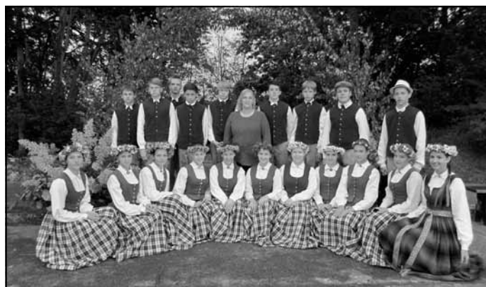
Mālpils novada vidusskolas deju kopa "Dunda"