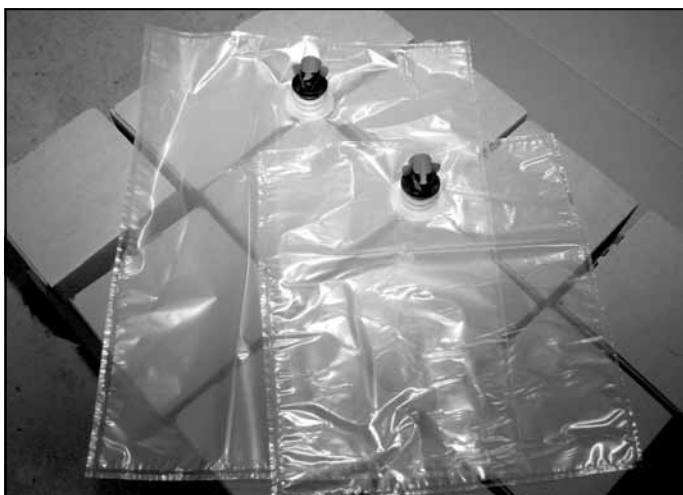
Speciāli karstajām sulām paredzētie 10 un 5 litru maisi