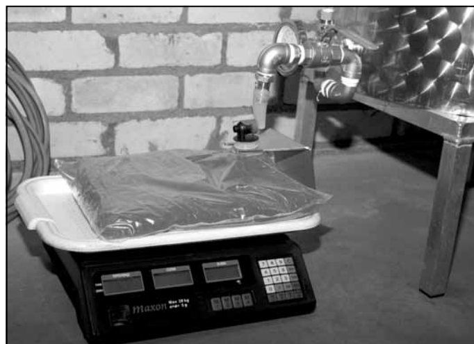
No pasterizatora karsto sulu pilda tieši maisos