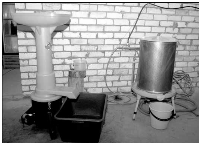
Smalcinātājs un sulu spiede gatavi darbam