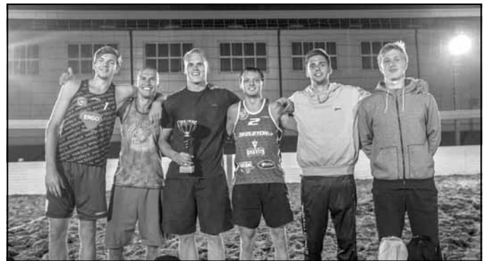
Godalgoto vietu ieguvēji pludmales volejbola nakts turnīrā