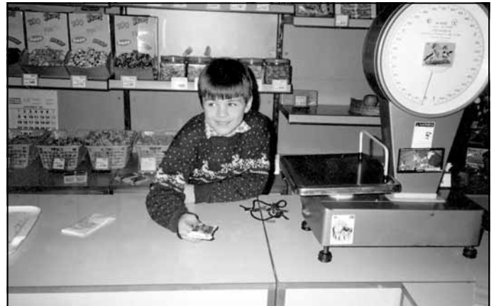
Pasta veikala atvēršanas pasākumā. Pirmais darījums.