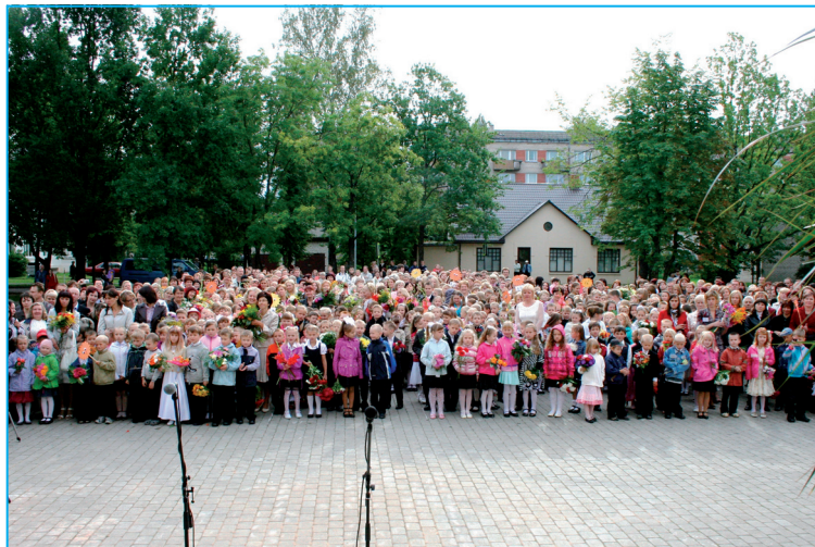
Jaunā mācību gada gaidās. Īpašs šis mācību gads būs Balvu pamatskolas pirmklasniekiem, jo viņi ir pirmie, kuri uzsāk skolas gaitas jaunajā skolā.

- Ir palielinājies skolēnu skaits, kas nozīmē arī to, ka skolotājiem būs pietiekamas algas. Liels ieguvums ir mazākumtautību programmu saglabāšana, jo vienas tās pastāvēt nevarētu. Tāpēc