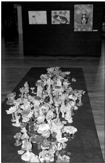
Keramika un diplomdarbi mākslas skolas audzēkņu darbu izstādē

Mālpils Mūzikas un mākslas skolai šis bija nozīmīgs gads. Mūzikas skola svinēja 25 gadu, bet mākslas skola 20 gadu jubileju. 27. novembrī Kultūras centra izstāžu zālē noslēdzās mākslas nodaļas skolotāju darbu izstāde, bet audzēkņu darbi un diplomdarbi vestibīlā un klases telpās bija skatāmi līdz 4. decembrim.