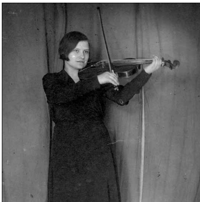
Vijoļspēles klasē (Rīgas Skolotāju institūts)

Mana mamma bija prasmīga rokdarbniece un ļoti laba dziedāja. Dziedātparsme man bija no mātes. Viņa bija pirmais alts Rīgas Tautas augstskolas korī. Kad mamma gāja uz mēģināju-