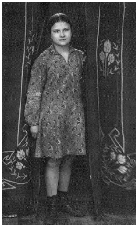
Mirdza skolas gados