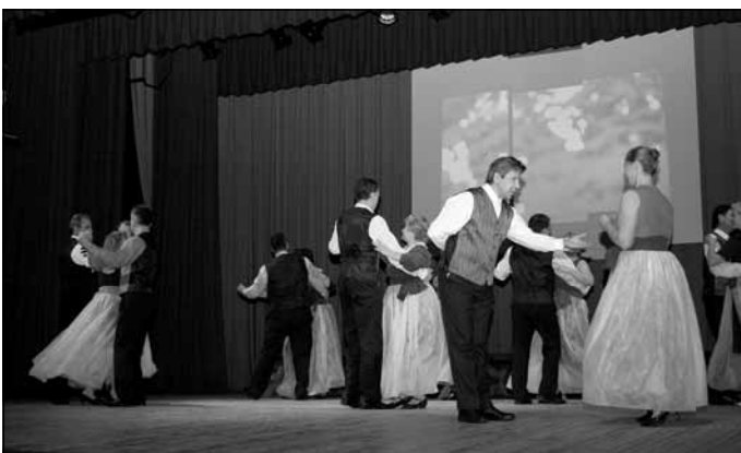
Skats no izrādes