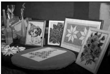
Darbniecās tapušo rokdarbu izstāde

Projekta noslēguma prezentācijas diena notika 3. decembrī, Starptautiskajā invalīdu dienā, kurā piedalījās 89 biedrības biedri, atbalstītāji un viesi. Prezentācijas dienā bija izlikti biedrības biedru pašdarinātu darbu izstāde. Visus priecēja biedrību “Notici sev!”