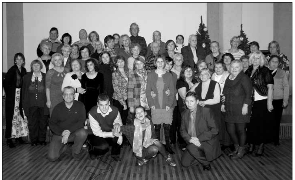
Biedrības “Notici sev!” biedri, atbalstītāji un projekta dalībnieki