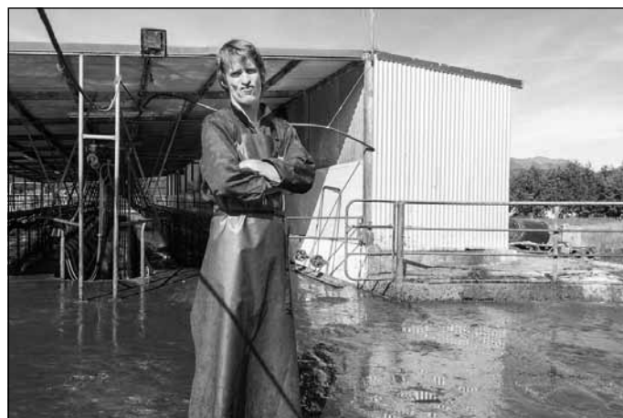
Kādam tas ir jādara un šoreiz man - jānošķūrē govju mēsli