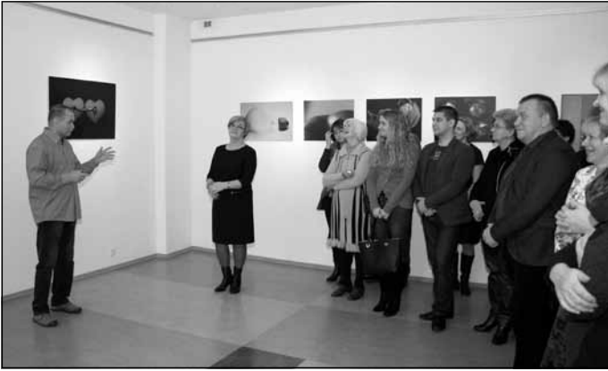
Atis aizrauj visus ar savu humora izjūtu un stāstiem

tēma, bet vēlāk tām piepulcētas arī dažādas citas, katra ar savu stāstu. Izveidojusies tāda kā bilžu retrospekcija. Protams, iziet visam cauri, atlasīt darbus bijis ļoti grūti, jo laiki, materiāli un tehnoloģijas bijušas tik dažādas.