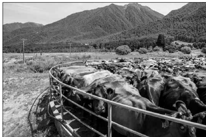
Govju aploks Jaunzēlandes ainavā