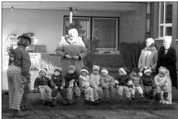
Darbā bērnodārzā - 1. septembris

strādā ļoti atbildīgi. Ideāla audzinātāja pašiem mazākajiem.