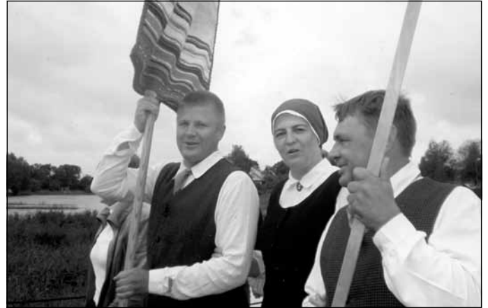
Ar savu deju kolektīvu Mālpils 800-gades svētku gājienā

saprašanās ar vecākiem, tas, ka bērni nāk uz grupu ar prieku, ka grupā ir kārtība un ražīgs darbs un bērni dod atpakaļ mācīto. Vecāki dažkārt brīnās, kā viņu bērni tik daudz spēj apgūt un izdarīt. Atsaucīgi vecāki - tā ir skolotāja laime!"