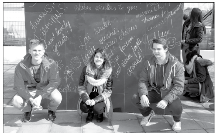
Pie skolas Portugālē