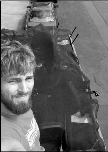
Ivars darbā uz piekabes

monstrēts Latvijas karodziņš uz skapja un maza Rīgas Balzāma pudelīte plauktā. Pats gan viņš Latvijā vēl nav bijis, bet stāstīja, ka tieši šogad rudenī plāno to darīt.”