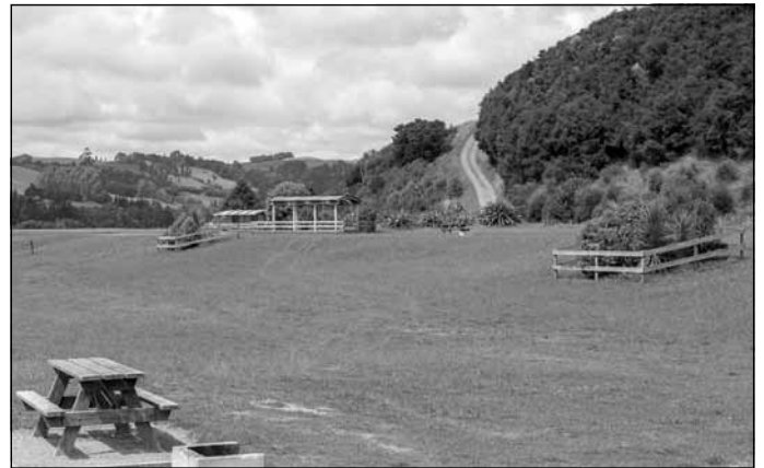
Kempings pie Arapuni ezera

Kā īpaši jaunzēlandisku ēdienu noteikti var pieminēt gaļas kūkas (meat pie, mince pie) – https://en.wikipedia.org/wiki/Meat_pie_(Australia_and_New_Zealand) . Nez, kā pareizāk latviski būtu teikt – gaļas pīrāgs vai gaļas kūka? Ļoti labs ēdamais, kad ceļā gribas kaut ko uzēst – vēl ātrāk par ‘fast food’, ieskrien jebkurā maiznīcā, nopērc karstu un kādu laiciņu var justies paēdis.”