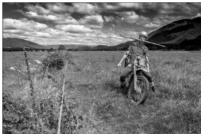
Mūsdienu kovbojs - Dainis gatavs visiem izaicinājumiem!

Pirmajam ganāmpulkam (lielākajam no trijiem) “vecajām” govīm jāierodas ap 4:30, tātad kavēties nedrīkst. Uzlecu visurgājējām seglos un dodos naktī.