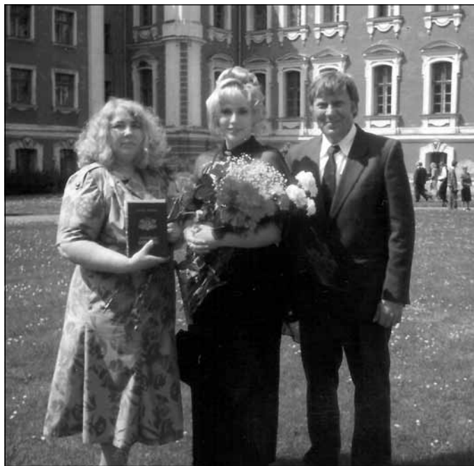
LLU izlaidumā ar vecākiem, 1997. gads