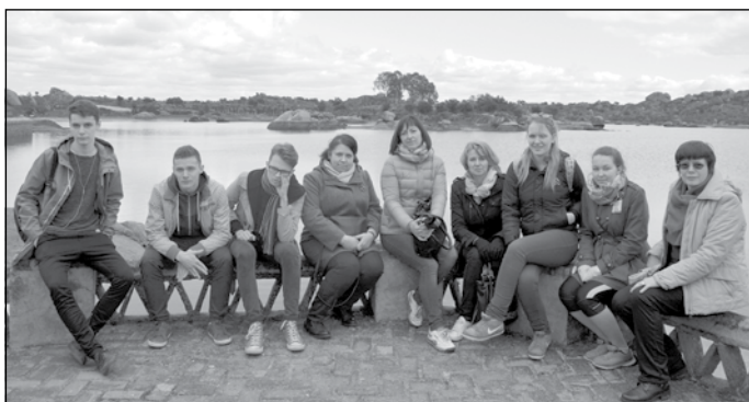
Spānijas brauciena dalībnieki

Veismīgi tuvojas noslēgumam Mālpils novada vidusskolas Erasmus+ programmas projekta "Uz Eiropas spārniem" pirmais gads. Projekts ir veltīts putnu migrācijas ceļu izpētei Eiropā, dabas zinību padziļinātai apguvei, izmantojot daudzveidīgas metodes, apgūstot partnerskolu labāko pieredzi šajā jomā. Pēc vairākiem kopš mācību gada sākuma veismīgi organizētiem pasākumiem februāra beigās uz starptautisko sanākumi Spānijā devās mūsu dalībnieku grupa. Pirms tam bija jāatlasa informācija par mūsu izvēlēto putnu – balto cielavu, jāsagatavo citiem skolēniem uzdodamie jautājumi, jāizveido un jāpārtulko prezentācijas. Piecas dienas pagāja, demonstrējot citu valstu skolēniem un skolotājiem savu darbu rezultātus, iepazīstoties ar partneru veikumu, pārbaudot savas zināšanas arī par citu valstu putniem, piedaloties putnu vērošanā. Protams, spilgtākos iespaidus sniedza Spānijas varenā daba.