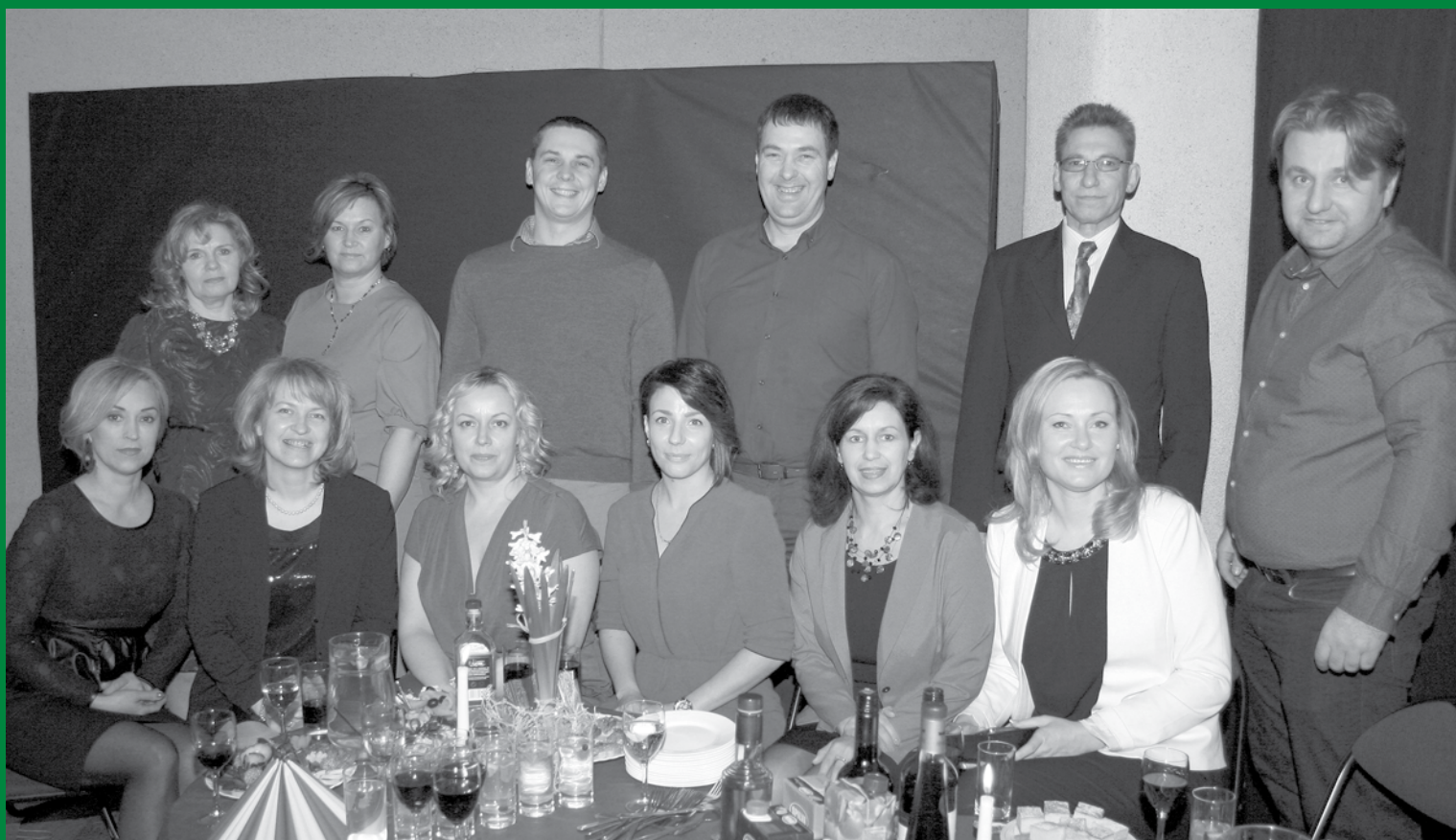
Uzņēmēju balle, 2016. gada 11. marts