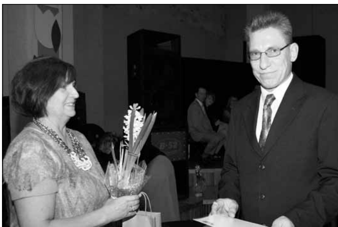
SIA "DQ MAKAWELI" (Voldemārs Dunkurs), ūdensapgādes, kanalizācijas un siltumapgādes mezglu ražošana