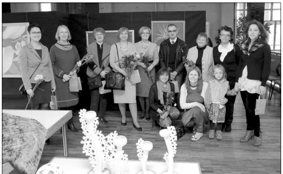
Mākslinieki no Inčukalna, Ropažu un Mālpils novadiem un Suntažu pagasta Mākslas dienās Mālpilī 35