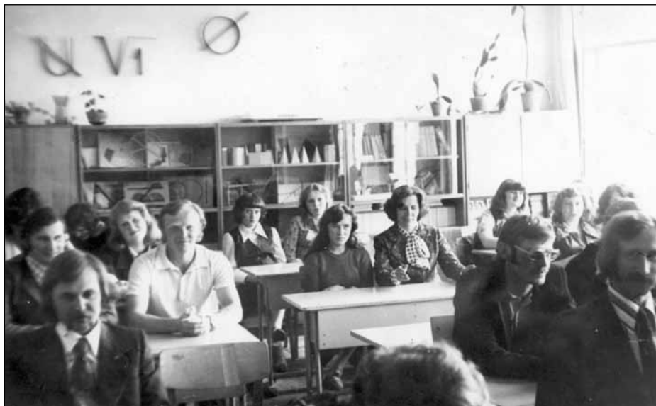
1978. gada salidojums. Ārijas "pirmie" pēc 10 gadiem savos solos vecajā skolā", Mālpilī