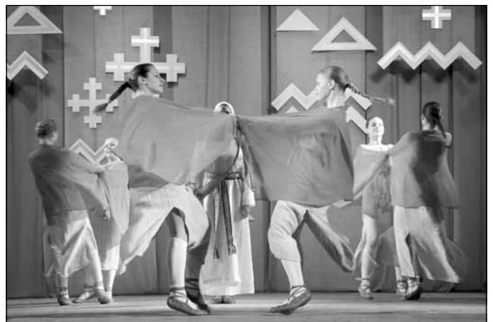
Mirkļis no 25 gadu jubilejas koncerta, 2016. gada 27. marts