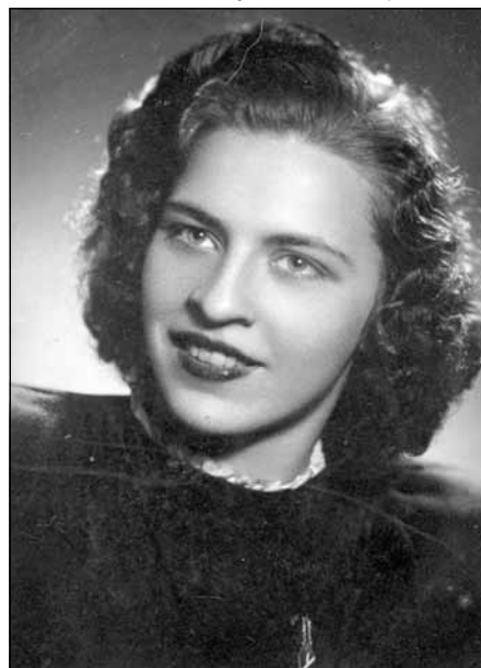
1950. gads. Pabeigta vidusskola