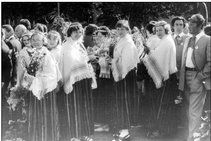
Daugavmalā ar kori pirms Dziesmu svētku gājiens