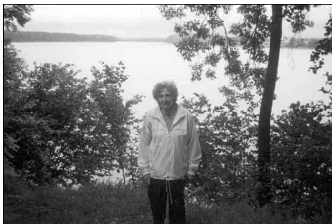
Vieta tā pati, bet Staburaga vairs nav - tas atrodas Daugavas dzelmē

daini uzskata par "sausu". Cik vien iespējams, jāmiļ un jāizprot bērni."