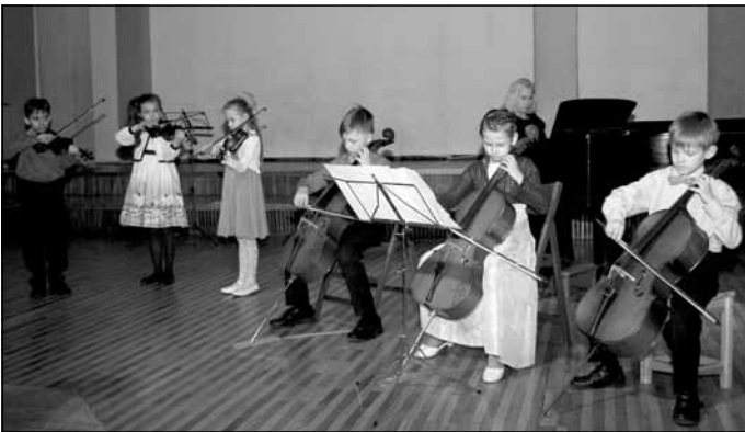
15. aprīlī skolas audzēkņi un pedagogi sniedza īpaši skaistu koncertu

Ticiet vai nē, bet ir pagājuši vairāk kā 25 gadi kopš laika, kad 1990. gada 23. maijā ar Mālpils ciema Tautas deputātu padomes izpildkomitejas lēmumu Nr. 10 tika lemts par Mālpils mūzikas skolas atvēršanu. Deputāti noklausījās Mālpils ciema Tautas deputātu padomes izpildkomitejas priekšsēdētāja A. Lielmeža ziņojumu par Siguldas mūzikas skolas Mālpils filiāles darba rezultātiem 1989./1990. m.g., kurā bija atzīmēts, ka skolā mācījušies 36 audzēkņi, stundas pasnieguši 4 pasniedzēji un eksāmenos parādīti labi rezultāti. Pēc Siguldas mūzikas skolas direktora vērtējuma – virs rajona vidējā līmeņa. Ņemot vērā to, ka vēl daudzi bērni bija izteikuši vēlēšanos mācīties Mālpils mūzikas skolas filiālē, izlēma, ka to ir nepieciešams paplašināt un piešķirt Mālpils mūzikas skolas statusu. Un tā 1990. gada 1. septembrī Mālpilī tika atvērta mūzikas skola.