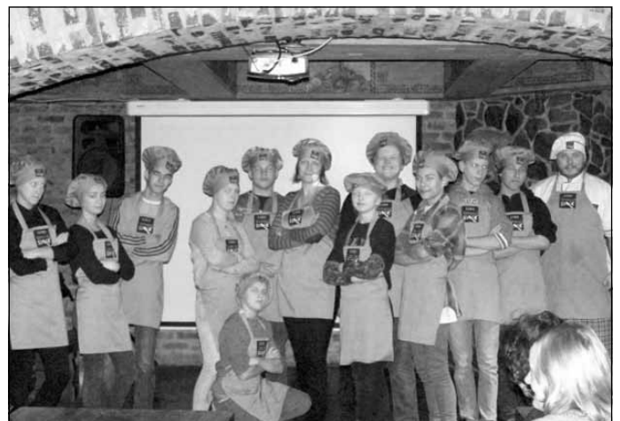
LIDO ēdināšanas kompleksā