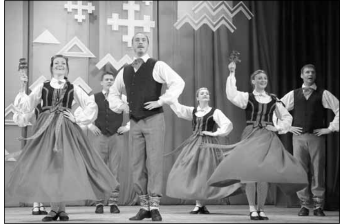
...un tagad, 2016. gada 27. marts