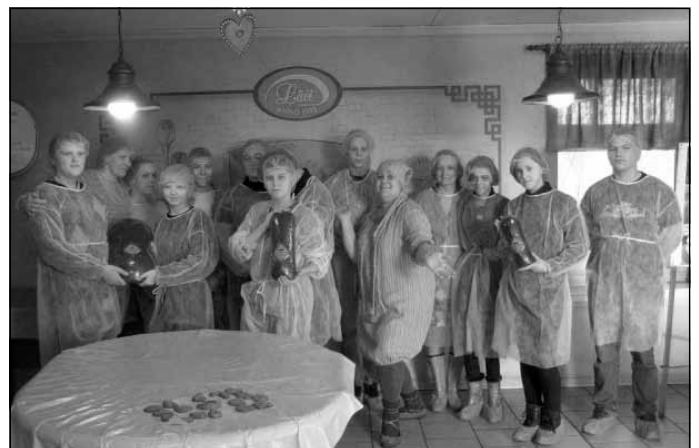
Maizes ceptuvē "Lāči"