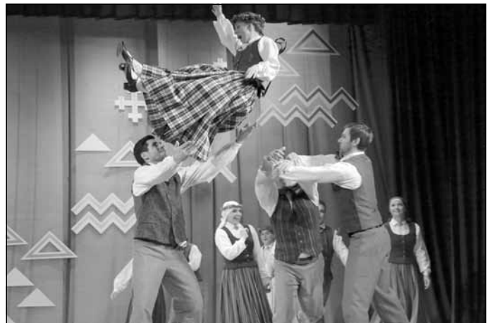
Mirkļis no 25 gadu jubilejas koncerta, 2016. gada 27. marts, foto J. Brencis