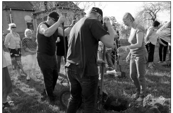
Pīlādžu stādīšana pie Torņkalna mājām, foto M. Ārente