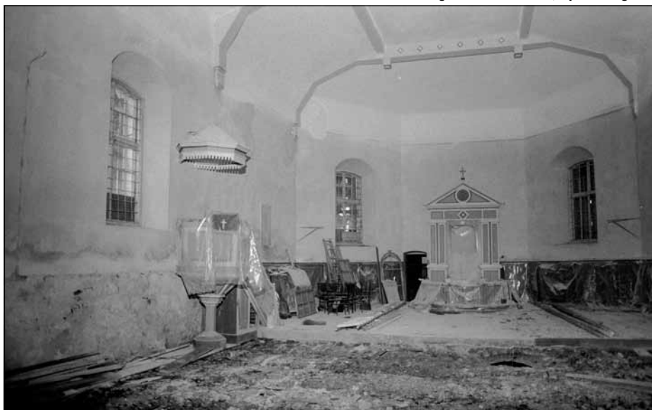
Remontdarbi Mālpils baznīcā, 20. gs. 80-to gadu I. puse