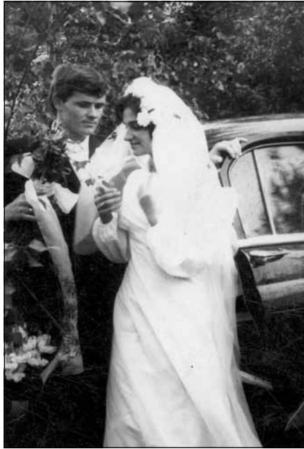
Vienā no mūža skaistākajām dienām, 1979. g.

Protams, ieiet kā vadītājai kolektīvā, kurā pati esi izaugusi, kur ir savas tradīcijas, savi draugu loki, arī ambīcijas, nav viegli, bet centos kopā ar kolēģiem apspriesties, analizēt izdarīto, uzklaustīt viņu viedokli. Nācās arī piekāpties, kaut domāju citādi. Galvenais, ka ģimene mani atbalstīja, savukārt es centos, cik iespējams, atlicināt laiku ģimenei, mūsu tradīcijas necieta. Bērni jau bija lieli, vīrs man daudz palīdzēja, nomierināja, saprata, ka skola ir mana īstā vieta, ticēja manai varēšanai. Tā pamazām viss nokārtojās."