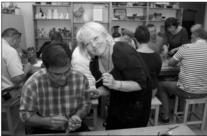
Svilpaunieku darināšanas darbnīca

Pirmā mālpiliešu viesošānās Beļģijā notika 1997. gadā, kad festivālā piedalījās deju kopa "Sidgunda" un arī mūsu amatnieki un pavāri, kopā 40 dalībnieki. Iepazīties ar "Artifuār" festivālu de-