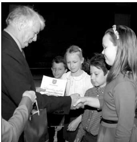
Konkursa "Erudīts" dalībnieki