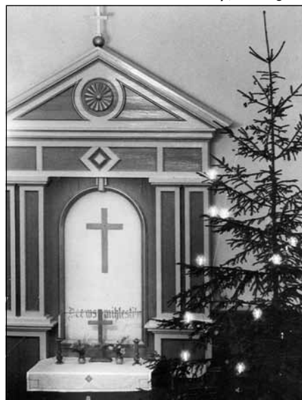
Baznīcas altāris pirms 1990. gada (MNPM 2309)