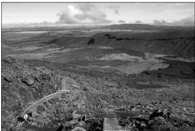
Pārgājiens uz Tongariro pāreju