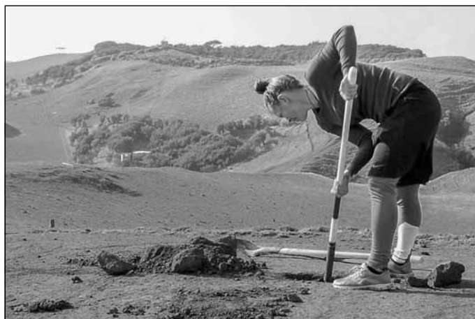
Laura arī "pieliek savu roku"