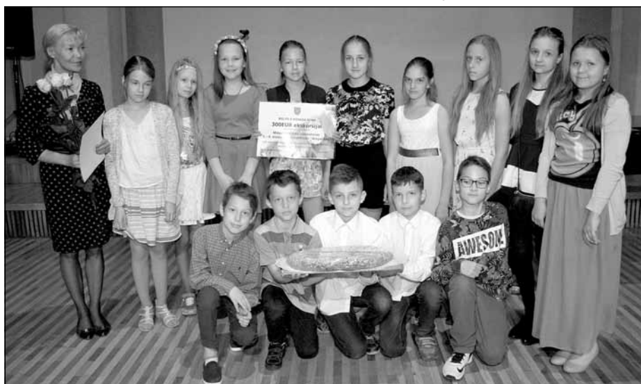
Deju kolektīvs "Atsperītes" (5.-6. kl.)