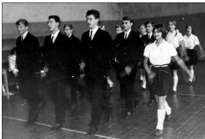
Komandēt ierindas skatē garus puišus nebija šķērslis, 1969. gads