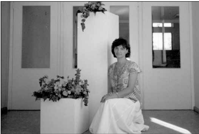
Direktore brīdi pirms internātskolas atvēršanas, 1996. gads