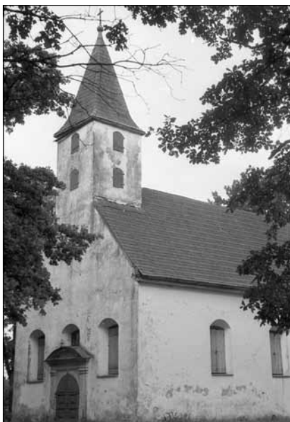
Baznīca 1981. gadā.

Šogad Mālpils baznīca svin savu 250 gadskārtu. Gatavojoties svētkiem, ar aivizes starpniecību vēlamies atvērt atkal kādu jaunu lappusi Mālpils baznīcas vēsturē. Šoreiz ielūkosimies tuvāk laika posmā pirms Atmodas, pirms 1989. gada Ziemassvētkiem, kad pēc padomju gadiem atkal pirmo reizi pulcējās Mālpils luterāņu draudze.