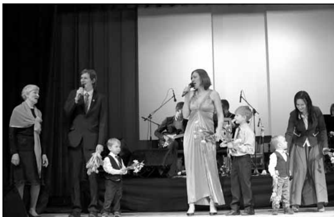
Zuteru ģimene - dziedātāji trijās paudzēs

Tas nu ir noticis. Mālpils dziesmai 15 gadi godam nosvinēti. Un tiešām milzīgs gandarījums par paveikto, par patiesi mīļiem vārdiem un daudzo skatītāju un pašu dalībnieku pozitīvajiem komentāriem un atsauksmēm. Tas viss dod spēku un enerģiju turpmākajam darbam, radošām iecerēm un jauniem projektiem.