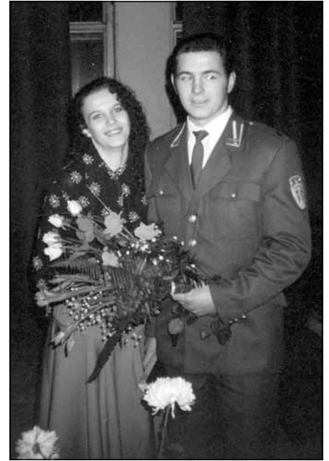
Armanda lielie sapņi palika nepiepildīti, 2000. gads