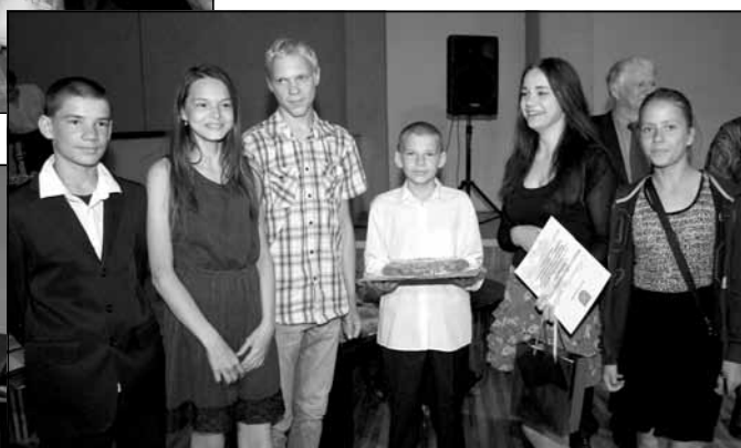
Latvijas Sarkanā Krusta Pirmās palīdzības sniegšanas sacensību dalībnieki