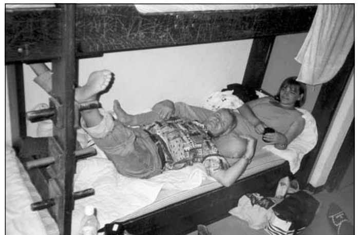
Kopā ceļot bija skaisti

Ko darāt, lai ieinteresētu jauniešus profesionālo izglītību apgūt tieši Mālpilī?