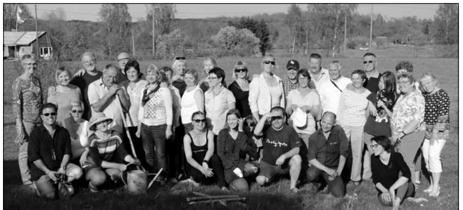
Mālpilieši un viesi piknikā Torņkalnā, foto M. Ārente