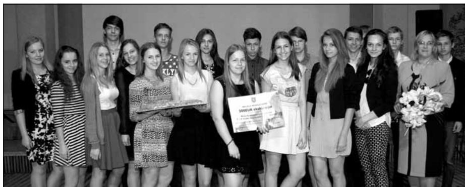
Deju kolektīvs "Dunda" (7.-9. kl.)