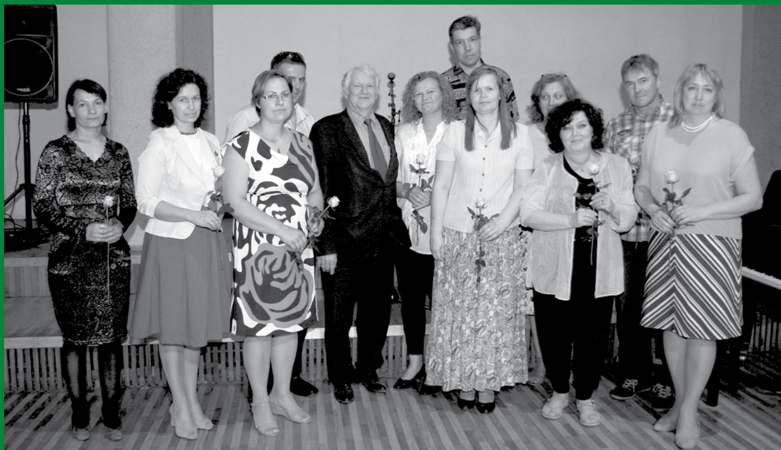
Pateicas vecākiem, kuru bērni guvuši uzvaras olimpiādēs, konkursos un sacensībās, 2016. gada 12. maijs