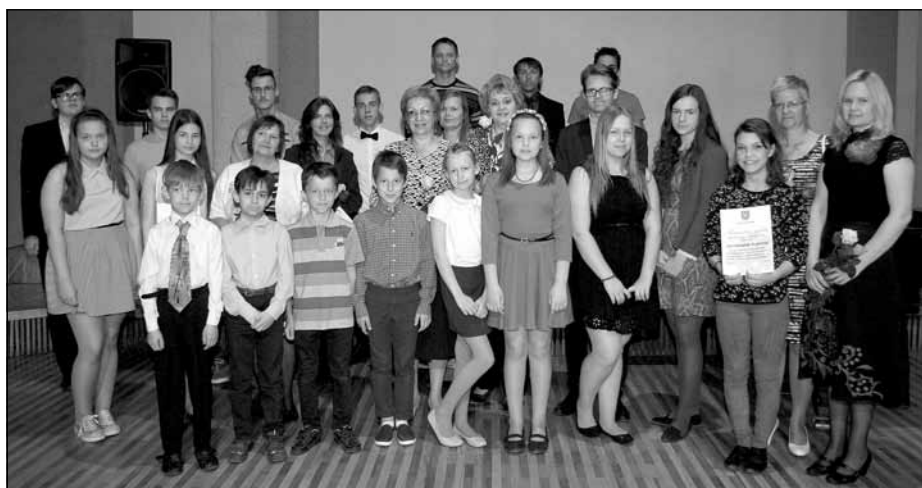
Mācību priekšmetu olimpiāžu, konkursu, sacensību uzvarētāji