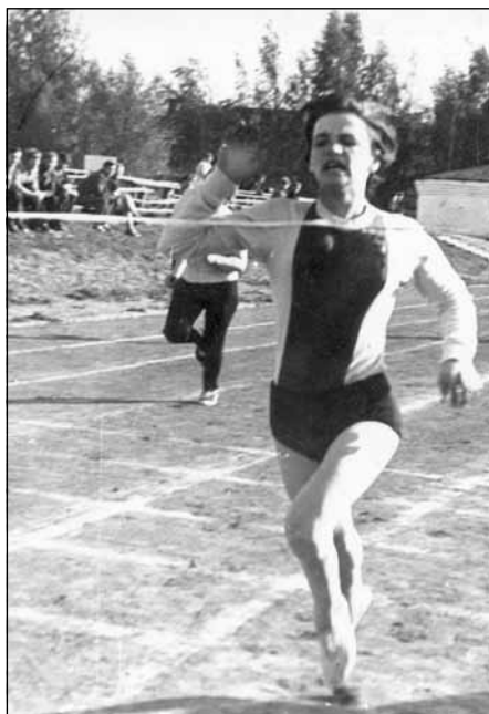
Murjāņu sporta skolas audzēkne pirmā rauji finiša lentu