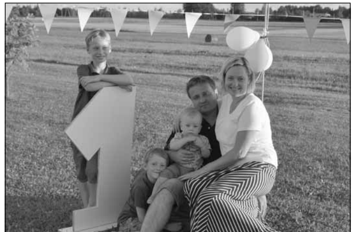
Visa ģimene kopā!