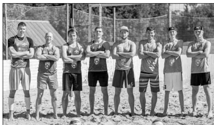
"Mālpils pludmales karalis 2016" dalībnieki