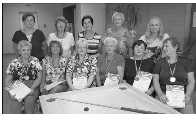
LR veterānu individuālā čempionāta novusā sievietēm dalībnieces

Sporta darba organizators Ģirts Lielmežs