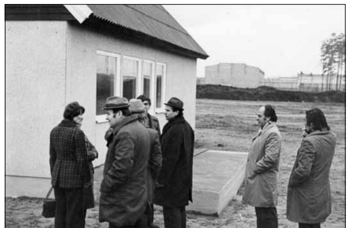
Līvānos noskatot jaunās mājas Mālpilij, 20. gs. 80-tie gadi