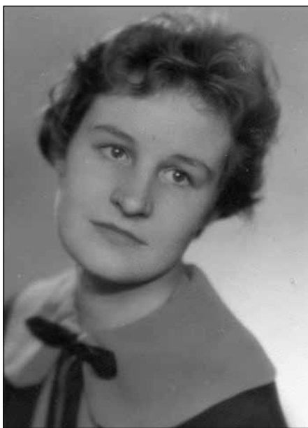
Skaista ir jaunība...