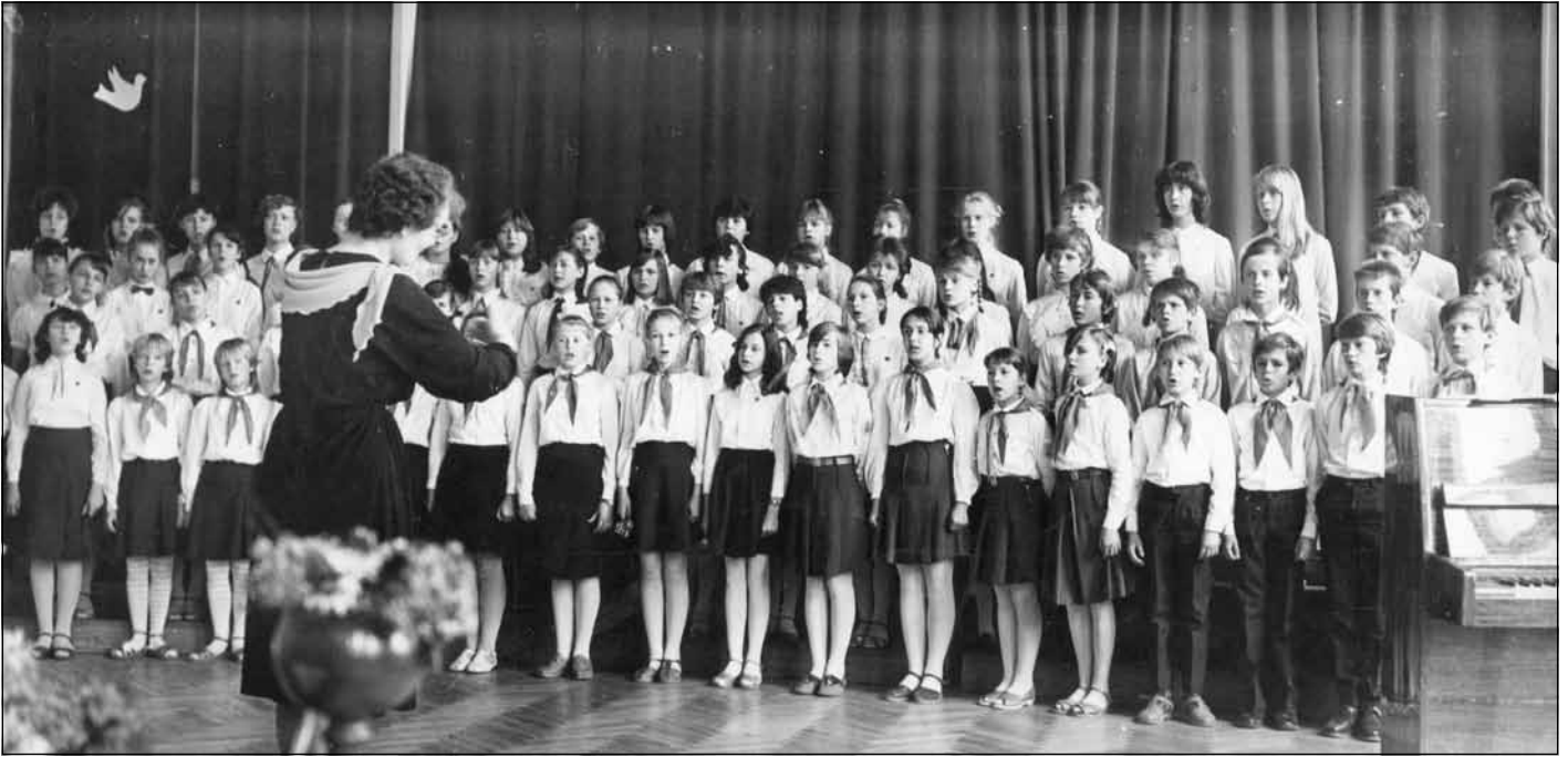
Koru skate Vangažos, iegūta 3. vieta, 1986. gads