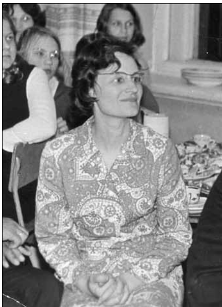
Vienā no daudzajiem interesantajiem labinieku salidojumiem vecajā skolā