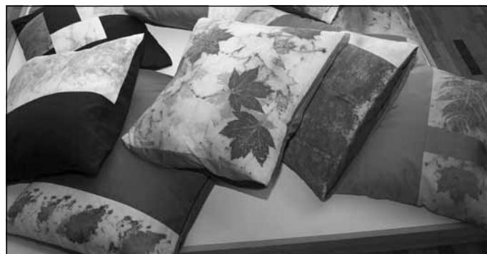
Tekstildarbnīcā tapušie darbi