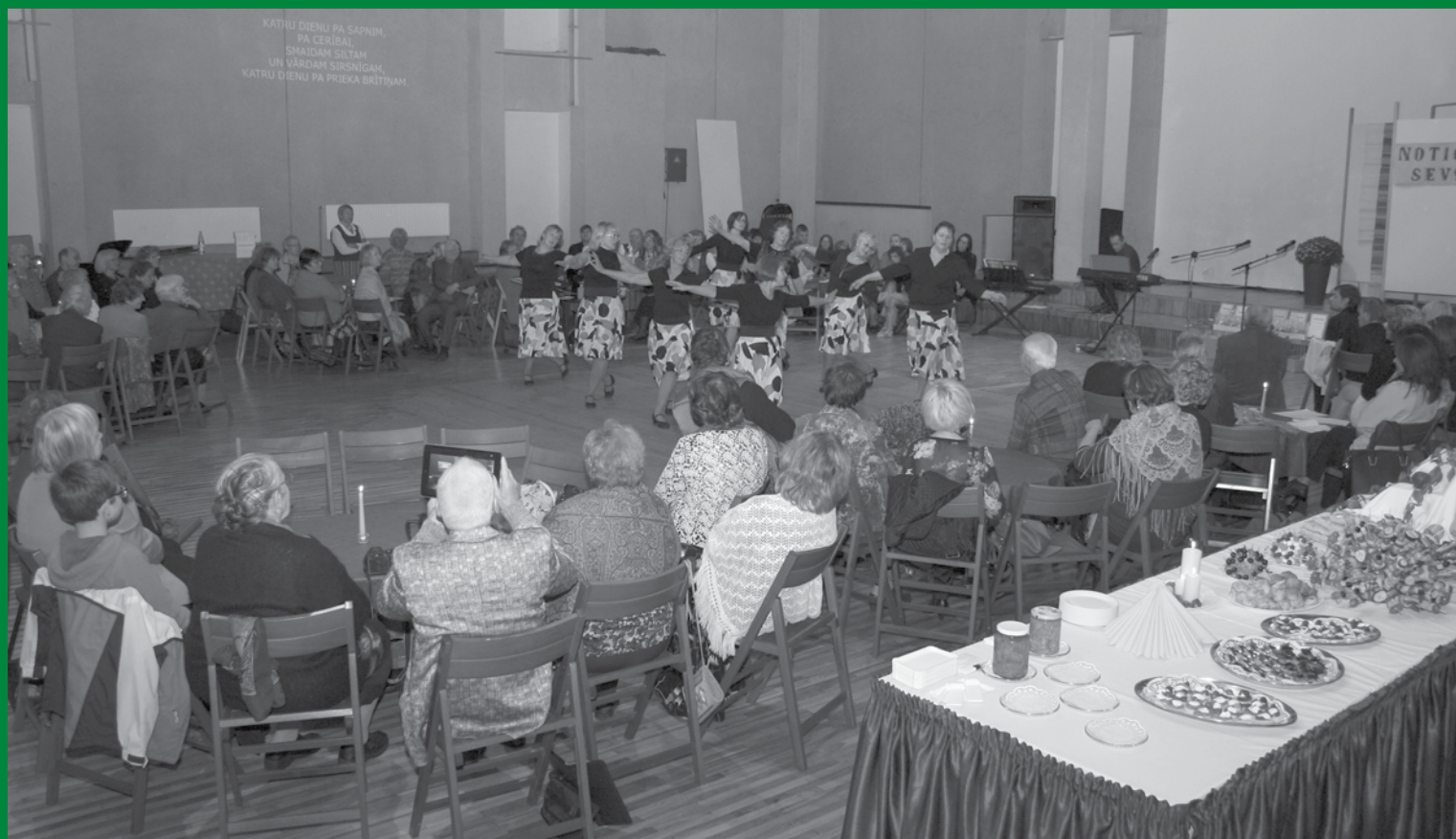
Invalīdu un viņu atbalstītāju biedrības "Notici sev!" 10 gadu jubilejas pasākums, 2016. gada 23. septembris