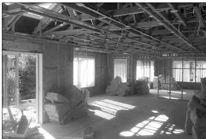
Māja, kuru nācās nojaukt nestabilu pamatu dēļ

vietā, kur tam būtu jāatrodas, tika rakts caurums. Tam it kā bija jābūt metra dziļumā, bet tur nekā nebija, beigās atradām kaut kādu trubu ar 1,4 m dziļumā, bet visi domāja, ka tā nav īstā. Tomēr bija īstā, un tad varēja urbt un pievienot jauno atzaru.