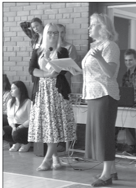
Mūsu skolotājas vada putnu migrācijas spēli ārzemju skolēniem