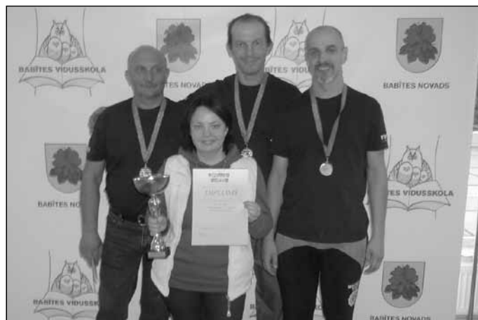
Mālpils novada novusa komandai 3. vieta

Sporta darba organizators Ģirts Lielmežs