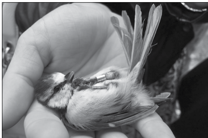
Apgūtas pirmās iemaņas ornitoloģijā

Arī mēs, projekta dalībnieki, dodamies pie jaunāko klašu skolēniem ar izzinošām spēlēm, lai aktīvā veidā pastāstītu par apgūstamo vielu. Visas nedēļas garumā mums izveidojās draudzīgs kontakts ar skolēniem no Spānijas. Viņi atcerējās un dalījās atmiņās par mūsu skolas skolēniem, kurus bija satikuši projekta sanāksmē Spānijas skolā. Neizpalika arī valodu apmaiņas "stundas".