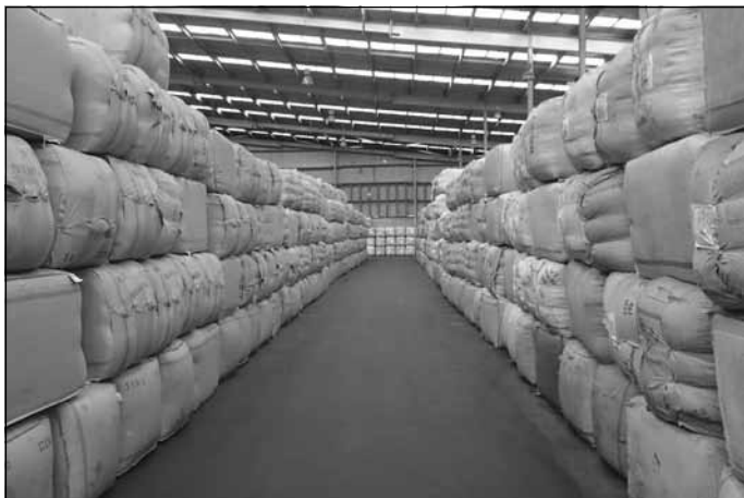
Vilnas attīrīšanas rūpnīcā

Ivaram darba meklējumi bija vēl grūtāki. Viņš reģistrējās