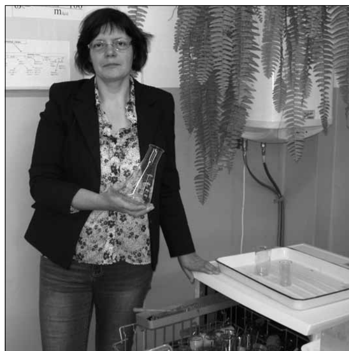
Tūlīt būs ķīmijas stunda