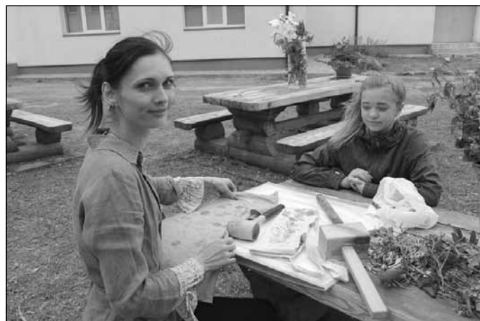
ECO PRINT (eko drukas) darbnīca