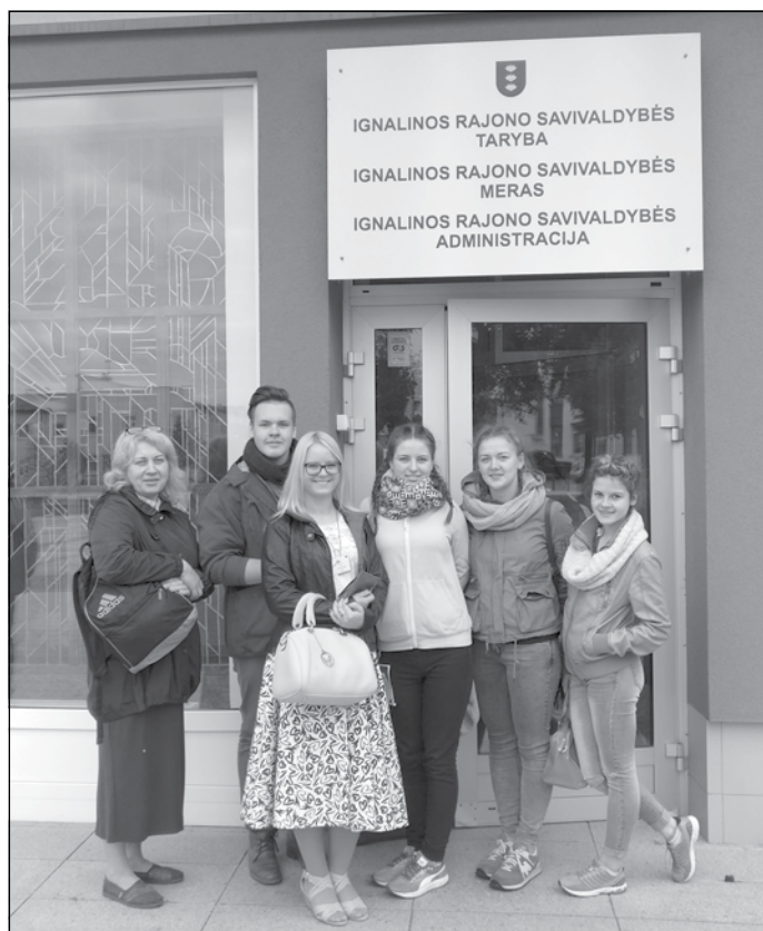
Pie Ignalinas pilsētas domes