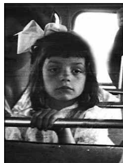
Es būšu skolotāja!