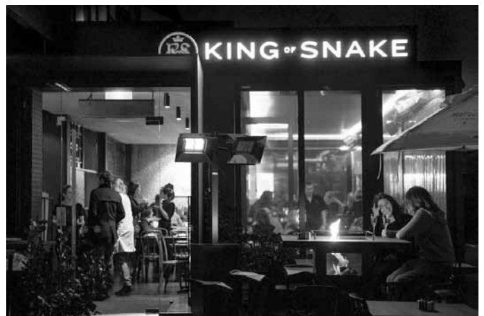
Lauras darbavieta – restorāns "King of Snake"

Pēc pāris dienām sāku strādāt uzņēmuma Stealth Hospitality vienā no iecienītākajiem restorāniem pilsētā (tā tautā runā) "King of Snake" par bārmeni. Kokteiļus vienmēr apgūstu viegli – esmu pietiekami strādājusi industrijā, lai spētu aši aptvert jaunas receptes un dzērienu veidus. Nereti tie vienkārši ir papildināti klasisko recepšu grozījumi. Tā kā restorānam ir moderna Āzijas kulinārijas ievirze, arī dzērienu klāsts ir atbilstošs: ingvers, līčija,