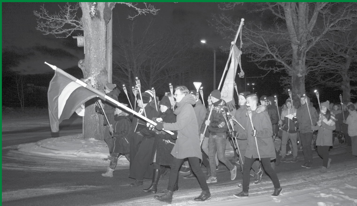
Lāčplēša dienas lāpu gājiens, piedalās arī Mālpils novada vidusskolas skolnieki un skolotāji, 2016. gada 11. novembris