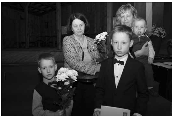
"Gada ģimene" – Steķu ģimene