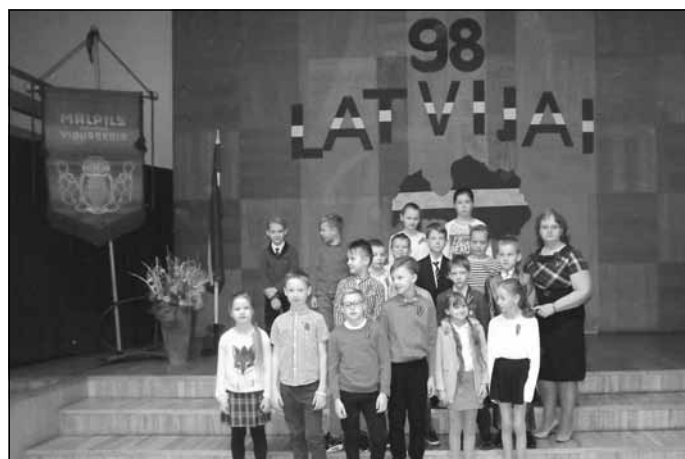
Svētku līnija – 98 vēlējumi Latvijai

17. novembrī bija svētku līnija, kurā skolēni, skolotāji un pārējie darbinieki izteica 98 novēlējumus Latvijai.