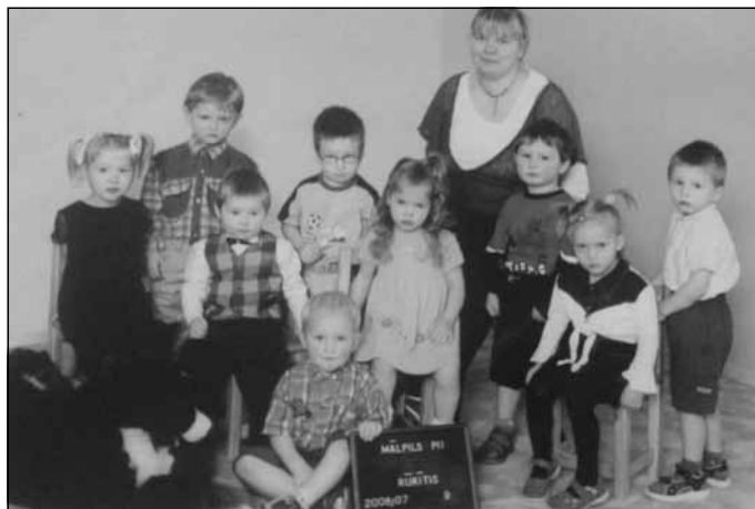
Elitas pirmie audzināmie bērni, uzsākot pedagoga karjeru