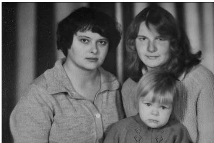
Elita ar mammu, ap 3 g.v.