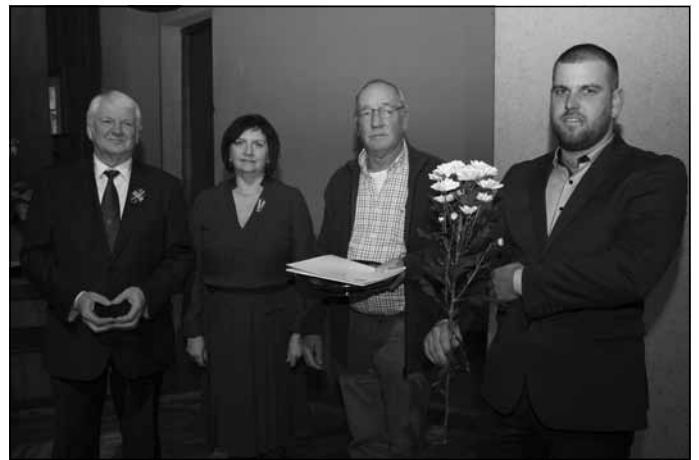
“Gada uzņēmums” – SIA “WOODPRO”