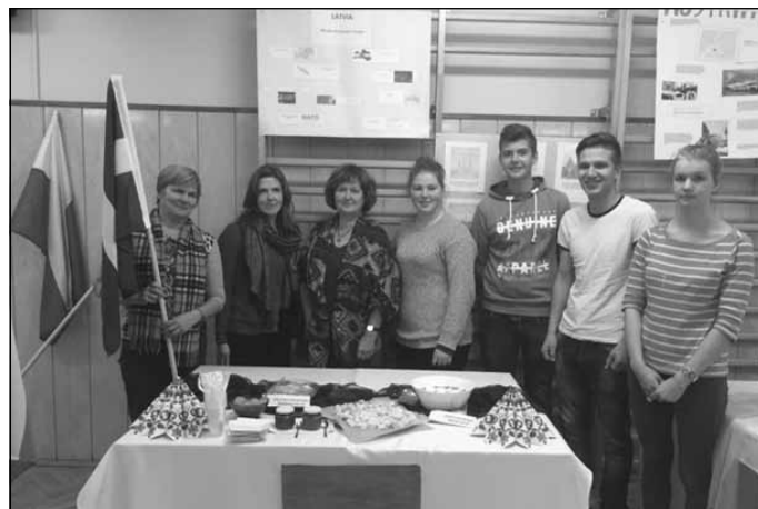
Pie kopīgi gatavotajiem nacionālajiem ēdieniem

Interesanti bija apmeklēt skolu, kur tiek sagatavoti zirgkopji. Daudzi audzēkņi šeit ierodas no citiem Polijas reģioniem ar savu zirgu, kuru visu laiku kopj, trenē, gatavo barību. Tā kā skola atrodas senā muižas ēkā ar klāt pieguļošu parku, zirgus izmanto arī tūrismam.