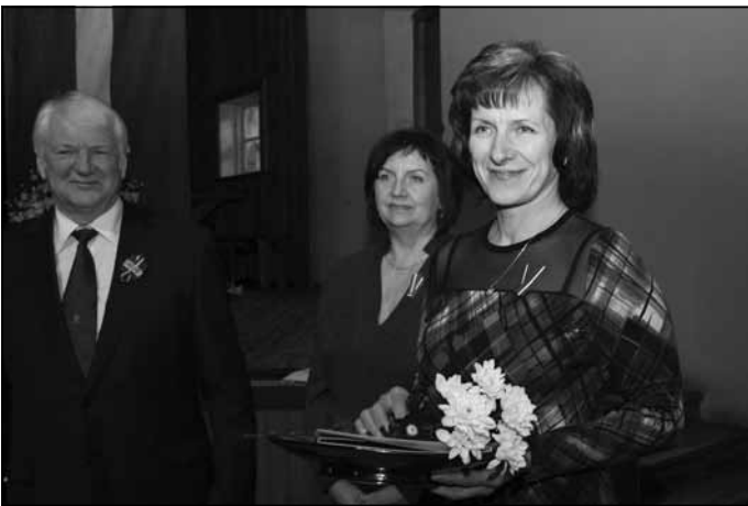
“Gada kolektīvs” – SIA “SIDGUNDA 2”