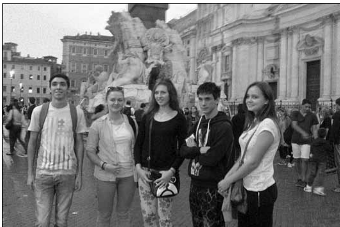
Kopā ar itāļu draugiem

Visi projekta dalībnieki bija ļoti atvērti un varēja viegli komuni-