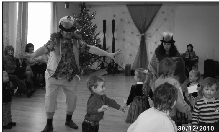
Eglīte pirmsskolas vecuma bērniem