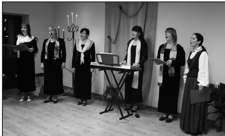
Vokālais ansamblis saieta nama atvēršanas pasākumā