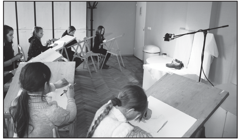
Jaunie mākslinieki iegrimuši darbā

22. martā Balvu Mākslas skolā notika Latvijas profesionālās ievirzes Mākslas skolu konkurss zīmēšanā Latgales skolām. Konkurss piedalījās 24 audzēkņi no astoņām skolām.