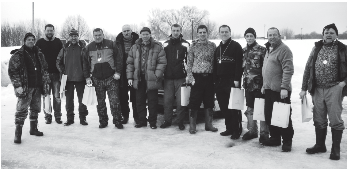
Pēc sacensībām. Kā katrās sacensībās pienākas, to noslēgumā bija svinīgā līnija un apbalvošana

- Patiesībā es neesmu zemledus makšķernieks. Varbūt pēc šī brauciena par tādu kļūšu. Bērniņā gan tiku pamēģinājis. Šoreiz kolēģi uzaicināja piedalīties, un es piekritu. Par braucieni ir vislabākie. Šādos izbraukumos darba kolēģus iepazīsti pavisam savādākus nekā darba kabinetos. Iesaku arī citiem rīkot šādus kopīgus izbraukumus.