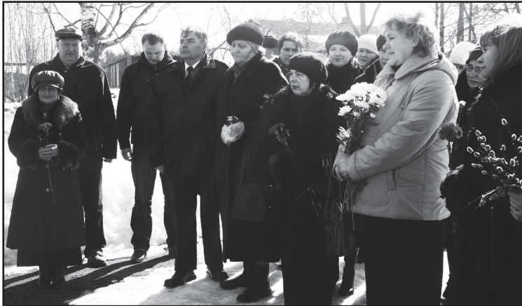
Piemiņas brīdis pie kādreizējās dzelzceļa stacijas

Koncertu sniedza senioru jauktais koris „Pīlādzis” un Kubulu garīgo dziesmu ansamblis „Vakarblāzma”, skanēja Andreja Eglīša dzeja.