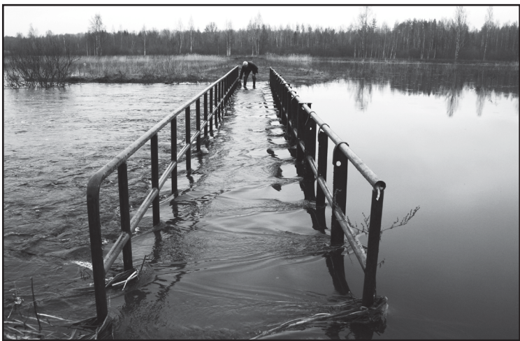
Pērnā gada plūdi Grīvgalā pie slūžām

Lai arī Balvu novadā izteiktu plūdu draudu nav, pašvaldība sadarbībā ar Valsts ugunsdzēsības un glābšanas dienestu apzina esošo situāciju un seko notikumu gaitai.