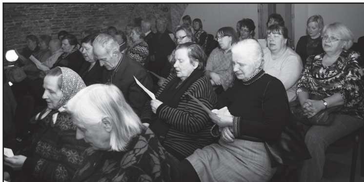
Kopīgās dziesmas raisa atmiņas