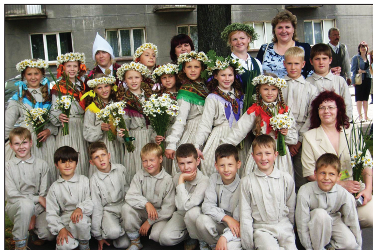
Deju kolektīvs kopā ar iestāžu un kolektīva vadītājiem 2008. gada Dziesmu svētkos

pulksten 17.00 Kubulu kultūras namā jubilejas koncertā „Es mācēju danci vest”.