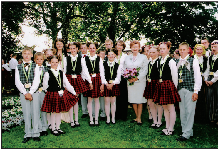
Kopā ar Valsts Prezidenti Vairu Viķi - Freibergu 2005.gadā

Kopš 2004. gada „Cielaviņa” ikgadus janvāra beigās organizē