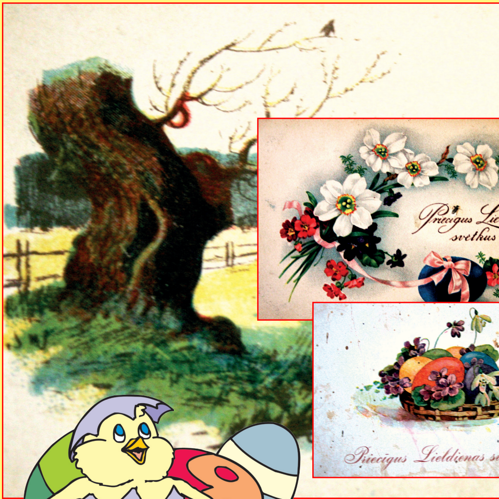
Senlaicīgās kartiņas no izstādes Balvu bibliotēkā

Lai pavasara saules siltums un zaļais asnu plaukšanas prieks dod jums enerģiju, darba prieku un visu ieceru piepildījumu! Saulainas un gaišas Lieldienas! Balvu Novada Dome