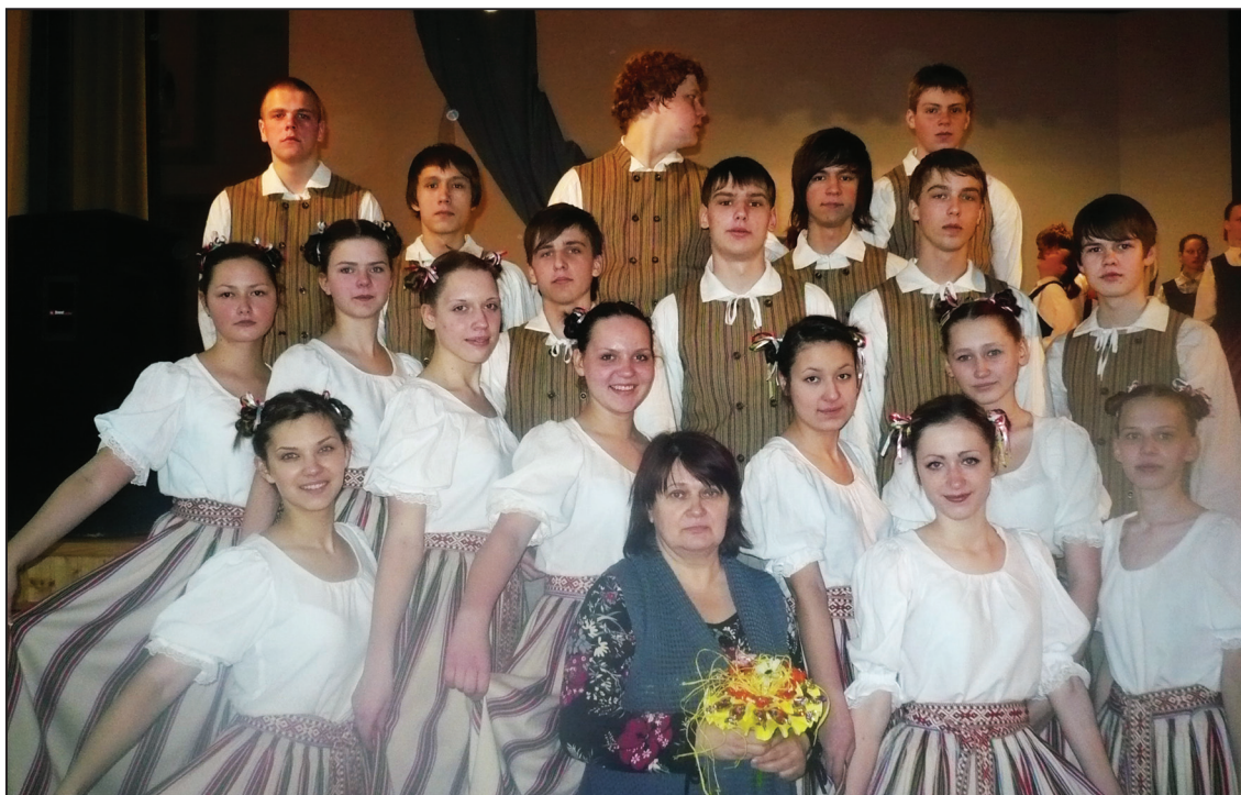
Kolektīvs 2011. gadā. Daļa no šiem dejojotājiem ir „Cielaviņā” jau desmit gadus