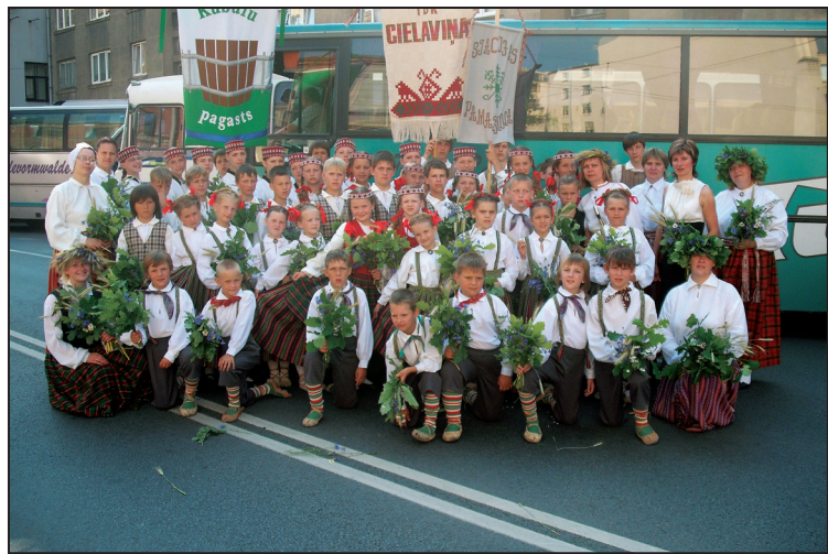
Latvijas skolu jaunatnes Dziesmu un deju svētkos 2010.gadā

Šogad 24. aprīlī kolektīvs nolēma nosvinēt savu pirmo nopietno jubileju - 10 radošus, panākumiem bagātus, veiksmīgus deju kolektīvu sastāvu.