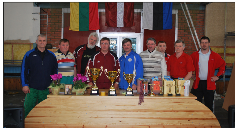
Sacensību dalībnieku treneri pirms sacensībām