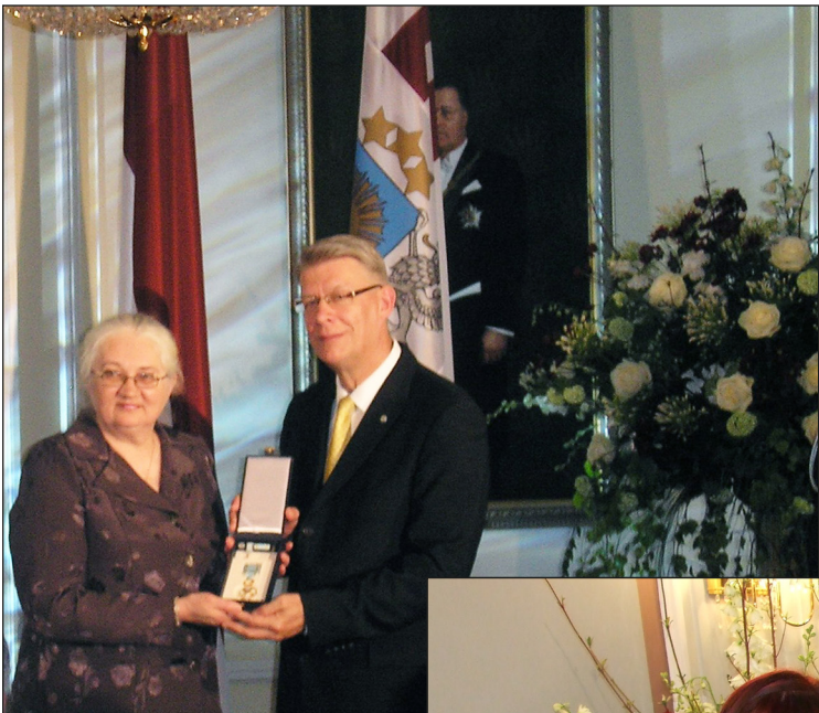
Vaira Resne kopā ar Valsts prezidentu Valdi Zatleru pēc apbalvojuma saņemšanas