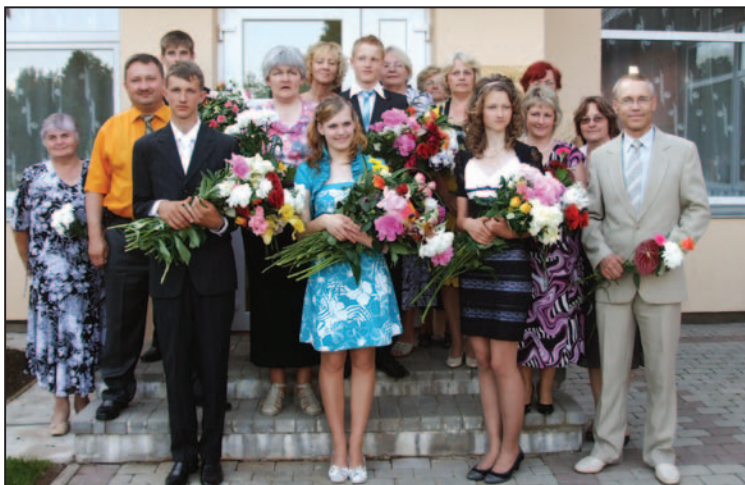
Skolas izlaidumā 2011. gada jūnijā