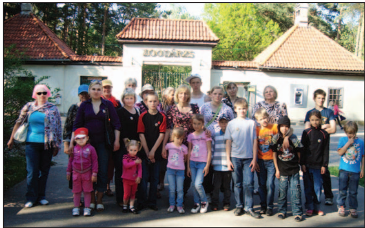
"Meža dienu" ekskursijā