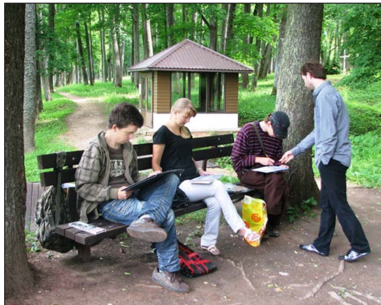
Plenērs Balvu ezera krastā. Datordizaina studenti izmanto jauko laiku un gatavo darbus ieskaitei un jaunajai izstādei

Augstskolu Latvijā ir daudz. Arī Balvos tiek gaidīti jauni studenti. Izmantojiet iespēju studēt mājās!