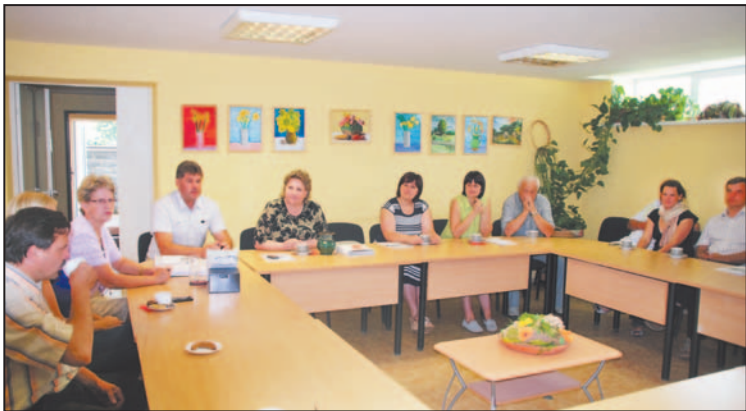
Kopā ar Vecumnieku kolēģiem