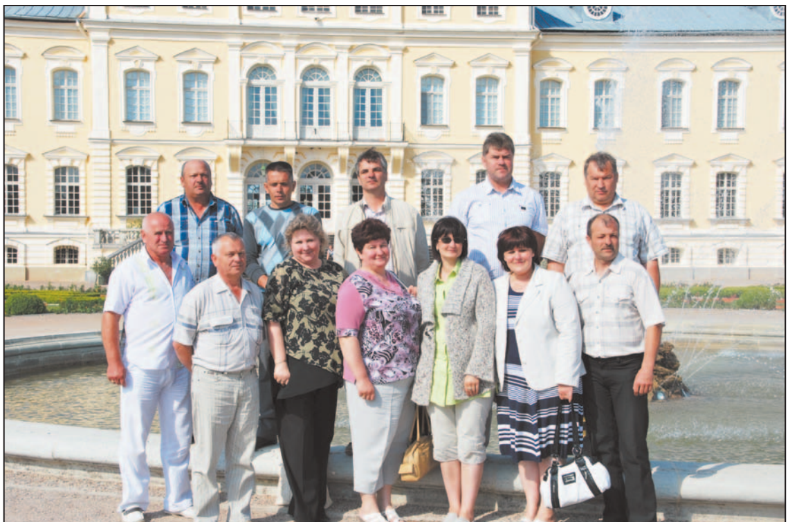
Balvu novada Domes darbinieki pie Rundāles pils. Bija tik skaisti, ka nevarējām nefotografēties