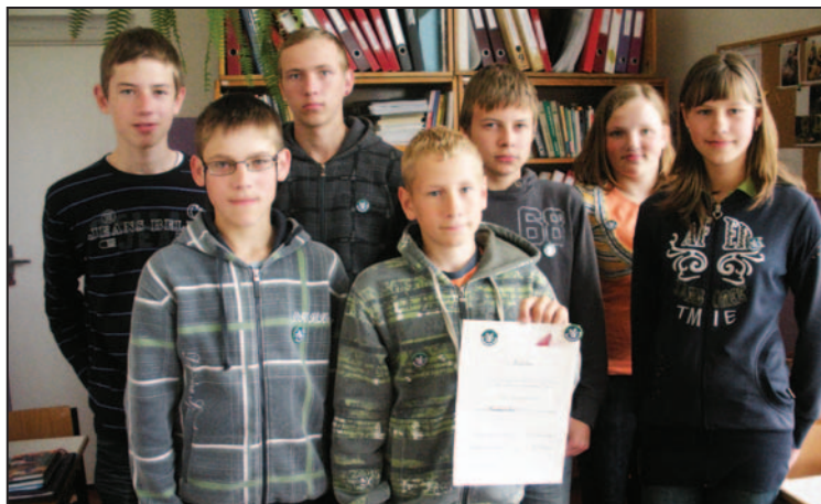
Laureāti projektā "Nesmeķējošā klase"

devāmies ekskursijā skolēni kopā ar vecākiem. Transporta izdevumu segšanai izmantojām sadraudzības Hjulsbroo skolas Zviedrijā ziedoto naudu.