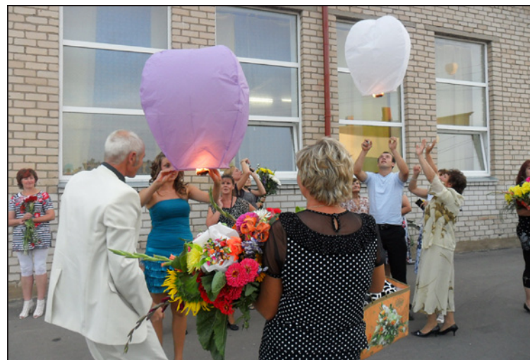
Zitas Mežales teksts un foto

Pasākums "Dziesma Bērzpiliņ" šogad notiek jau 14 reizi. Koncertā izskanēja 21 dziesma. Pavisam piedalījās 74 dalībnieki.