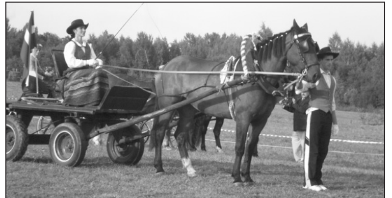
Alīta un Andis Meijeri no Alūksnes izcīnīja 2. vietu jaunzirgu sacensībās, braucot loka aizjūgā