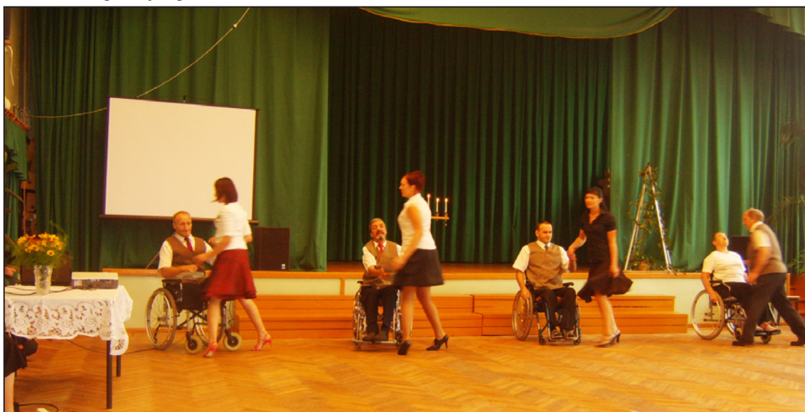
Emocionāli skaists bija ratiņdejojtāju priekšnesums

Judeiks dienas beigās atzina, ka pieredzes apmaiņas brauciena laikā viņa priekšstats mainījies par 180 grādiem un viņš varot piekrist spārnotajam teicienam, ka Balvu pilsēta esot mazā Ventspils.