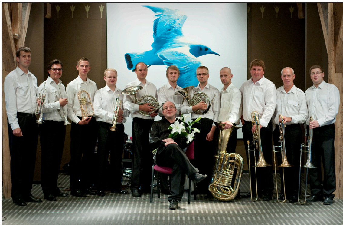
LSO Metāla pūšamo instrumentu ansamblis “Amber Sound Brass”

Materiālu sagatavoja Viktors Hrustaļovs, Liepājas Simfoniskā orķestra izpildproducents