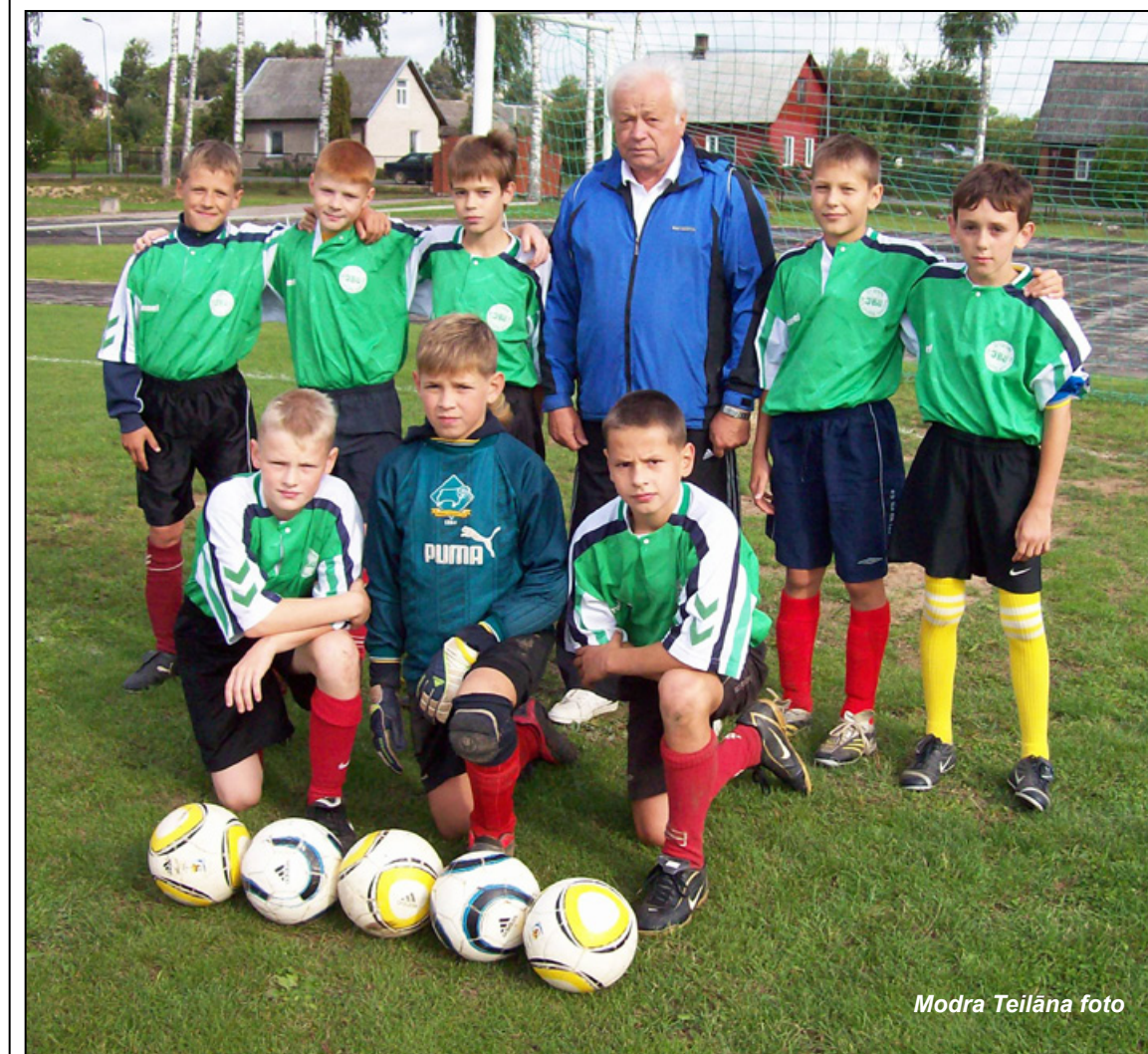
Pamatskolas zēni. Šī komanda šosezon spēlēja visvairāk un izcīnīja 1. vietu U 12 vecuma grupā