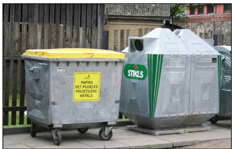
ECO punkts pilsētās

Tā veiksmīgas darbības pamatā ir laba sadarbība ar vietējām pašvaldībām, iedzīvotāju atsaucība un ieinteresētība, kā arī profesionāli darbinieki.