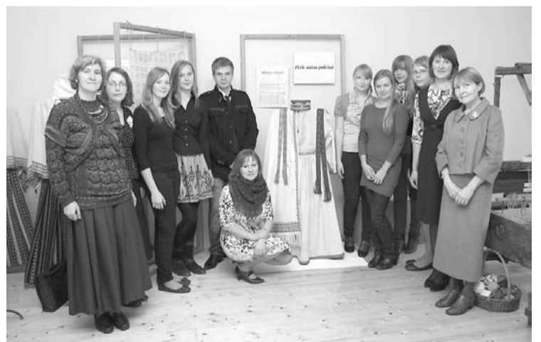
„Abrenes tērpa atdzimšanas darbnīcas čaklie rūķīši”