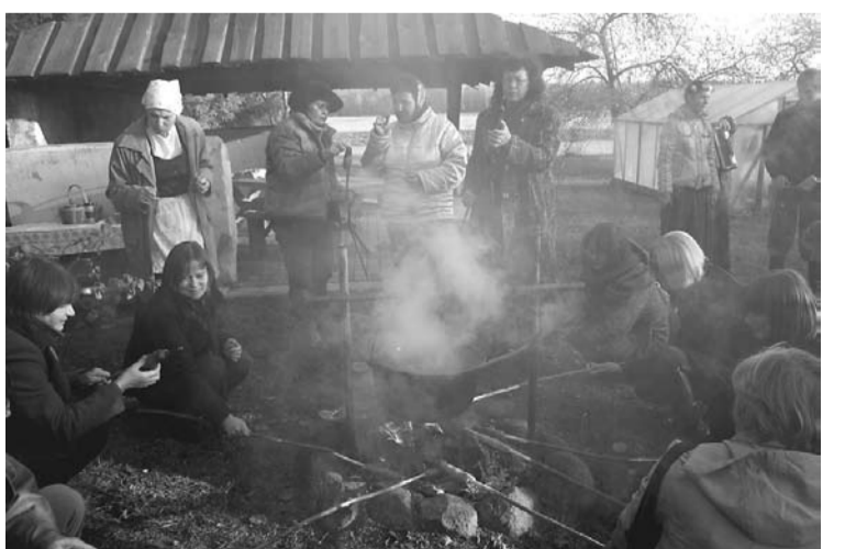
Pēc senlaiku tradīcijām maize tiek cepta arī ugunskurā