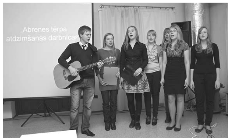
Īpaši sirsnīgs mirklis - Baltinavas jauniešu priekšnesums