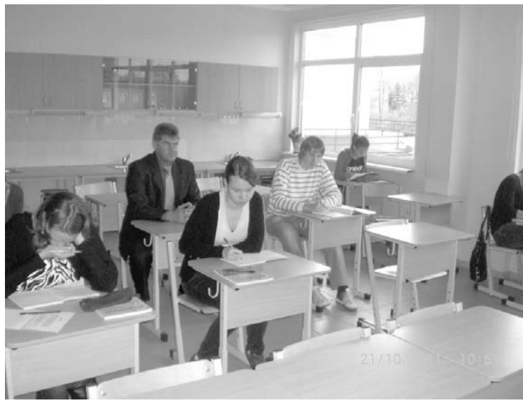
Kopā ar skolēniem skolas solā