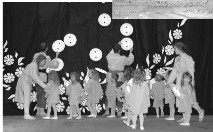
Pogas deju izpilda mazie bērniņi