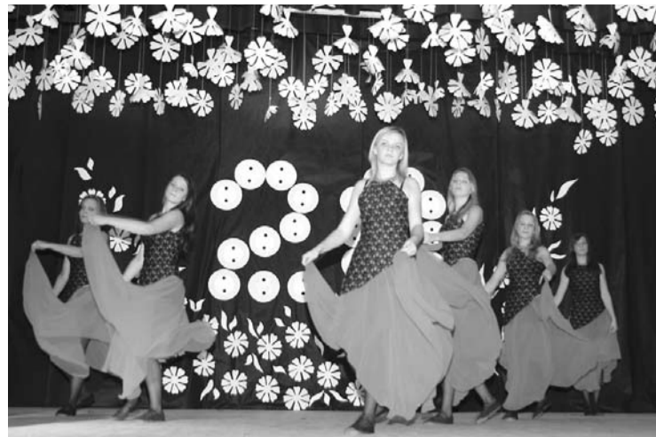
Krāšni tērpi, mūzika, tas pasākumu darīja vēl skaistāku

Pasākums izskanējis, ir patiess gandarījums. Saņemtie pateicības vārdi iedvesmo turpmākajam darbam, dod pārliecību, ka ceļš, kuru ejam, ir pareizs un nav