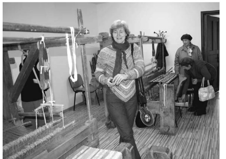
Bērzpils audēju darbnīcā