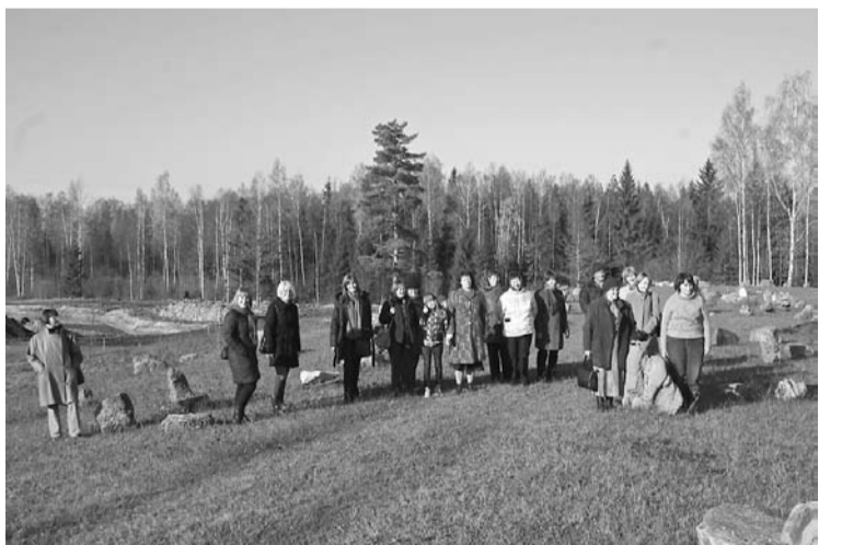
Konferences dalībnieki Tilžas pagasta „Ezerlīčos”