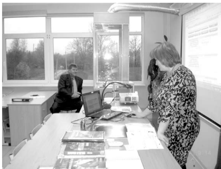
N. Dimitrijevs seko skolotājas stāstījumam

Tilžas vidusskolas pedagogi cer, ka akcija sekmēs pašvaldības izpratni par pedagoga darba ikdienu un ieinteresētību pilnve-