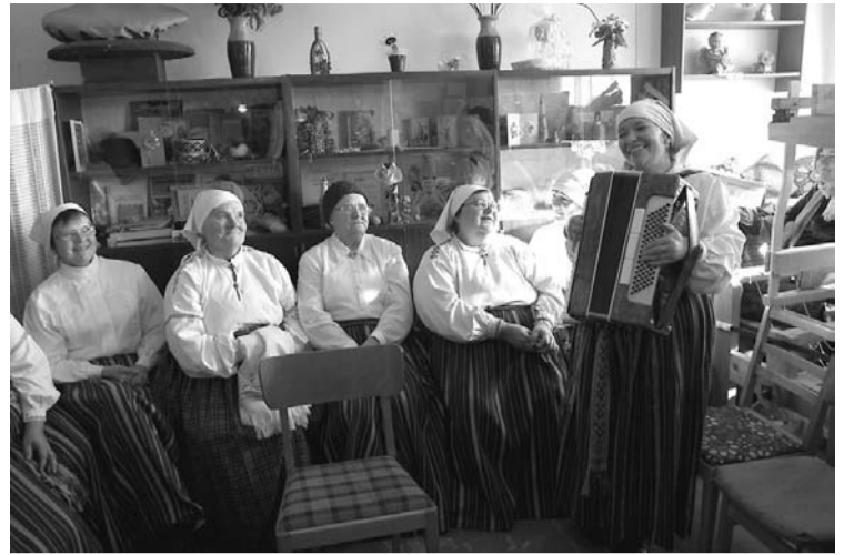
Tilžas „Rūķīšos” patīkamu pārsteigumu sagādāja Tilžas folkloras kopa