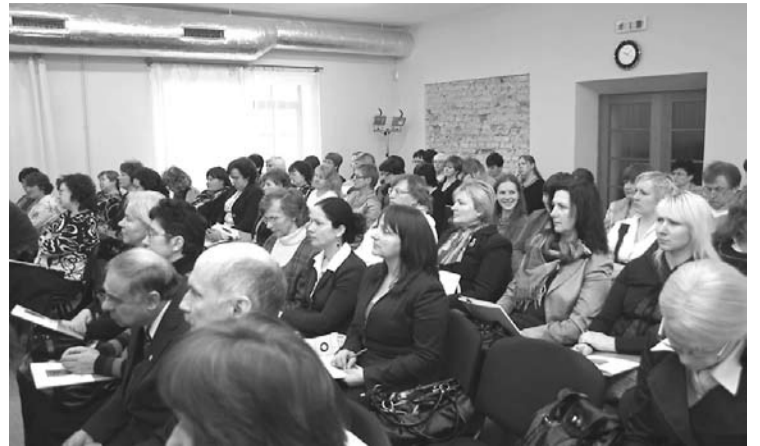
Konference plaši apmeklēta