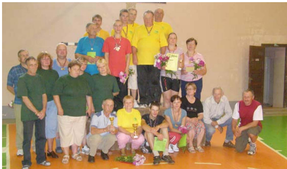
Pēc apbalvošanas invalīdu sporta un rehabilitācijas kluba Medņeva rīkotajās sporta spēlēs cilvēkiem ar invaliditāti