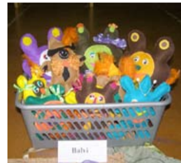
Invalīdu biedrības pārstāvji cītīgi strādāja pie rotaļlietu izgatavošanas Gulbenes invalīdu biedrības rīkotajā pasākumā "Nāc un dari"

Balvu teritoriālās invalīdu biedrības valde