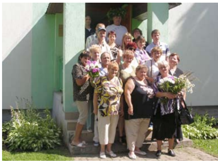
Biedrības rīkotajā Pētdienas pasākumā kopā ar ciemiņiem

Invalīdu biedrībai ir īpašs statuss jau ar to, ka tā ir sabiedriskā labuma organizācija, kas sniedz labumu tieši tai sabiedrības daļai, kam jau pāri nodarīts no likteņa puses - cilvēks kļuvis invalīds. Tādam cilvēkam vajag vietu, kur aiziet, izstāstīt savas problēmas, lūgt morālu atbalstu, aprunāties ar cilvēkiem, kas ir tādā pašā