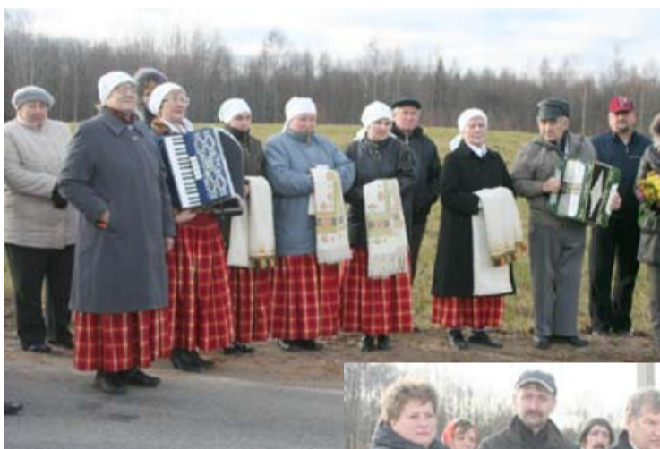
Briežuciema etnogrāfiskais ansamblis dzied par godu jaunajam asfaltam uz senā ceļa