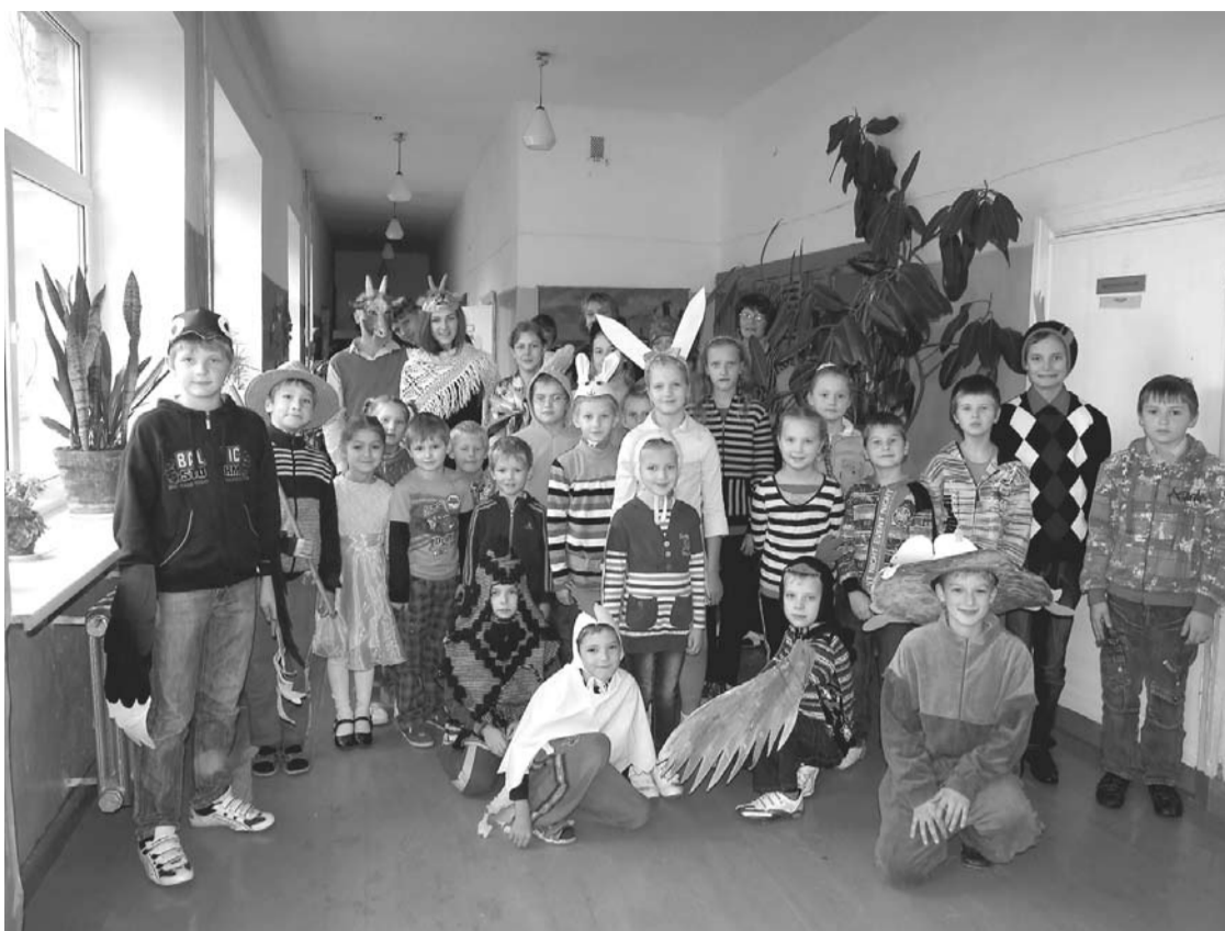
Krišjāņu skolas audzēkņi Mārtiņdienā

Abas skolas aktīvi uzsākušas mācību gadu. Jau otro gadu Bērzpils vidusskolas klases iesaistās Apgāda Zvaigzne ABC