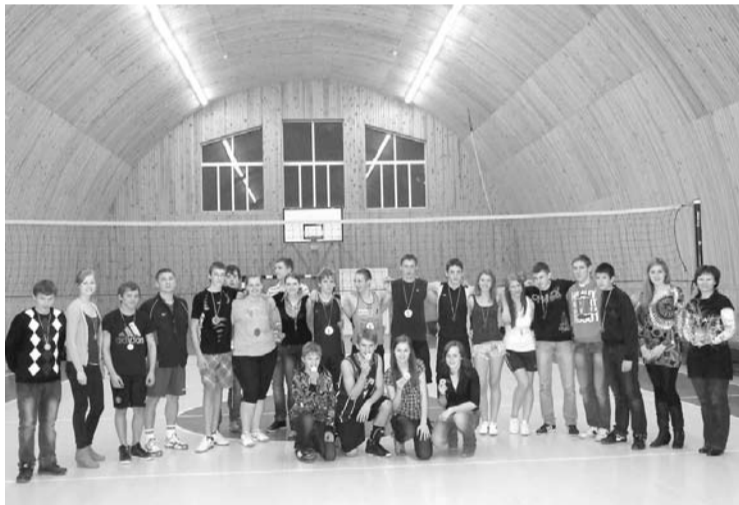
Bērzpils vidusskolas audzēkņi, kas piedalījās skolas sacensībās, ko organizēja Skolēnu pašpārvalde un sporta skolotājs A.Rižais