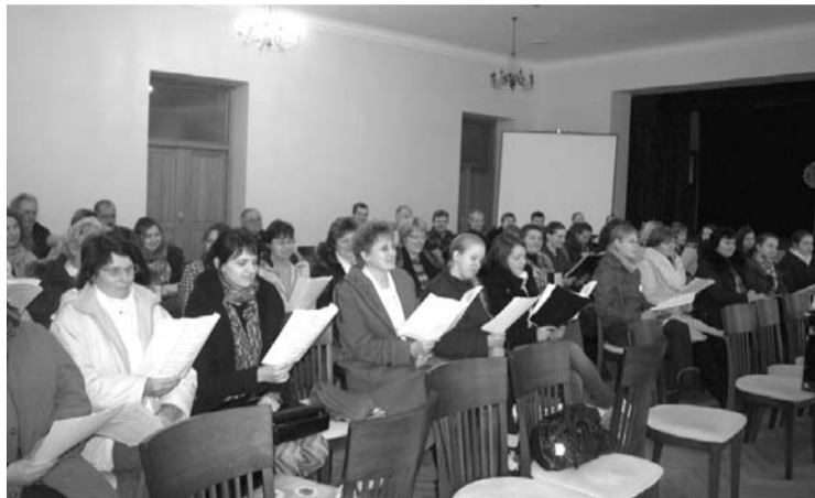
Jaukto koru dalībnieki mēģinājumā