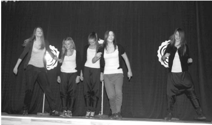
Di -dancers iepriecina ar savu priekšnesumu

Gada jaunieti izvēlējās komisija, kura aizklāti balsoja par savu favorītu. Komisijas sastāvā bija deviņi pārstāvji. Katram komisijas loceklim bija savs viedoklis