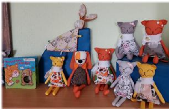
Madaras Zaķes rotaļlietu izstāde "Rotaļlietu brīnumdārzs"