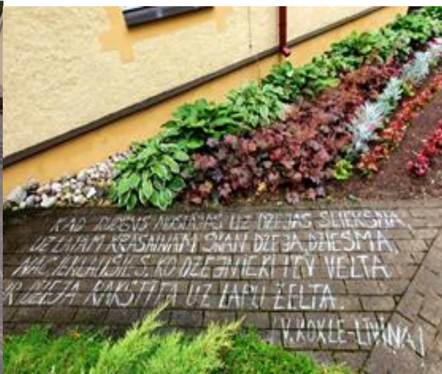
Pie Bejas bibliotēkas

Jaunākie sadarbības partneri atskaites gadā pagastu bibliotēkām: