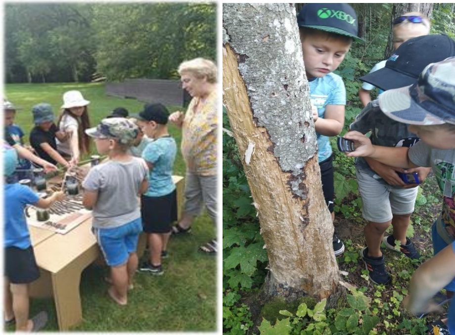
Izzinoša nodarbība “Dabas vēstules” noritēja Jaunannas Zaķu salā

Sadarbībā ar centra Europe Direct Gulbene, Dabas aizsardzības pārvaldi un Jaunannas bibliotēku, Alūksnes novada bibliotēka vasaras nogalē Jaunannas Zaķu salā organizēja izziņošu nodarbību “Dabas vēstules”.