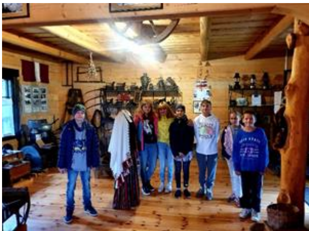
Skolēni iepazīstas ar vēstures krātuves ekspozīciju