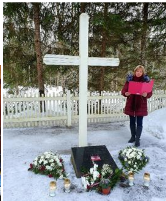
Piemiņas brīdis Bejas somu karavīru Brāļu kapos

Malienas bibliotēkā novadpētniecības krājums izvietots novadpētniecības istabā. Atvērta novadpētniecības istaba 2006.gadā. Materiāli savākti no vietējiem iedzīvotājiem. Viss inventārs ir uzskaitīts. 2018.gadā veikts remonts, atjaunota ekspozīcija. Novadpētniecības istaba pie bibliotēkas skaitās no tās atvēršanas brīža.