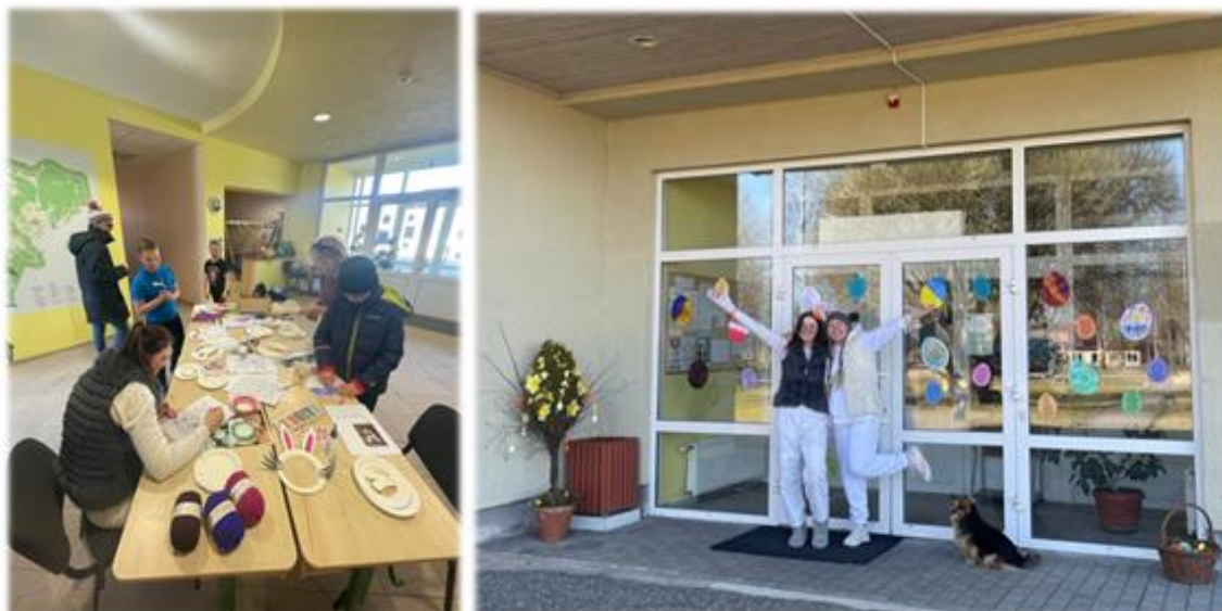
Nodarbības un aktivitātes Ilzenes bibliotēkā.

Ilzenes bibliotēkā bērni un jaunieši tiek rosināti līdzdarboties pasākumu organizēšanā, tā apgūstot jaunas prasmes. Bērni un jaunieši iesaistījās Ilzenes pagastā organizētajos pasākumos - Lieldienu tradīciju aktivitātēs pirmskolas un jaunāko klašu bērni tika uzrunāti, lai iesaistītos dekoru veidošanā, kurus izvietoja izstādes veidā uz logiem un durvīm, pievienojot klāt ticējumus par Lieldienām. Apgūtas svētku tradīcijas – ticējumi, olu krāsošana, meklēšana, ripināšana.