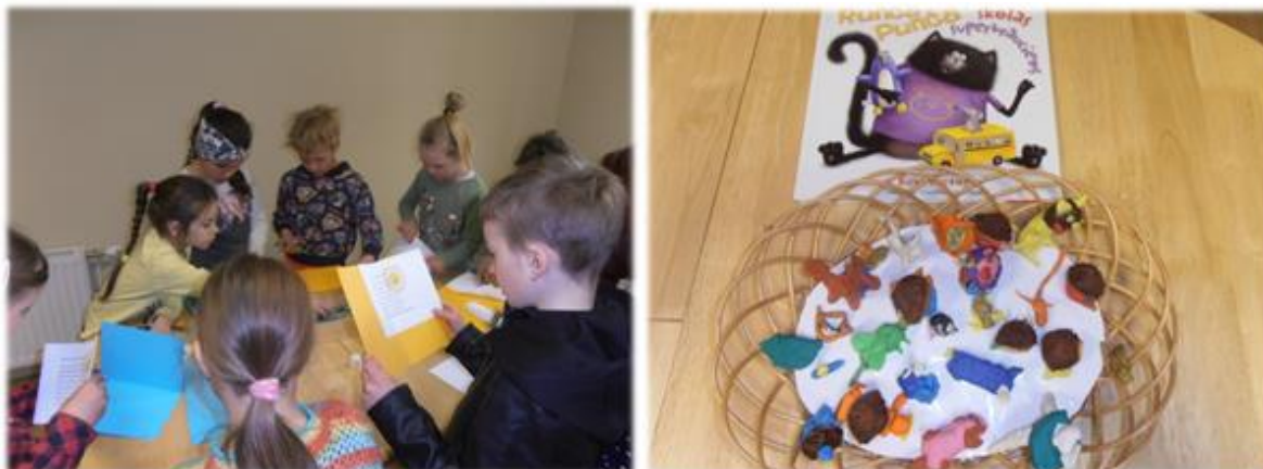
Radošās nodarbības bērniem Malienas bibliotēkā.