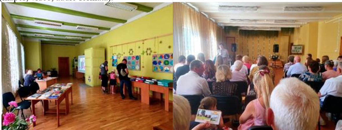
Bejas pamatskolas un Bejas bibliotēkas kopdarbs - Bejas pamatskolas 155 gadu jubilejas pasākums “Ceļojums laikā”

Bejas bibliotēka jau atkārtoti piedalās Muzeju nakts pasākumā, kad ir Atvērto durvju diena vēstures krātuves telpās. Bibliotēka piedalījās Bejas pamatskolas 155 gadu jubilejas pasākuma “Ceļojums laikā” organizēšanā. Pirms pasākuma, vairāku mēnešu garumā, notika darba grupas kopējās sapulces Bejas bibliotēkā, plānojot skolas jubilejas norises. Tika izmantoti vēstures krātuves materiāli (mapes, albumi, fotogrāfijas, grāmatas u.c.). Pirms un pēc jubilejas pasākuma un tā norises dienā bibliotēkas zālē varēja iepazīties ar skolas vēstures liecībām (mapēs, video, audio formātā).