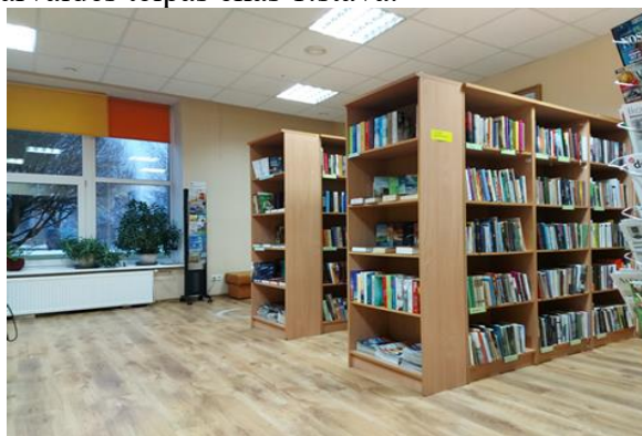
Alūksnes novada Ilzenes bibliotēka apmeklētājiem tagad pieejama ēkas 1.stāvā.

Tā kā ar 01.01.2023. Alūksnes novada teritorijā pagastu pārvaldīšanu nodrošinās jauna iestāde – Alūksnes novada pagastu apvienības pārvalde, kas izveidota, reorganizējot un apvienojot līdzšinējās pagastu pārvaldes, tad, atbrīvojoties pagasta pārvaldes telpai, Ilzenes bibliotēka jau esošajā ēkā pārcēlusies uz bijušās pagasta pārvaldes telpām ēkas 1.stāvā, kļūstot bibliotēkas lietotājiem pieejamāka. Līdzīga situācija arī Malienas pagastā - bibliotēka aizņēmusi bijušās pagasta pārvaldes telpas ēkas 1.stāvā.