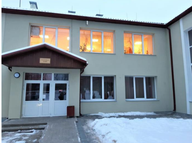
Energoefektīvi uzlabota Alūksnes novada Annas pagasta kultūras nama un bibliotēkas ēka.

2023.gadā plānots - izremontēt bibliotēkas kāpņu telpu, nobruģēt laukumu ārā pie ieejas bibliotēkā, izvietot soliņu, velosipēdu novietni, laukumā pretī bibliotēkai izveidot āra lasītavu.