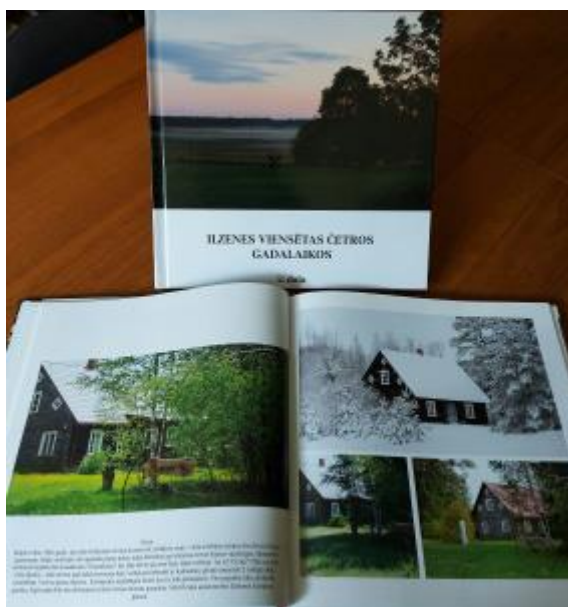
Foto grāmata " Ilzenes viensētas četros gadalaikos".