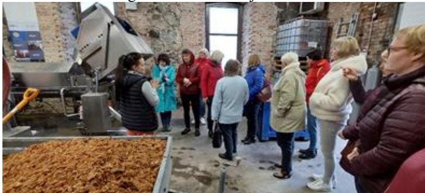
Sidra ražotnē “Tālavas” Gulbenē

Alūksnes novada bibliotēka organizēja izziņošu braucienu “Pieredzes stāsti. Savējie iedvesmo!”, kura laikā devām iespēju satikt uzņēmējus un aktīvus cilvēkus Gulbenes novadā! Izziņošā brauciena laikā tika apmeklēta saimniecība “Pededzes” Litenē, saimniecība “Dzelzavieši” Stāmerienas pagastā, ražotnes “Tālavas” un “Pakalnieši” Gulbenē, lai uzzinātu šo uzņēmēju veiksmes stāstus un gūtu iedvesmu savējiem!