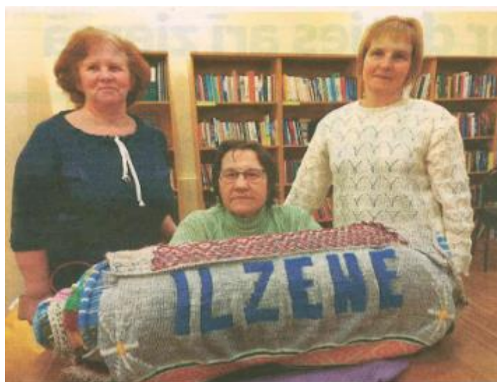
Ilzenes adītājas šallē ieadījušas savu pagasta vārdu un pīpenes, kas ir pagasta ģerbonī, lai citi uzzinātu, ka Latvijā ir tāda vieta Ilzene.