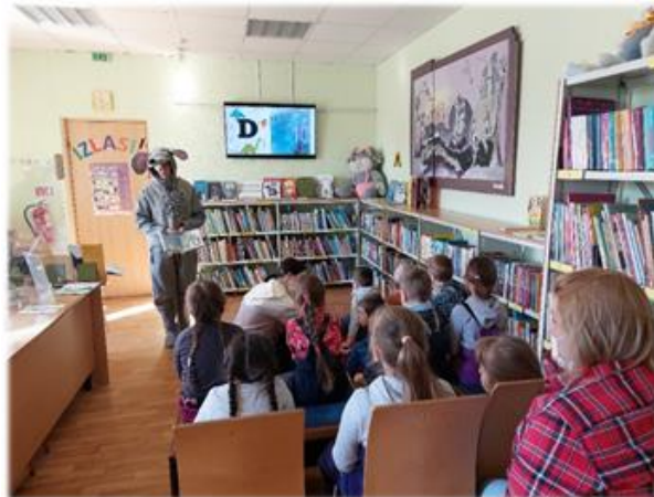
Literārā stunda Alūksnes novada bibliotēkā kopā ar Bibliotēkas peli

Martā bibliotēku apmeklēja PII “CĀLIS” vecākā grupiņa un PII “Pienenīte” divas vecākās grupas, kuras piedalījās literārajā stundā par alfabēta burtiņiem.