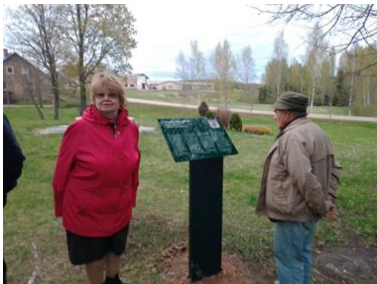
Muzeju nakts pasākumā atklāja izlikto informācijas stendu par Saules pulksteni