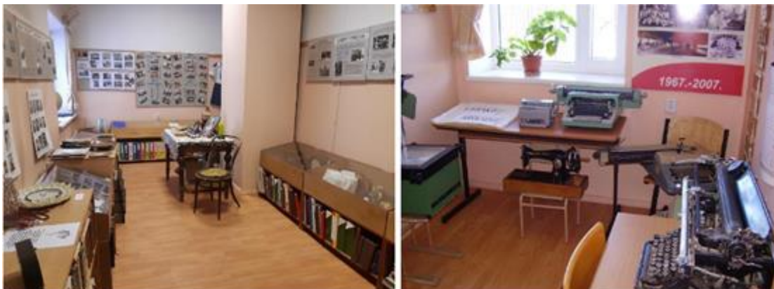
Annas novadpētniecības istaba 2022. gadā

Annas bibliotēkas pārraudzībā ir pagasta novadpētniecības istaba, kurā izvietoti dažādi vēsturiski materiāli (dokumenti, albumi, dažādi priekšmeti – laika liecinieki utml.), ir daļēja vienību uzskaitē, nav piešķirts atsevišķs statuss.