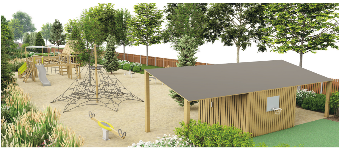
Viena no projekta ieceres vizualizācijām

Informāciju sagatavojuši Preiļu novada pašvaldības Attīstības, investīciju un inženiertehniskā daļa