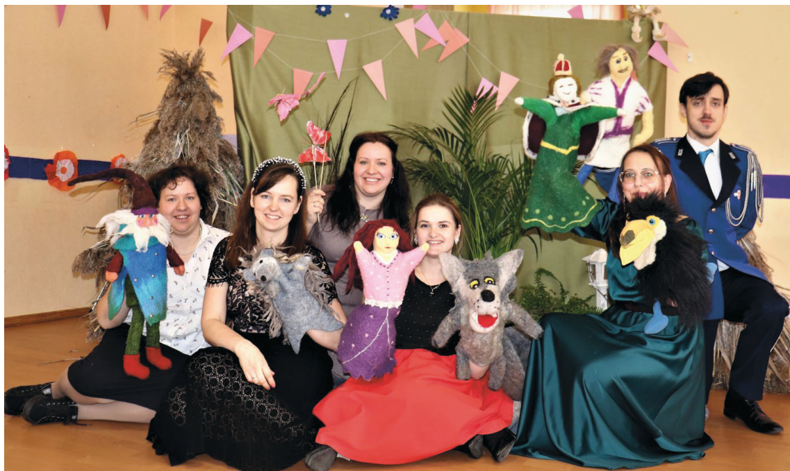
Atraktīvie biedrības biedri un draugi pēc leļļu teātra izrādes demonstrēšanas Princešu un prinču ballē

Rudenī bijām iesaistījušies vairākās veselības veicināšanas projektu aktivitātēs, kad rīkojām izglītojošus pasākumus Līvānu un Preiļu novadu cilvēkiem. Novembrī un decembrī aicinājām iziet no mājām un kopīgi darboties radošajās darbnīcās. Pavisam nesen – 11. un 12. februārī Vārkavas muižas pilī rīkojām apkārtnes bērniem krāšņu un skaistu pasākumu "Princešu un prinču ballē", kura laikā bērni varēja piedalīties radošajās darbnīcās, tikt pie sejiņu zīmējumiem, skatīties leļļu teātra izrādi un kārtīgi izdejojies. Šobrīd biedrībā vēl turpinās Aktīvo iedzīvotāju fonda atbalstītais projekts "Speram soli uz priekšu!", kura laikā esam ļoti daudz mācījušies par organizācijas vadību, attīstības plānošanu un saimnieciskās darbības attīstīšanu,