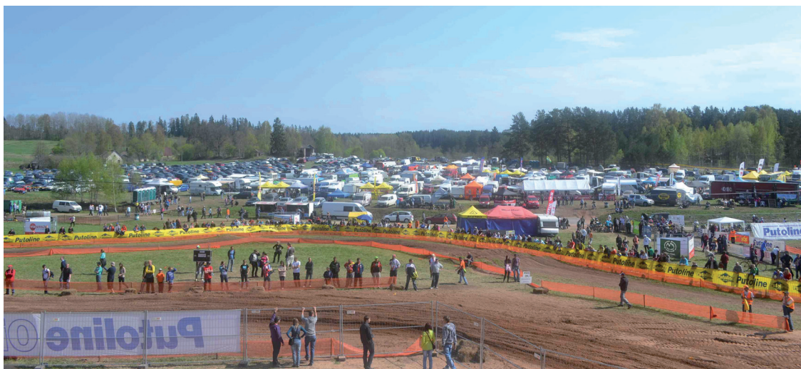
Vaidavas kauss Apē

- Pastāstiet, lūdzu, par motokluba izveidi!