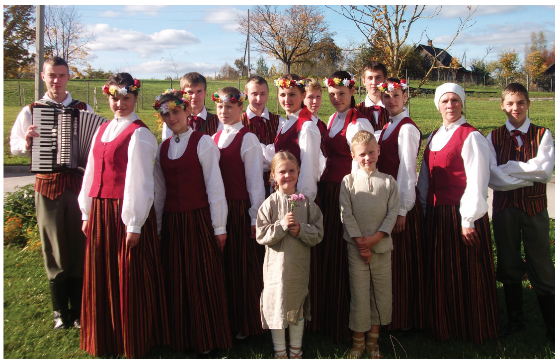
“Soldoni” pēc skates Tilžā

2. Cik kopā ir dalībnieku un kādas vecuma grupas tiek pārstāvētas? Kopā ir 15 dalībnieki – astoņus līdz astoņpadsmit gadus veci. 3. Visiem noteikti interesē, kādēļ tieši „Soldoni”? Par kopas nosaukumu ilgi nevarēja vienoties, jo folkloras kopai piemērotie nosaukumi visi likās jau kaut kur dzirdēti, gribējās ko interesantu. Dodoties uz iepriekšējo folkloras festivālu „Baltica” nosaukuma tā kā vajadzēja, un tad sākās ideju