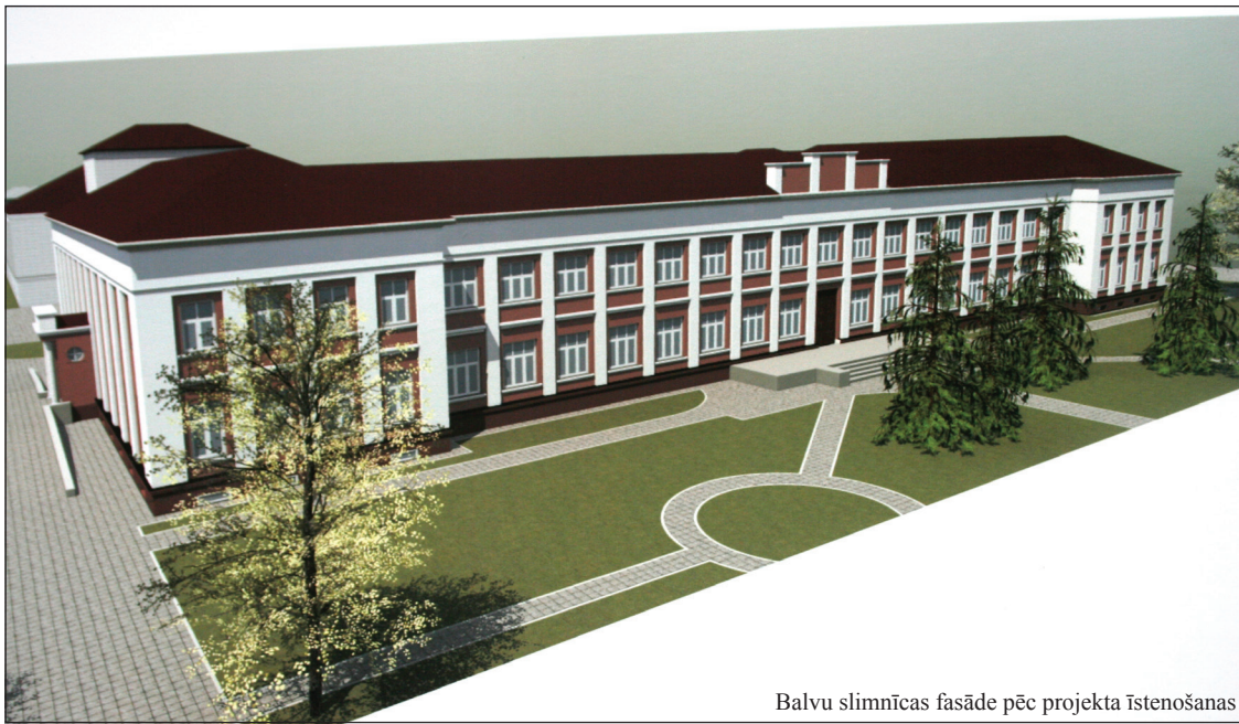
Balvu slimnīcas fasāde pēc projekta īstenošanas

nodaļu, to aprīkojot ar divpusēju pandusu un nojumi, renovējot traumpunktu ar manipulāciju telpām. Esošajās ķirurģijas nodaļas telpās būs paredzēts izvietot terapijas un neiroloģijas nodaļu, savukārt esošajās terapijas nodaļas telpās paredzēts izvietot ķirurģijas nodaļu ar manipulāciju telpām. Dzemdību nodaļa paliks vecajā vietā, savukārt ginekoloģijas nodaļa tiks pārvietota uz otro stāvu blakus dzemdību nodaļai. Esošās ginekoloģijas nodaļas vietā būs bērnu slimību nodaļa, bet tās vietā būs izvietoti ārstu speciālistu ambulatoro pieņemšanu kabineti, fizikālās medicīnas kabineti un funkcionālās diagnostikas izmeklējumu telpas. Projekta gaitā tiks nomainīta ventilācijas sistēma, kanalizācijas un