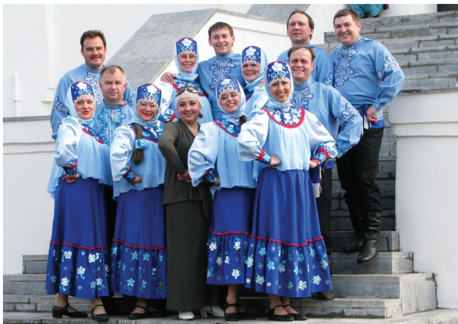
Pirmo reizi svētkos piedalās Krievijas Pleskavas pilsētas ģimeņu deju kopa „Zavalinka”

2005.gadā tika atjaunots kolektīva sastāvs un programma. Kopš 2006.gada kolektīva nosaukumu ir “Ežerūnas. Deju ansamblis ir piedalījies arī Eiropas Savienības pārrobežu sadarbības programmā Interreg III projektā “Baltā”. Kolektīvs ir izcīnījis arī dažādas balvas Lietuvas Republikas konkursos, 2008. un 2010.gadā vecākajā tautas deju konkursā valstī ieguva 3.vietu, 2009.gadā kļuva par deju pāru konkursa uzvarētājiem.