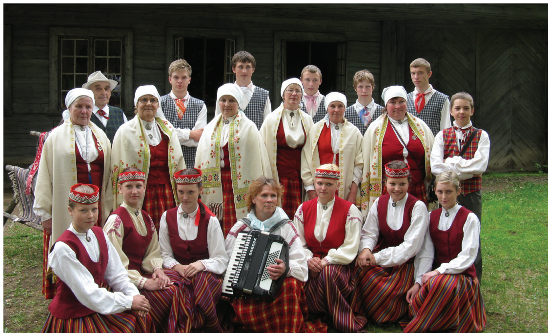
Folkloras kopa kopā ar etnogrāfisko ansambli “Latgales dienās” Brīvdabas muzejā