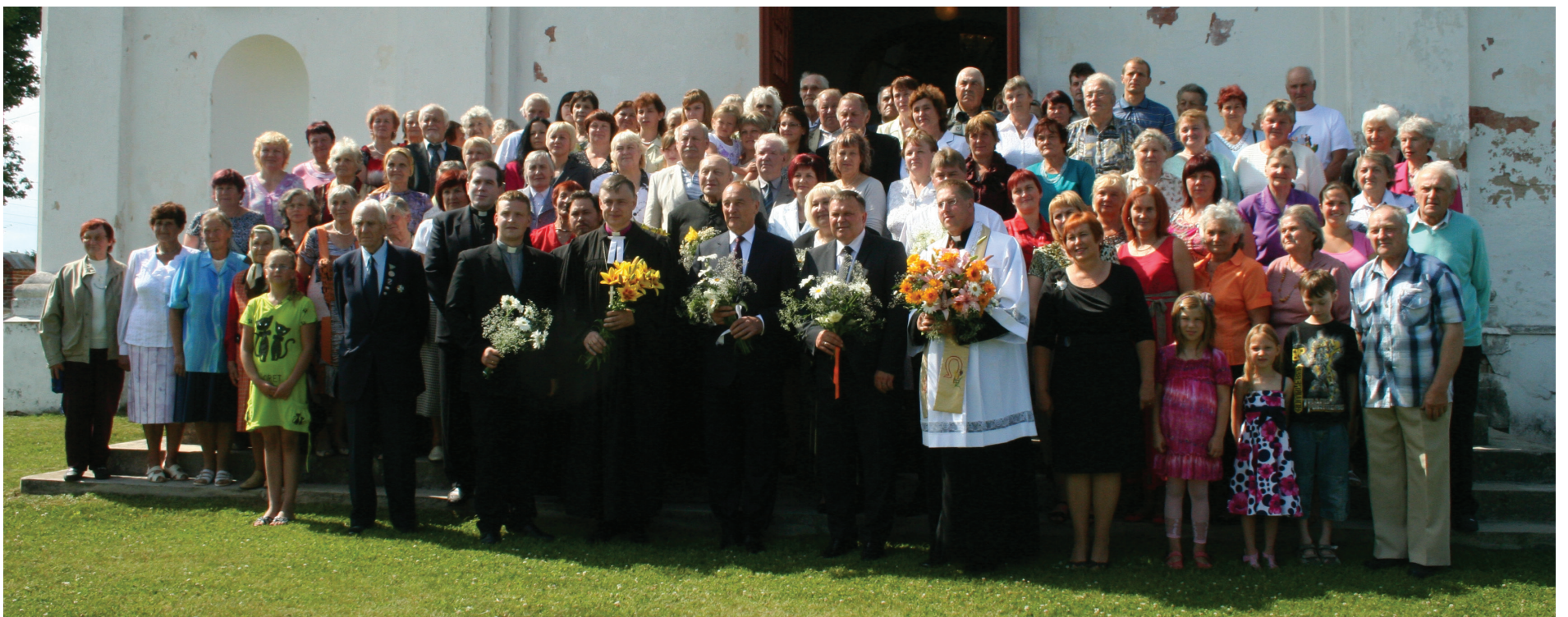
Foto pie Bērzu baznīcas, centrā - Valsts prezidents