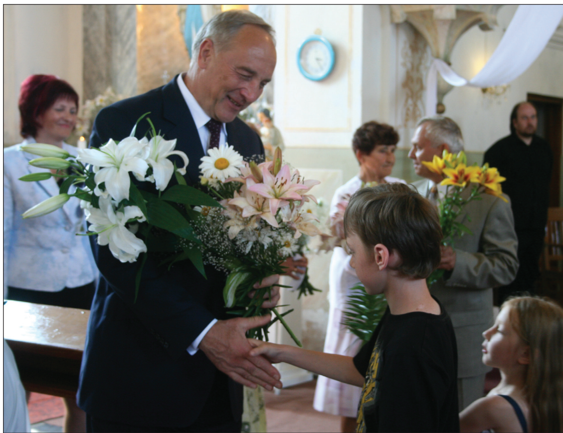
Rakstu lasīt 4.-5.lpp