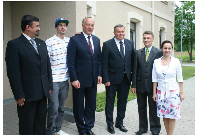
Pie Biznesa centra