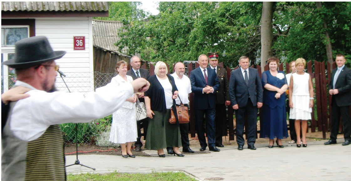
Bērzpils ielas atklāšana