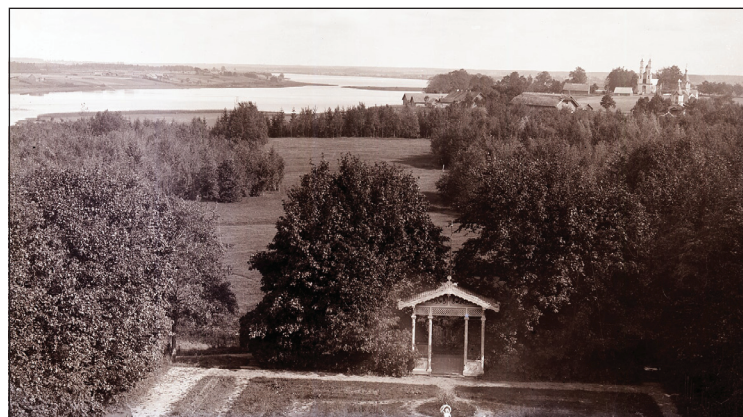
Ainava no Balvu muižas loga