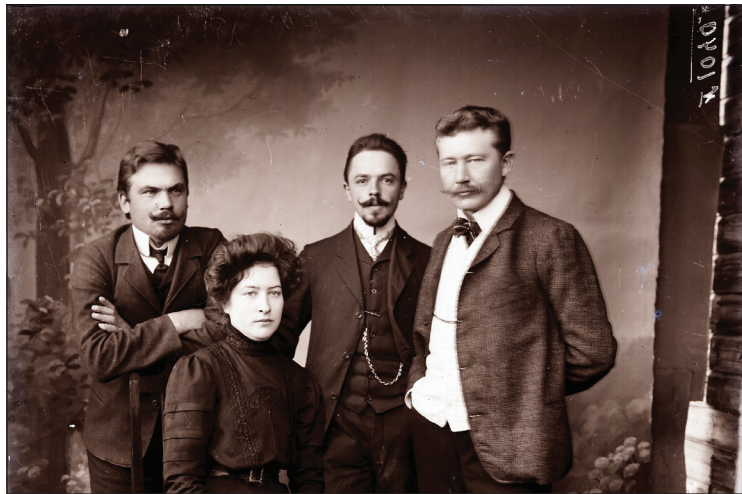
Kokorevas skolotāji 1909. gada oktobrī