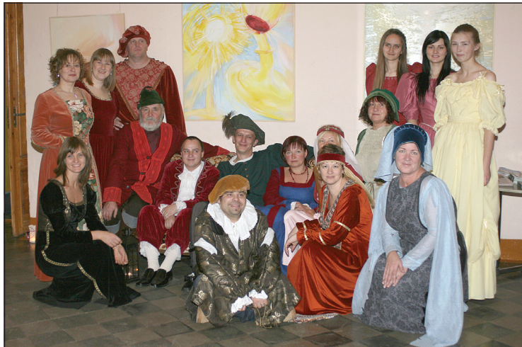
Pasākuma rīkotāju komanda