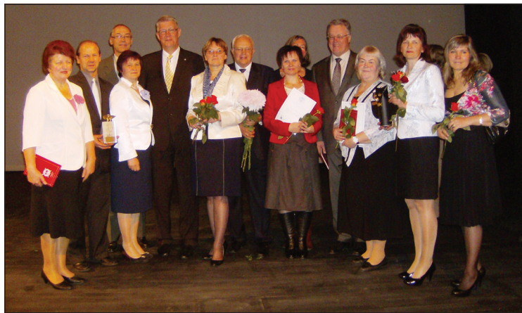
Tilžas un Bērzpils pedagogi kopā ar V.Zatleru, J.Endeli un G.Ulmani pēc svinīgās ceremonijas

Lai novērtētu izglītības līmeni Latvijas skolās, Draudzīgā aicinājuma fonds kopā ar Nordea banku apkopojis jaunākos Skolu reitinga rezultātus, nosakot labākās skolas Latvijā. Tika vērtēti skolu sasniegumi mācību priekšmetu olimpiādēs, ņemot vērā katras skolas skolēnu skai-