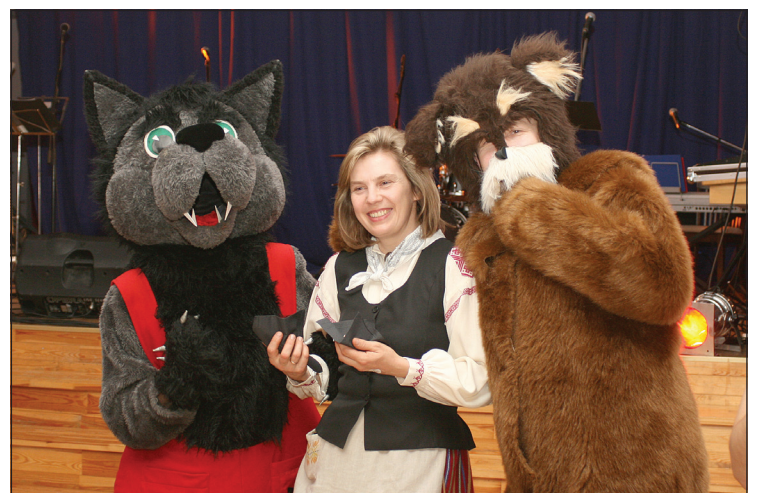
Balles dalībnieki atmiņai fotografējas ar Lāča dārza Lāci un Balvu Vilku