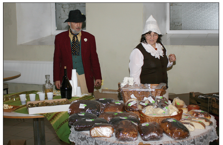
Zemnieku saimniecības „Birzupes” saimnieki no Stāmerienas piedāvāja pašceptu maizi, sieru un mājas vīnu