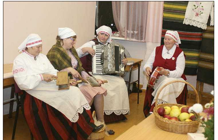
Baltinavas novada muzeja un etnogrāfiskā ansambļa pārstāves