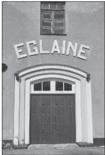
Парадная дверь на железнодорожной станции.

До 1998 года из Даугавпилса в Шяуляй можно было добраться на поезде через Эглайне.