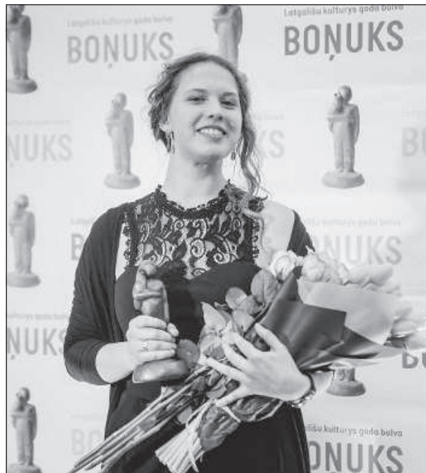
«Спридитис» Занда Манкопа.

Он является автором идеи и концепции фундаментальной книги «Фотографы Латгалии XIX-XXI веков» (2021). Книга содержит информацию о более чем 344 фотографах, ра-