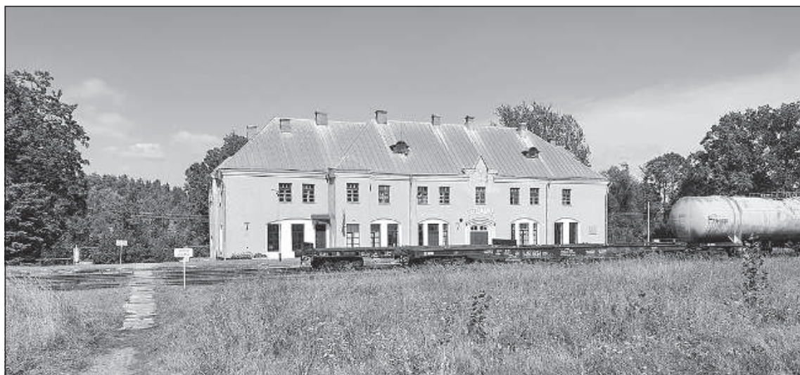
Большая железнодорожная станция в Эглайне.

Во время разрывов поселение Еловка практически полностью недоступно. Нынешний уполномоченный графа – человек, не заинтересованный в общем благе. Максимально увеличить доход, все больше и больше притесняя местных мелких крестьян, – вот девиз этого господина. Стоит другому трудяге обещать заплатить ренту за соседский дом на пять рублей больше, как ему тотчас же отдается предпочтение. Препятствием уполномоченный графа и основатель поселения Еловки был человек гуманный, таких «обещателей» ренты просто выгонял. Жителям поселения рекомендуется в важных случаях обращаться непосредственно к самому графу. – В Еловке полиция недав-