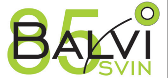
Balvu novada Dome

Sveicam Balvu iedzīvotājus pilsētas 85. jubilejā!