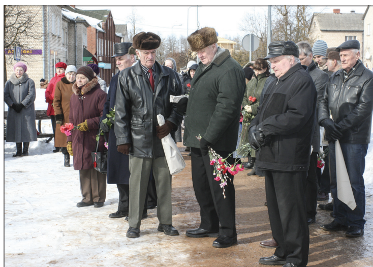
Atceres pasākuma dalībnieki

Katru gadu 25.martā visā Latvijā pie mājām tiek izkārti Latvijas karogi ar sēru lentēm. Šajā dienā 1949.gadā uz attālajiem PSRS reģioniem tika izsūtīti vairāk nekā 90 000 Baltijas valstu iedzīvotāju, gandrīz puse no viņiem bija no Latvijas.