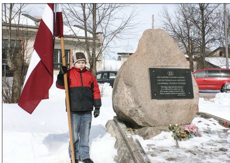
Piemīņas zīme Balvu stacijā - vieta, no kuras sākās daudzu Balvu puses iedzīvotāju moku ceļš uz Sibīriju