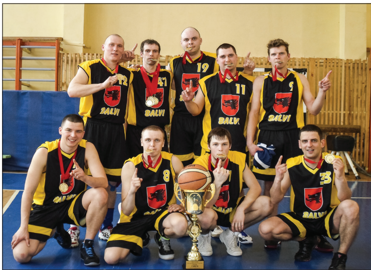
1.vieta Bastions Balvi

Balvu pamatskolā 23.martā norisinājās pēdējās Balvu novada atklātā basketbola čempionāta fināla spēles, kur par 5.-6.vietu