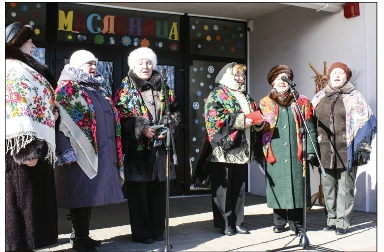
Dzied kultūras biedrības "Razdolje" sieviešu ansamblis