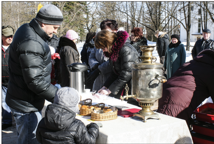
Tējas un pankūku pietika visiem

Balvos šos svētkus tradicionāli organizē krievu kultūras biedrība "Razdolje" un Balvu pamatskola. Arī šoreiz neizpalika nedz jaunās dziesmas un dejas, rotaļas, vizināšanās zirgu kamanās un, protams, pankūku ēšana. Pasākumā piedalījās gan jauni, gan cienījama gadagājuma dažādu tautību balvenieši.