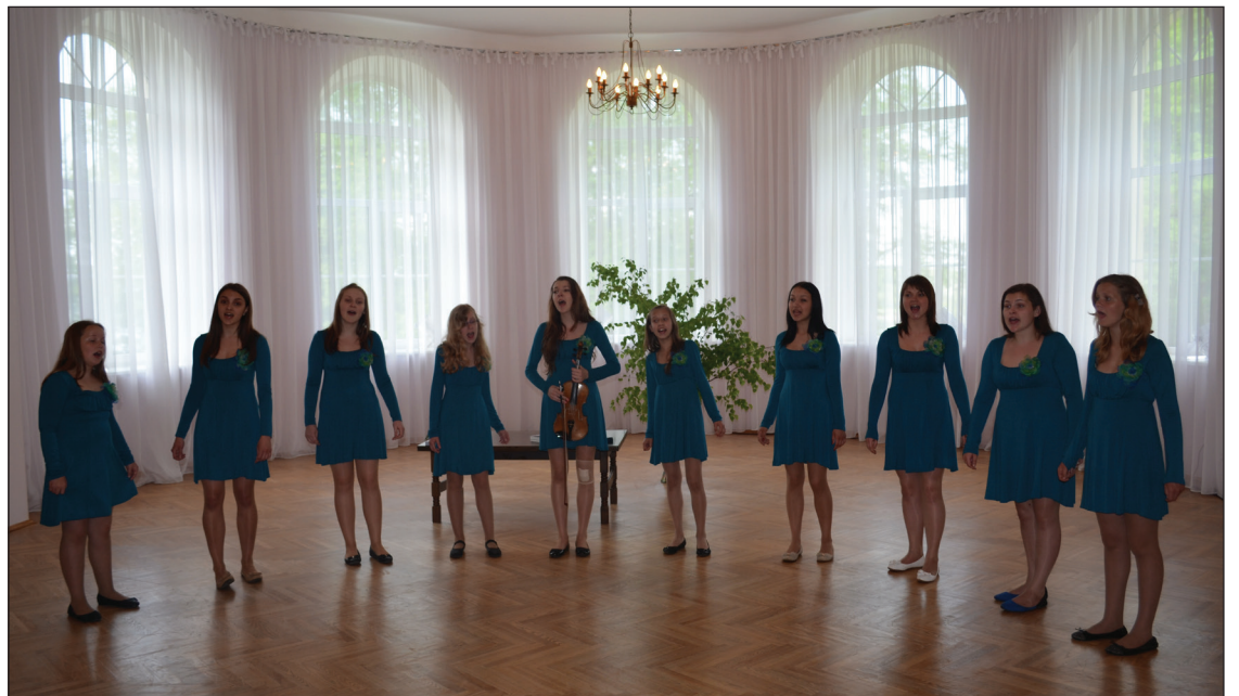
Ar skanīgām balsīm un profesionāliem priekšnesumiem skolēnus, skolotājus un viņu vecākus sveica Tilžas vidusskolas vokālais ansamblis „Varbūt”