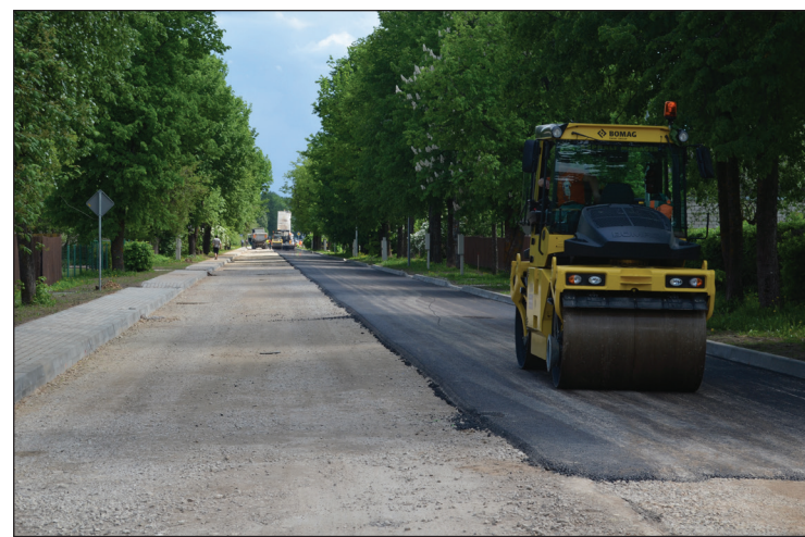
Klāj asfaltu Raiņa ielā

sākumā. Darbus bija paredzēts pabeigt pērnajā rudenī, tomēr oktobra sākumā pasliktinājās laika apstākļi un strauji pazeminājās gaisa temperatūra, līdz ar to nebija pieļaujama asfaltseguma ieklāšana, kā rezultātā objektā tika izsludināts tehnoloģiskais pārtraukums. Tomēr šobrīd objektā ākli rosās būvnieki un darbi tiks pabeigti savlaicīgi.