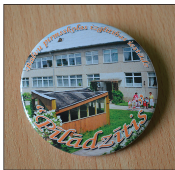
Bērnodārza bijušie audzēkņi, kuriem nupat bija izlaidums, par atmiņu saņēma nozīmītes vēl ar 'vecā' 'Pīlādžīša' dizainu

izzāģēšana bērnodārza teritorijā. Pie ēkas pamatiem paredzēts ieklāt arī jaunu bruģi un novākt nolietoto gaismas stabus. Pakāpeniski vadītāja vēlas pilnībā sakārtot „Pīlādžīša” ārējo vidi – izveidot jaunus celiņus, uzstādīt jaunus LED lampas, lai arī rudenī un ziemā bērni varētu atrasties svaigā gaisā, izveidot plašāku rotaļu laukumus. Protams, arī iekštelpās ir vēl šādi tādi darbi veicami, bet vadītāja ir gandarīta jau par to, kas paveikts: „No pašvaldības līdzekļiem mums ir uzstādītas 3 jaunas lapenes, kur bērniem rotaļāties. Tagad būs renovēta pati bērnodārza ēka. Prieks, ka par mums rūpējas,” teic vadītāja.