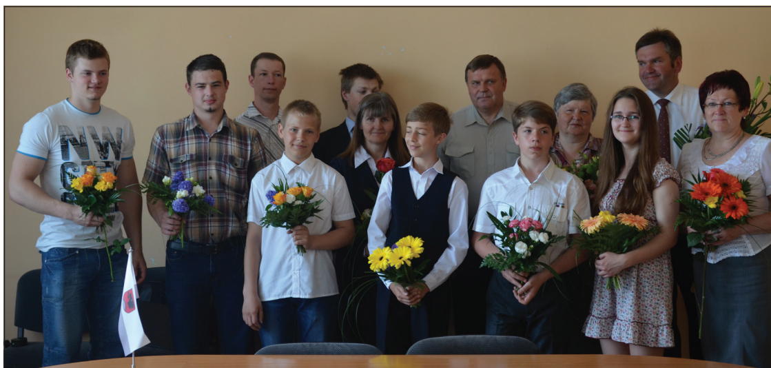
Labākie Balvu novada skolēni ar skolotājiem pieņemšanā pie Balvu novada Domes priekšsēdētāja

Latvijas mūzikas skolu vokālo ansambļu konkursā "Lai skan" 3.vietu ieguvis Balvu Mūzikas skolas vokālais