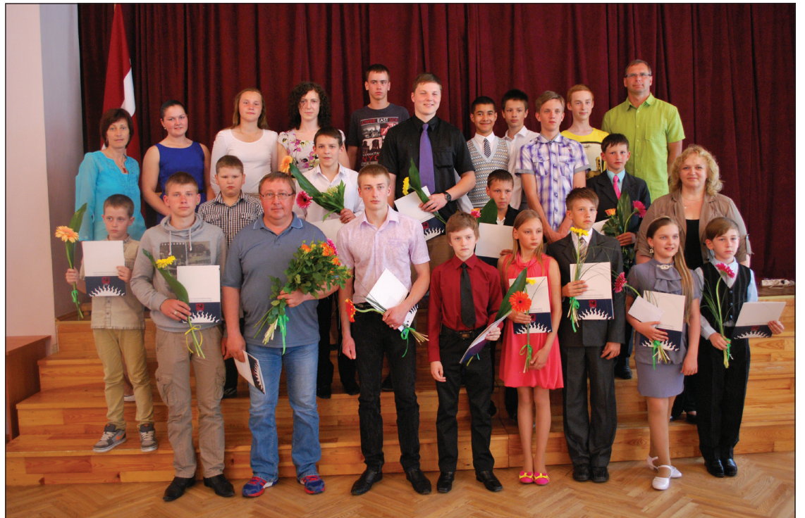
Balvu Sporta skolas audzēkņi un skolotāji pēc apbalvošanas