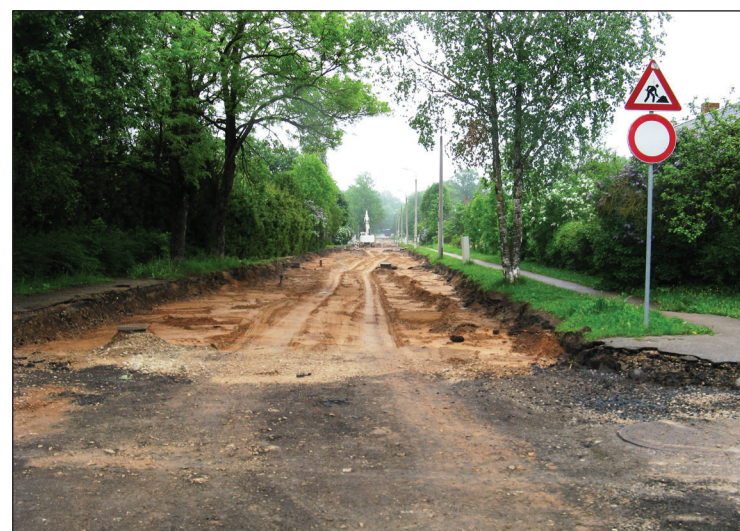
Brīvības ielā tiek veikta kapitāla pārbūve