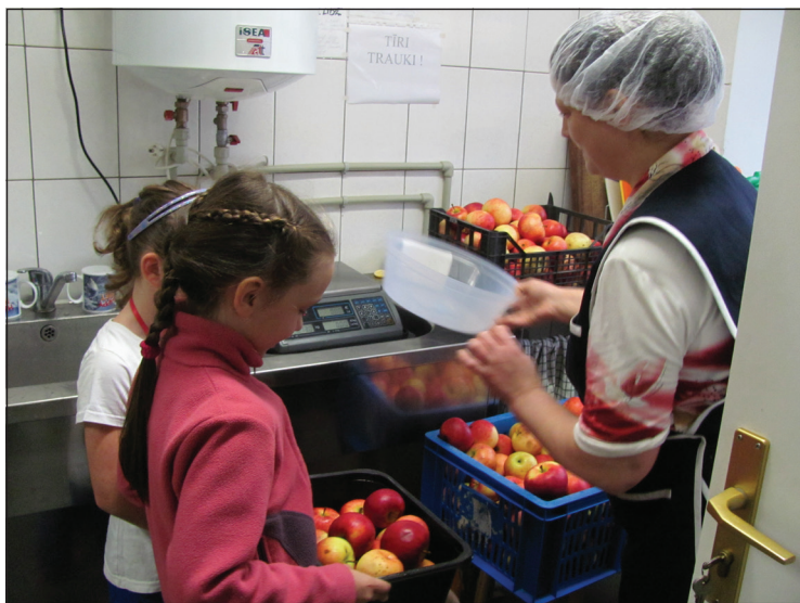
Skolēni Balvu pamatskolā saņem ābolus un pienu

Programmā „Skolas piens” pienu vai citus piena produktus (kefiru, jogurtu, pienu ar šokolādes piedevām u.c.) arī turpmāk var saņemt gan pirmsskolas, gan pamatskolas, gan 10.-12.klašu skolēni vispārīgizglītības skolās. Mūsu novadā Balvu pamatskolas, Balvu Amatniecības vidusskolas, Briežuciema pamatskolas, Stacijas pamatskolas un tās Viksnas filiāles, Tilžas vidusskolas un tās Vectilžas filiāles, kā arī visi pirmsskolas izglītības iestāžu bērni, kopumā 1275 audzēkņi. Piena produktus izglītības iestādes saņem no AS Preiļu siers un Rīgas piena kombināta.