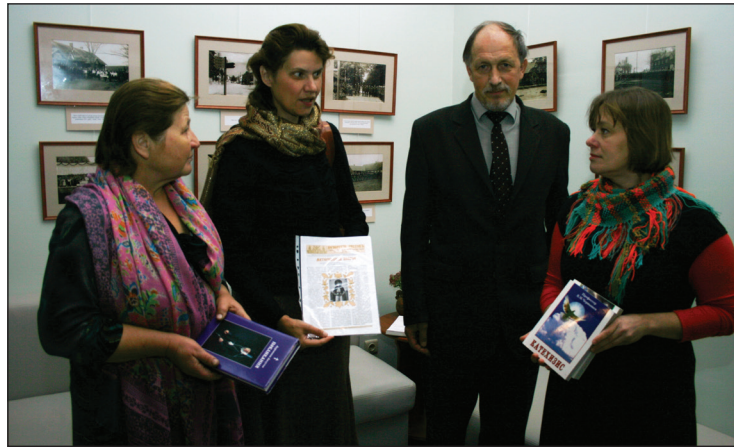
Ukraiņu viesi sarunās ar muzeja darbiniekiem

Otrajā dienā pasākums turpinājās Viļakas novada kultūrvēstures muzejā „Vēršukalns”. Tā dalībniekiem bija iespēja iepazīties ar „Ziemeļlatgales nemateriālais kultūras mantojums”. „Vēršukalnā” bija iespēja gan vērot, gan pašiem darboties Annas Strupkas Maizes cepšanas