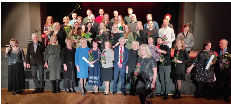
Attēlā – koncerta dalībnieki un Ropažu novada pašvaldības pārstāvji.

Jau pirmais priekšnesums – J. Brāmsa "Ungāru dejas" – klavieru