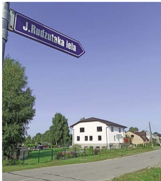
■ J.Rudzutaka iela Līvānos

Saasinoties ģeopolitiskajai situācijai Ukrainā, Latvija ir ne tikai vērsusi uzmanību sankcijām pret agresorvalsti, plašas diskusijas bijušas arī par padomju mantojumu Latvijā, apspriežot padomju varas slavināto pieminekļu pastāvēšanu.