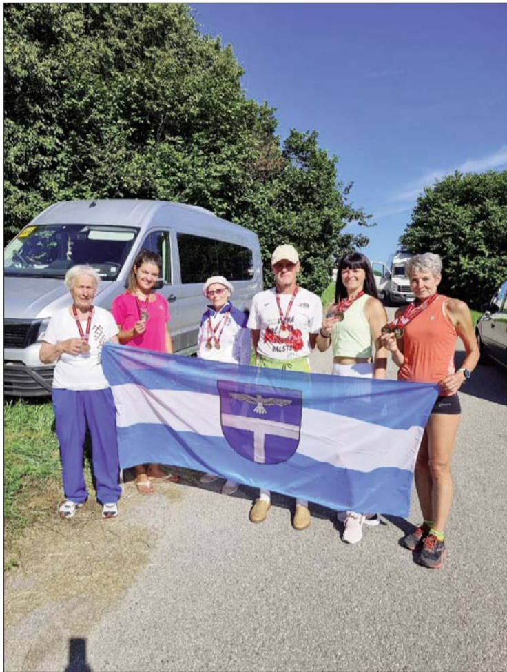
■ Līvānu vecmeistaru komanda

13. augustā Tukumā notika 8. Latvijas čempionāts vecmeistariem vieglatlētikā. Sacensību atklāšanas parādē, uzrunājot klātesošos sportistus, Latvijas Vieglatlētikas Veterānu Asociācijas prezidents Guntis Zālītis apsveica sportistus ar labajiem laika apstākļiem, ar rekordlielo dalībnieku skaitu pēdējo divu gadu laikā – 252 (95 sievietes, 157 vīrieši) un novēlēja veiksmīgus startus čempionātā.