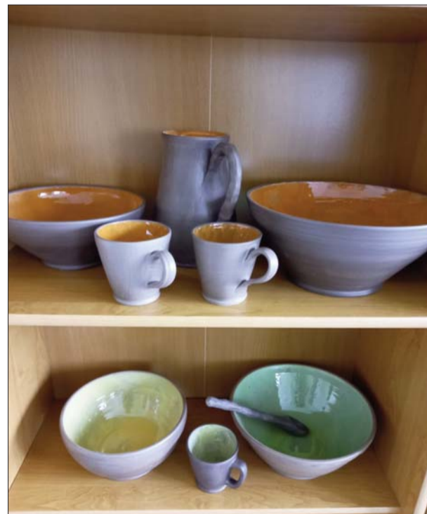
■ A. Čakšas māla trauku izstāde "Māls, kas uzzied!"

Rožupes bibliotēkas izstāžu telpā jūlijā bija skatāma Agneses Čakšas māla trauku izstāde "Māls, kas uzzied!". Agnese ir strādājusi Anglijā, bet aicinājuma vadīta ar ģimeni atgriezies savā dzimtajā pusē Rudzātu pagastā. Kādu laiku praksi apgūsi pie podnieka Eināra Dumpa. Mājās iekārtojusi nelielu darb-