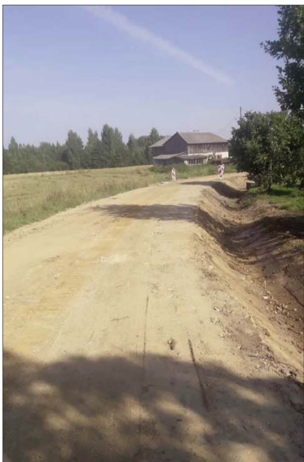
■ Vītulu ielas remonts Jersikā

Jūlijs ir atvaļinājumu laiks arī Jersikā. Atpūtās pārvaldes vadītāja (3 nedēļas), sociālais darbinieks (2 nedēļas), bibliotēku un tautas nama vadītājas.