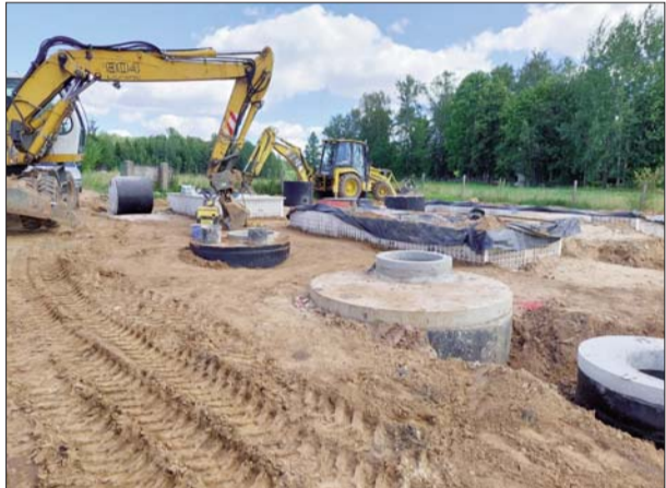
■ Sutru notekūdeņu attīrīšanas iekārtu pārbūves darbi