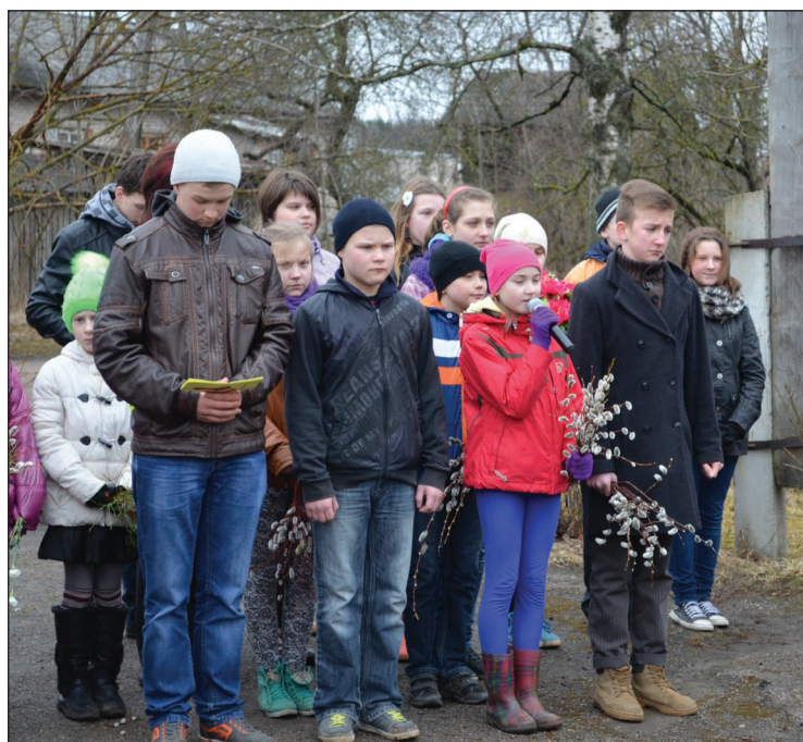
Stacijas pamatskolas skolēni arī šogad pulcējās pie piemiņas akmens, lai godinātu 1949.gada 25.marta deportācijas cietušos