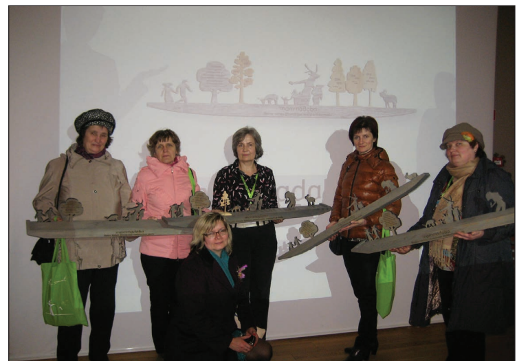
Balvu un Rugāju skolu pedagogi ar saņemto balvu "Mammadaba meistarības mežs"

Paldies visiem skolēniem par aktivitāšu atbalstīšanu un visiem klašu audzinātājiem par darba organizēšanu. Kopējā darbā sasniegts iepriecinošs rezultāts. Dzīvosim „Zaļi jo zaļi”!