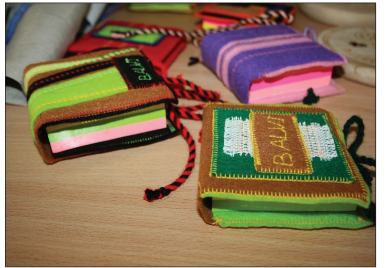
Lielu atzinību izpelnījās Balvu Amatniecības vidusskolas tekstiltehnikas sintēzes pulciņa radītie suvenīri -Līmlapiņu ietvaru komplekts "Visas dzīves krāsas Balvos"

tika apbalvoti konkursu uzvarētāji. Visi iesniegtie darbi bija neatkarīgi. Katrs ieguldījis lielu darbu un idejas, lai taptu izstādē