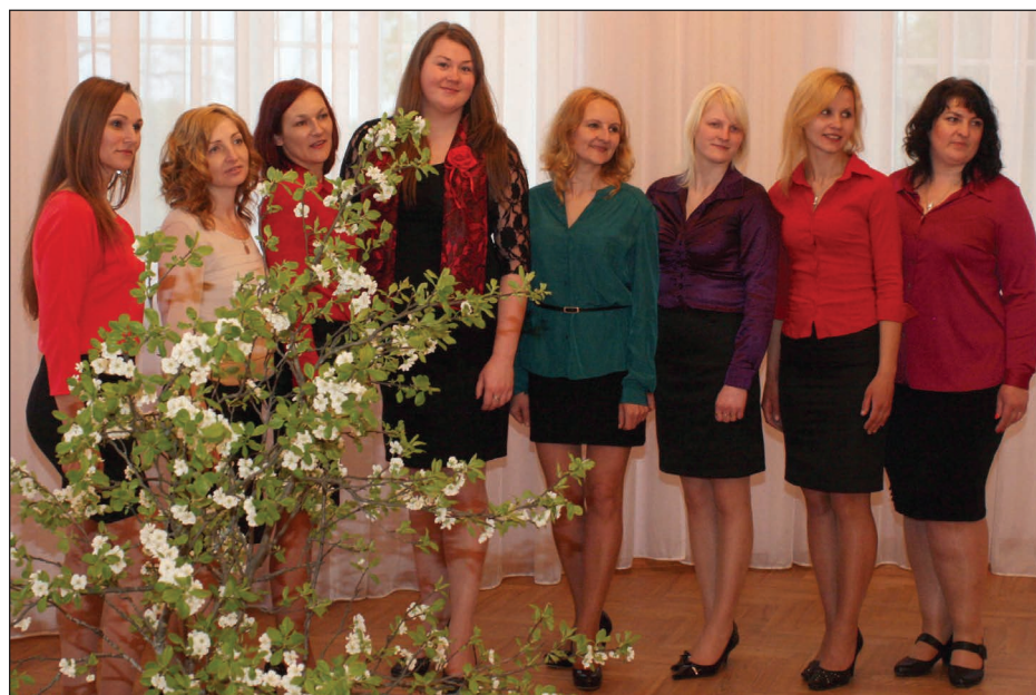
Lazdulejas pagasta vokālais ansamblis „Vālodzīte”