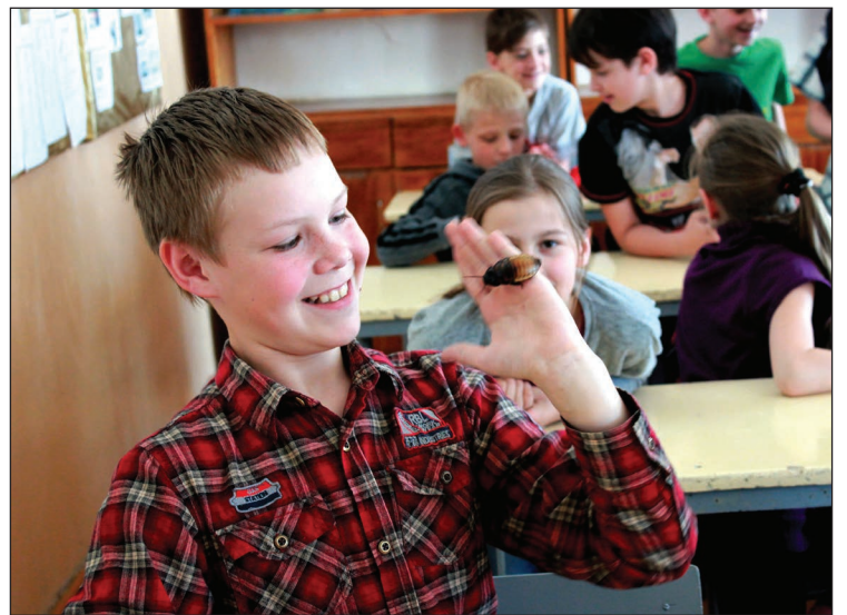
Drosmīgākie skolēni savās rokās turēja gan prusakus, gan tūkstoškājus

organisma pielāgošanās spējām dzīvesvidei;