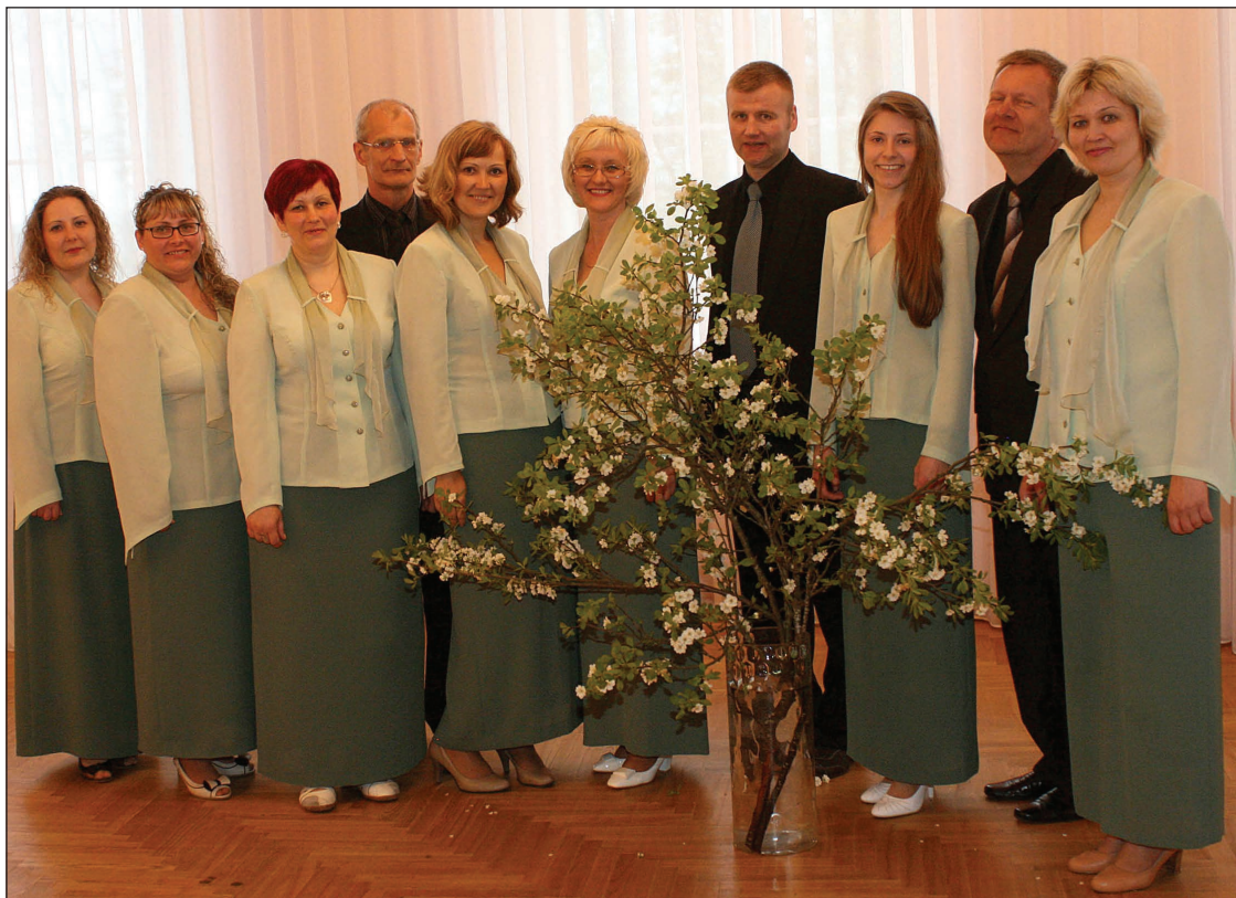
Balvu Kultūras un atpūtas centra vokālais ansamblis „Par to”

Visu četru novadu vokālo ansambļu sniegumu atzinīgi novērtēja žūrija, piešķirot ansambļiem 1.un 2.pakāpes diplomus.