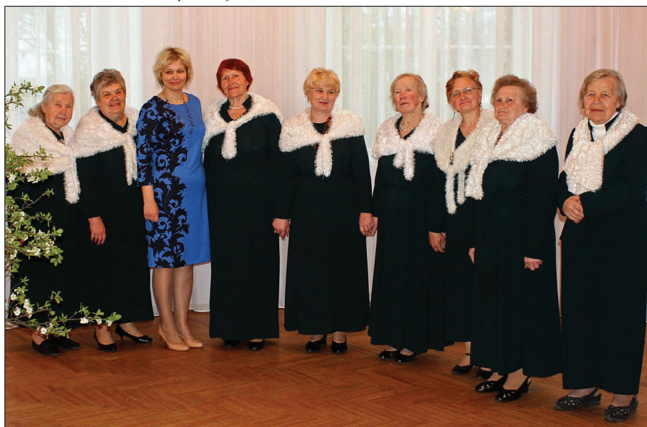
Garīgo dziesmu ansamblis „Vakarblāzma”