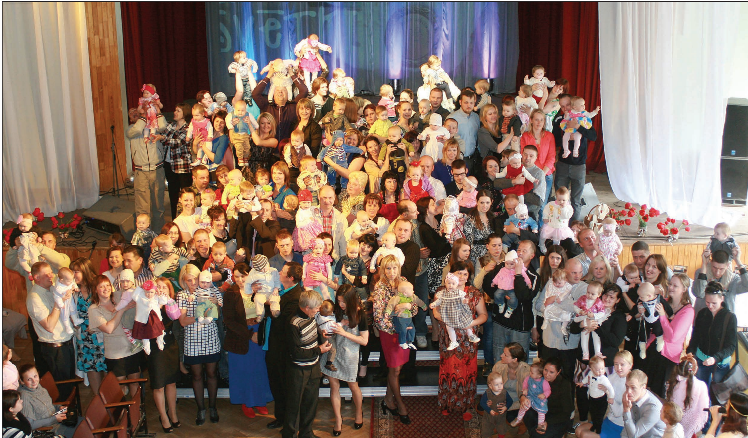
Lai Balto zeķīšu īpašnieku kājiņas atrod dzīvē gaišākos ceļus, kurus pavada vecāku mīlestība!

Turpinot pirms 11 gadiem aizsāktu tradīciju, arī šogad 11.maijā, kad visā pasaulē tika atzīmēta Mātes diena, Balvu Kultūras un atpūtas centrā notika tradicionālie "Balto zeķīšu svētki", kurā tika sumināti vieni no jaunākajiem Balvu novada iedzīvotājiem.