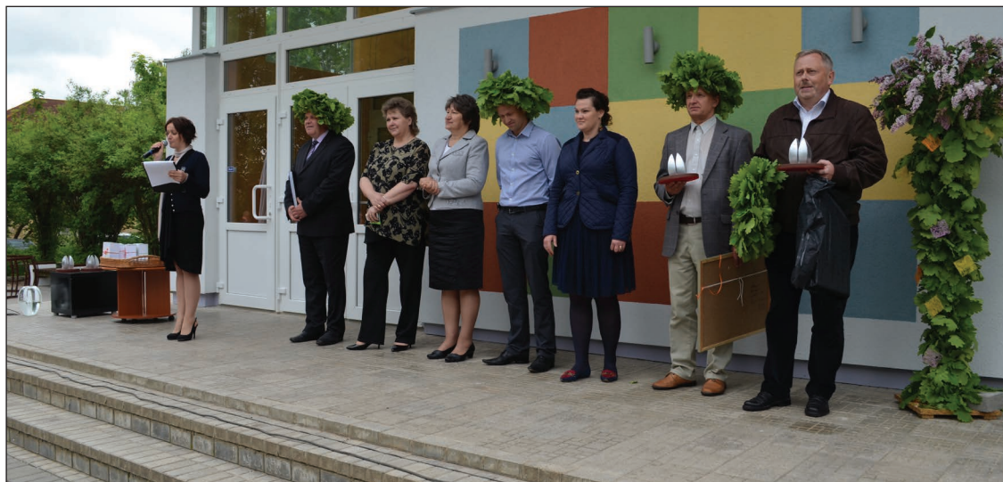
I.Paidere pateicas projekta īstenošanas gaitā iesaistītajām personām