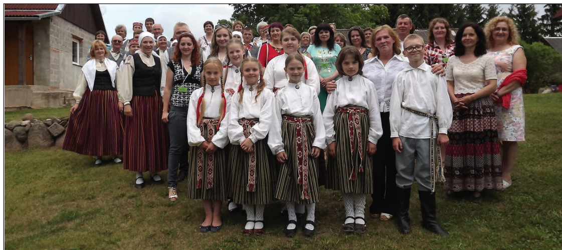
„Kronišu” mājās Briežuciemā

paskrēja skatoties motociklu parādi un apmeklējot Motociklu vasaras pasākumu. Ciemiņi bija ļoti priecīgi par redzēto, bet mēs varam būt lepnī, ka mums ir ko parādīt, ir ar ko lepoties un ka protam uzņemt ciemiņus.