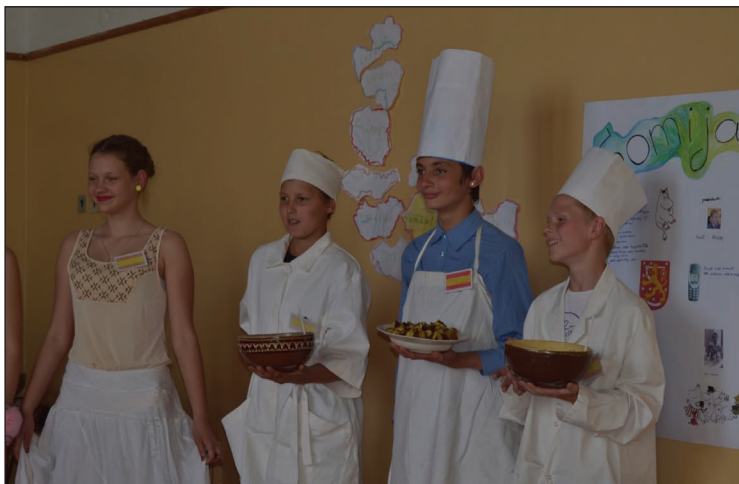
Spānijas delegācija prezentē savu valsti