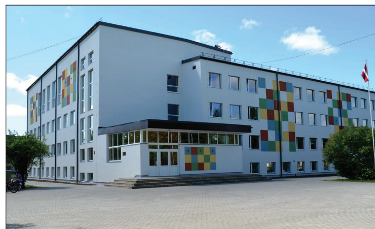
Balvu Valsts ģimnāzija pēc renovācijas