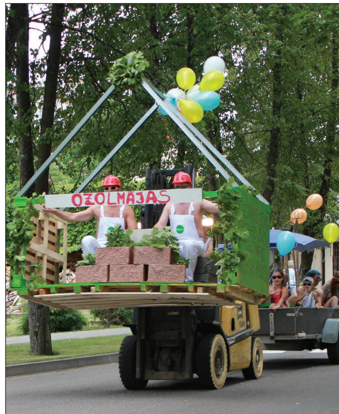
Komandas „Ozolmājas” rotātais braucamrīks ieguva vislielāko žūrijas atzinību un parādē izcīnīja 1.vietu