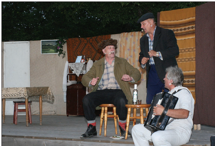
Skatītājus līdz pat asarām smidzināja Baltinavas amatiereteātra „Palādas” aktieri