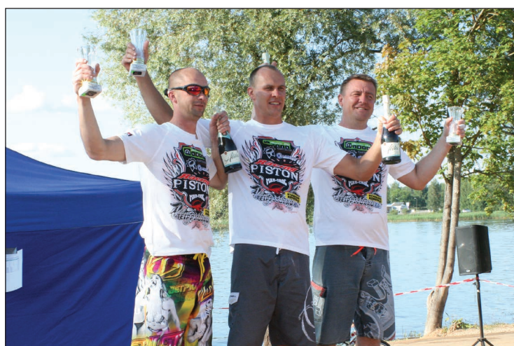
Gandarīti par uzvaru