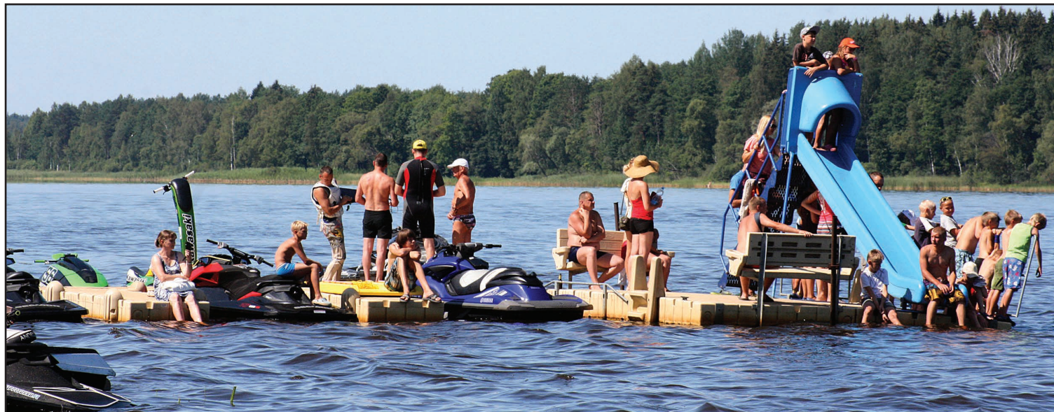
Baltijas un Latvijas ūdensmotociklu čempionāts šogad pulcēja ievērojami vairāk skatītāju nekā pērn

26.jūlijā Balvu ezerā pirmo reizi Latgales reģionā un Balvu novadā vienlaicīgi norisinājās Baltijas valstu čempionāta I posms un Latvijas čempionāta ūdensmotocikliem 4.posms, kurā aptuveni 1,5 kilometrus garo trasi Balvu ezerā iemēģināja 47 braucēji ne tikai no Latvijas, Lietuvas, Igaunijas, bet arī no Krievijas.