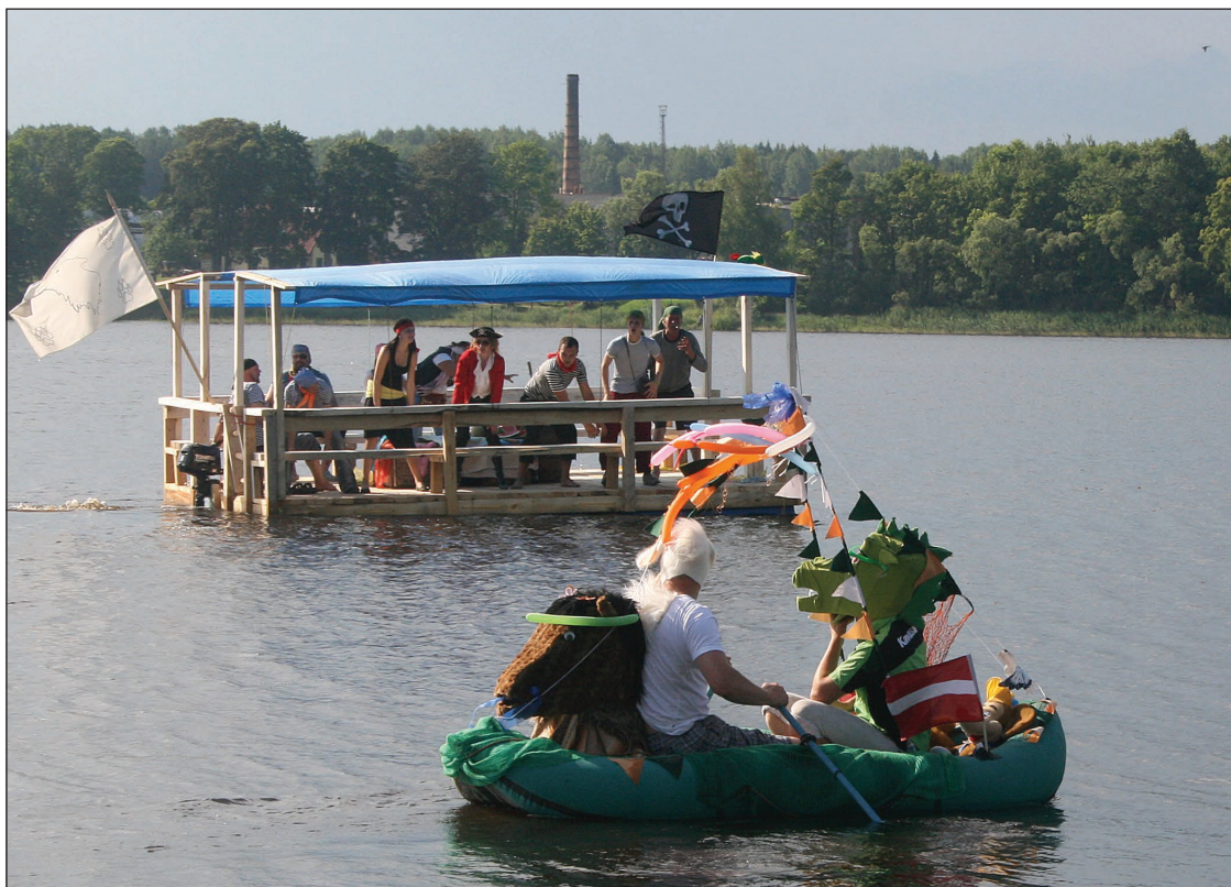
Pašdarināto peldlīdzekļu parādē šogad piedalījās 6 ekipāžas