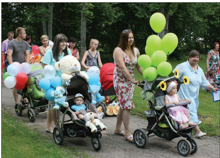
Bērnu braucamrīku parādē piedalījās 18 izrotāti braucamrīki