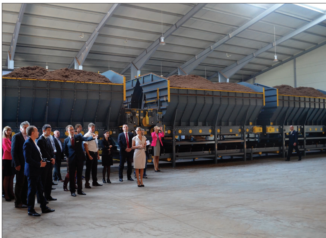
Ekspursijas laikā tika apskatīta visa ražotne un dzirdēts stāstījums par kūdras pārstrādi

2012.gada sākumā SIA „Compaqpeat” pēc nomas tiesību iegūšanas Lutinānu purvā izveidoja jaunu struktūrvienību Balvu novada Briežuciema pagastā. 2012.gada 27.jūlijā uzņēmums ES fondu aktivitātes „Augstas pievienotās vērtības investīcijas” ietvaros noslēdza līgumu ar Latvijas Investīciju un attīstības aģentūru par projekta „Kūdras pārstrādes ražotnes izveide Balvos” īstenošanu. Projekts tika uzsākts 2012.gadā, un tā īstenošanas rezultātā tika uzbūvēta un 2014.gada aprīlī nodota ekspluatācijā jauna kūdras pārstrādes ražotne 5100 m 2 platībā.