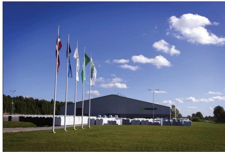
SIA „Compaqpeat” ražotne Briežuciema pagastā

nodokļi un, kas ir būtiski novada attīstībā. Domes priekšsēdētājs atzina, ka pašvaldībai kopā ar