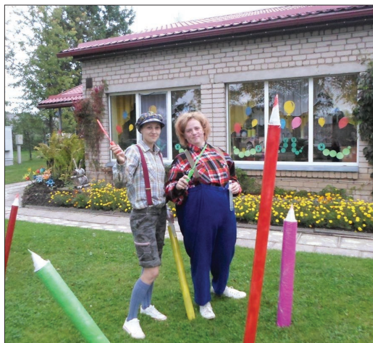
Bērnus sagaida Karlsons un Brālītis