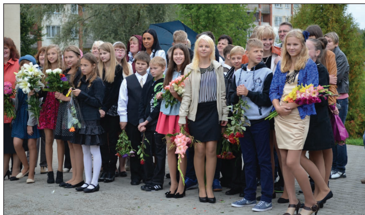
Skolas pulkam pievienojas arī 6.klase

Pasākuma noslēgumā visus pārsteidza lidmašīna, kas pāri skolai mākoņainajās debesīs nesa Balvu Profesionālās un vispārizglītojošās vidusskolas saīsināto nosaukumu - BPVV.