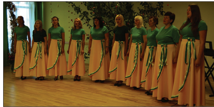
Lazdulejas pagasta saietu nama vokālais ansamblis „Vālodzīte” jaunajos tērpos

Tas ir nebijis notikums Lazdulejas pagastā, jo vokālā ansambļa dalībnieces ir pagasta iedzīvotājas, kas pēc pašu iniciatīvas ir izveidojušas ansamb-