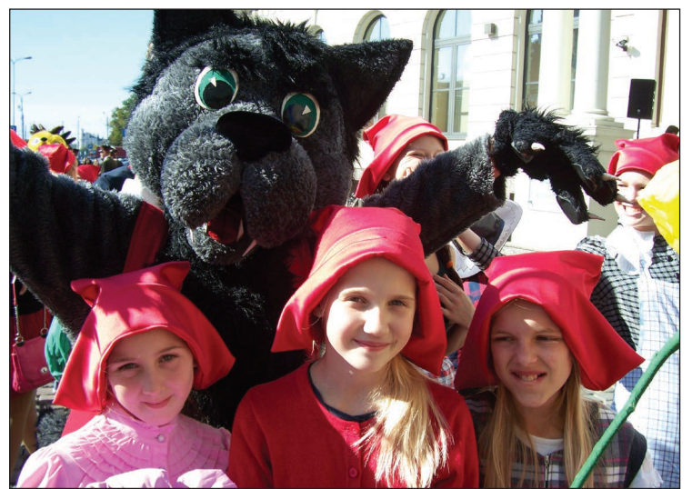
Sarkangalvītes ar Balvu vilku

8. septembrī Eiropas kultūras galvaspilsētas programmas ietvaros norisinājās vērienīgs un krāšņais karnevāla gājiens bērniem „Gribu iet uz bibliotēku!”, ko organizēja Latvijas Nacionālā bibliotēka un nodibinājums “Rīga 2014”.