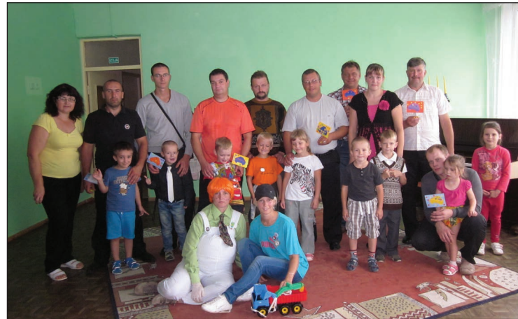
Tēvi kopā ar saviem bērniem, Karlsonu un Brālīti, kā arī bērnu dārza audzinātājām