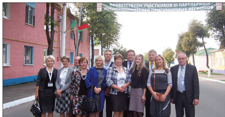
Partneriāta dalībnieki no Latvijas

Pēc 2013.gadā Balvos notikušā "Eiropreģiona "Pleskava - Livonija"" uzņēmēju III partneriāta (pierošanas pašvaldību uzņēmēju divpusējās tikšanās), kurā piedalījās arī viesi no Balvu novada sadarbības pašvaldības Dokšiciem Baltkrievijā un kuriem šādas tikšanās likās ļoti vērtīgas un lietderīgas, nolēma šādu pasākumu organizēt arī pie sevis.