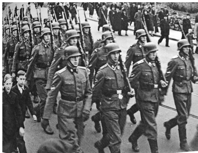
Doma laukums, 1943. gads. Zvēresta parāde

benskaŗš iebuksēja pie Maskavas, cieta sakāvi Staļingradā un Rietumu sabiedroto desants izcēlās Ziemeļafrikā, Vērmachtam sāka aprūkt ieroču nesēju. Kaŗš ieilga, bolševiku partizānu aktivitāte Austrumu frontē pieauga. 1944. gada februārī SS obergru-penfirers G. Bergers raksta policijas ģenerālleitnantam A. Ober-gam: "Mums vajadzētu pieturēties pie viedokļa, ka šajā laikā būtu noziegums neiesaistīt visus spēkus." Tas spieda vāciešus arvien vairāk izdalīt no vienībām spēkus frontes aizmugures drošībai. Arī 1941./1942. gada bargā ziema, nepiemērota apģērba dēļ, bija ievērojami mazinājusi vācu vienību skaitlisko sastāvu. Vācu vadība bija spiesta kārtības nodrošināšanai frontes aizmugurē iesaistīt vairāk austrumu apgabalu iedzīvotājus. Vispirms bija paredzēts no Baltijas valstu piederīgajiem saformēt 40 kārtības dienesta bataljonus: 15 lietuviešu, 13 latviešu un 12 igauņu. Tā kā latviešu atmiņā bija bolševiku sagādātās ciešanas "baigajā gadā" (aptuveni viena gada krievu okupācijas laikā tika apcietināti, nonāvēti vai deportēti ap 36 000 Latvijas iedzīvotāju), brīvprātīgo netrūka, un papildus saformēja vēl 14 bataljonus. Bet tie bija izkaisīti pa dažādiem frontes sektoriem. Jautājums, ka latviešu karavīrus vajadzētu apvienot savas tautas aizsardzībai, vairākkārt tika apspriests Zemes pašpārvaldes (ZP) ģenerāldirektoru sēdēs, bet nekādus oficiālus pieteikumus ZP vācu vadībai neiesniedza. Neapmierinātību izsauca arī vāciešu atļauja 1942.