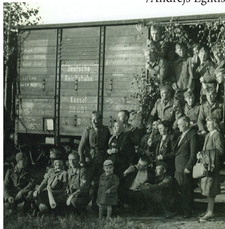
Latviešu legionāru pavišana uz Volhovu Austrumu frontē