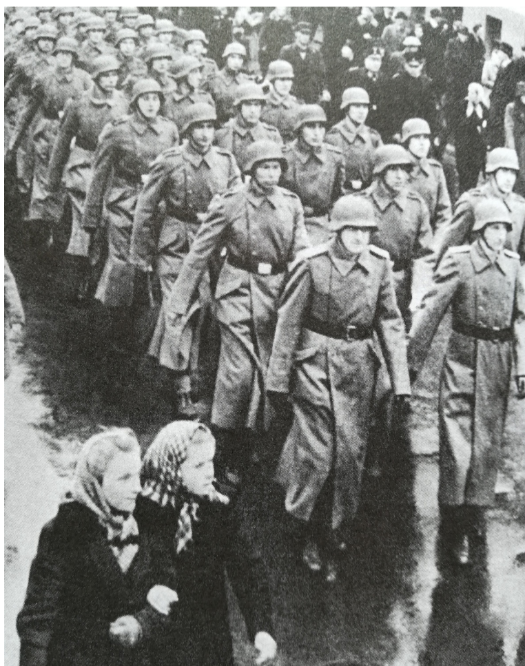
Legionāri soļo uz Brīvības pieminekli pēc zvēresta nodošanas

Mums apkārt horizonts bij liesmās grimis – Pie mūsu tautas asiņainiem sāniem