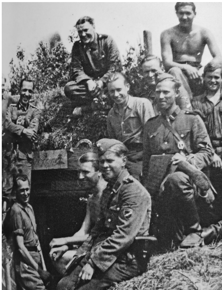
Leģionāri Bardovo-Kudeveras pozīcijās austrumos no Opočkas pie štāba bunkura