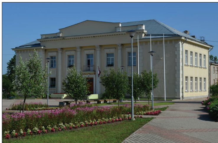
Balvu Kultūras un atpūtas centrs 2014.gadā

Pamazām maināties, draugi, kā mājas, kā lauki, kā viss. Jā, nevis vecojam, bet maināties - ēkas, tehnoloģijas, vērtības, vajadzības, kvalitāte un, protams, cilvēki. Bet paliek...paliek atmiņas, fotogrāfijas, apraksti, ieraksti, hronika.