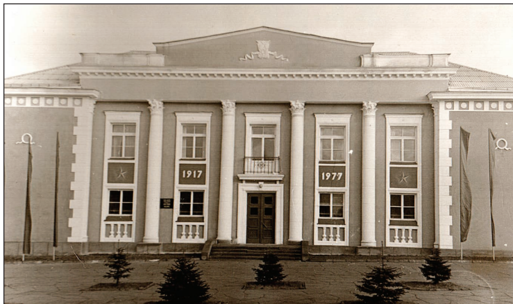
Balvu Kultūras un atpūtas centrs 1977.gadā