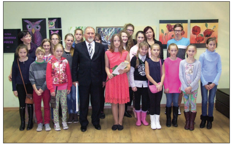
Konkursa dalībnieki ar Balvu Mākslas skolas skolotājām un V.M.Geisiku

Balvu Mākslas skolas direktores vietniece izglītības jomā