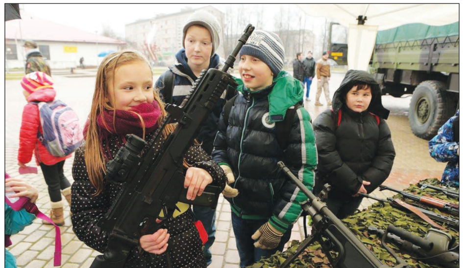
Bērni un jaunieši ar aizrautību aplūkoja Zemessardzes ieroču klāstu.