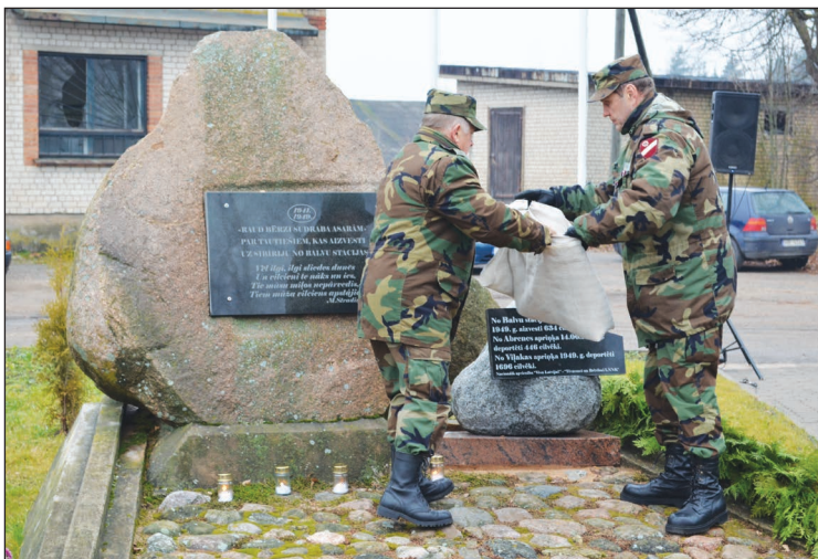
Pieminot latviešu tautas varoņus, tika atklāta arī renovētā piemiņas vieta un plāksne, kura vēsta, ka no Balvu stacijas 1949.g. aizvesti 634 cilvēki. No Abrenes apriņķa 14.06.1941.g. deportēti 446 cilvēki. Bet no Viļakas apriņķa 1949.g. deportēti 1696 cilvēki.

22.novembrī plkst. 19.00 Latvijas dzimšanas dienai veltīts pasākums. Nāciet visi klausīties brīnišķīgo Medņevas folkloras kopas „Egle” koncertu. Ieeja brīva.