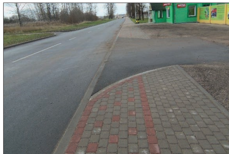
Brīvības iela pēc