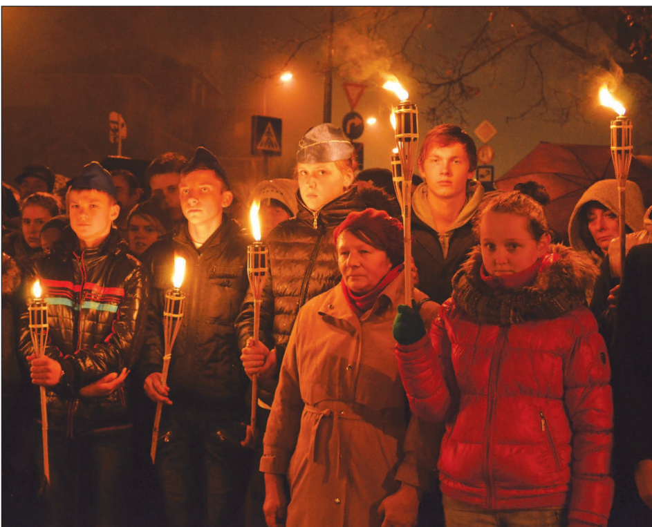
Pie pieminekļa Latgales partizāņu pulka kritušajiem karavīriem pulcējās bērni un jaunieši gan no Balvu novada, gan kaimiņu, gan arī tālākiem Latvijas novadiem.