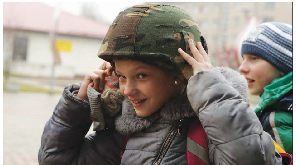
Izstādē pie Balvu Kultūras un atpūtas centra tika aplūkots, kā arī pielaižots Zemessardzes ekipējums.