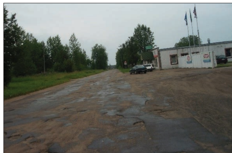
Brīvības iela pirms