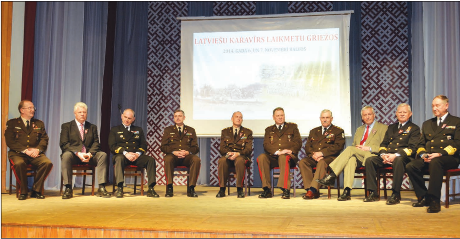
Biedrības „Latvijas ģenerāļu klubs” pārstāvji paneldiskusijas laikā atklāja, kā var kļūt par ģenerāli, kādas lietas tie krāj, kādi priekšmeti skolas laikā ir patikuši vislabāk. Interesanti, ka vairākums minēja tādus priekšmetus kā matemātika, fizika, ģeogrāfija un citus.