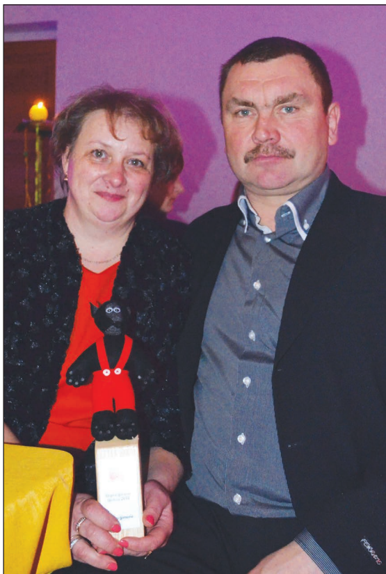
Stipra ģimene laukos 2014 Kaņķu ģimene no Krišjāņu pagasta