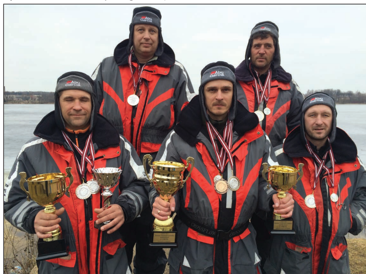
2.vietas ieguvēji - BSM-FINNEX