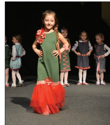
Tērps no Kubulu PII „Ieviņa” tērpu kolekcijas „Sikas, mazas meitenītes rakstu rakstus izrakstīja”