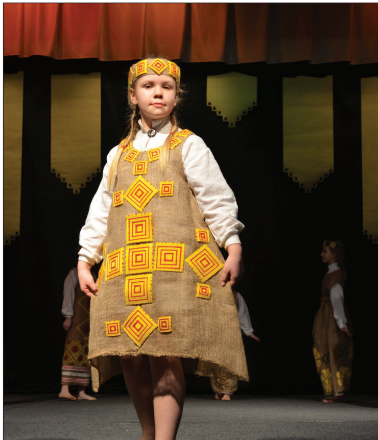
Tērpu no kolekcijas „Etnogrāfijas motīvi” demonstrē Balvu pamatskolas skolniece. Kolekcijai tika piešķirta 1.vieta