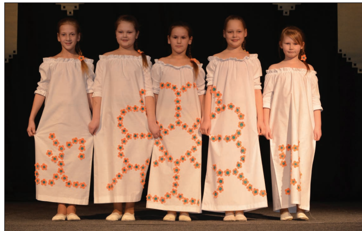
Tērpu kolekciju „Sauls meitas rotājas” demonstrē Stacijas pamatskolas skolniece. Šī kolekcija ieguva 3.vietu

Visi skates dalībnieki saņēma pateicības rakstus un saldumus no skolas. Bet jau otro gadu skates