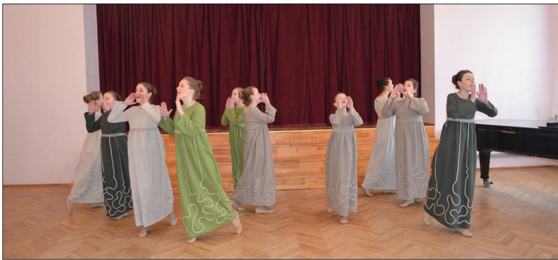
Tilžas vidusskola vokālais ansamblis „Varbūt” pagājušajā gadā ir ieguvis augstāko rezultātu savā vecuma grupā Latvijā konkursa „Balsis” finālā

Labākie ansambļi tika izvirzīti un piedalīsies konkursa 2.kartā, kur tiksies Latgales novada labākie vokālās mūzikas ansambļi.