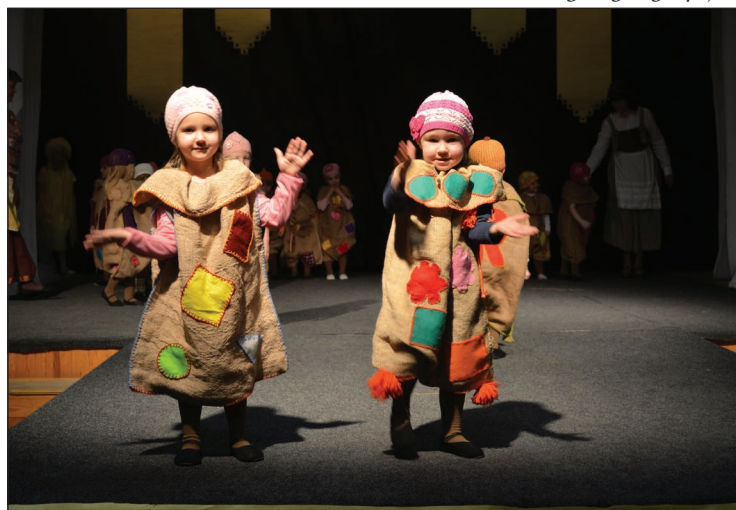
Kolekciju „Kartupeli, kartupeli, ko dar’ tavi brāļi” aktīvi demonstrēja Balvu PII „Pīlādzītis” bērni