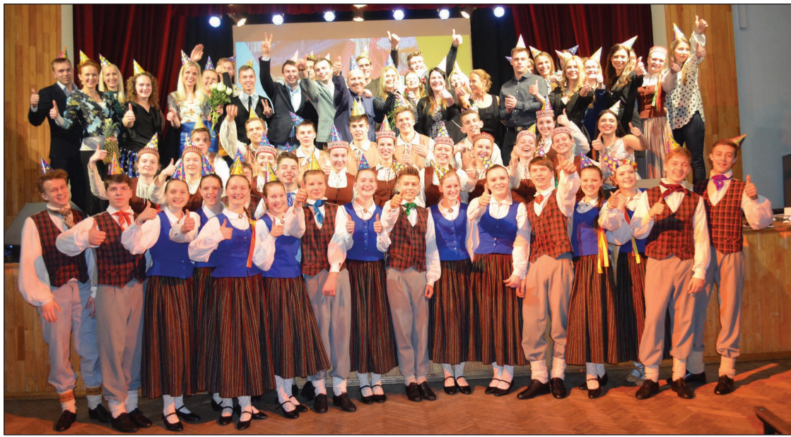
Deju kopas „Rika” bijušie un esošie dejotāji kopā ar viesiem