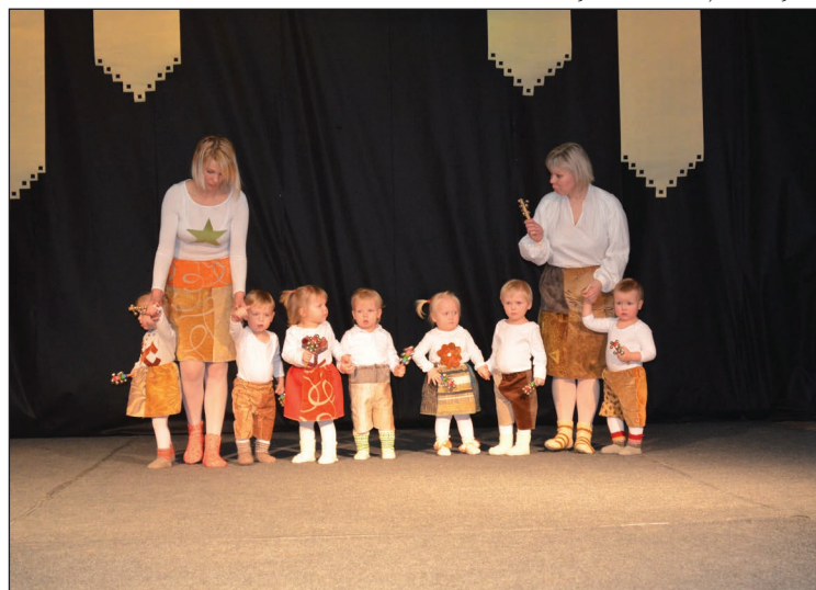
Jaunākie skates dalībnieki - Balvu PII „Sienāzītis” 2-gadīgā grupiņa