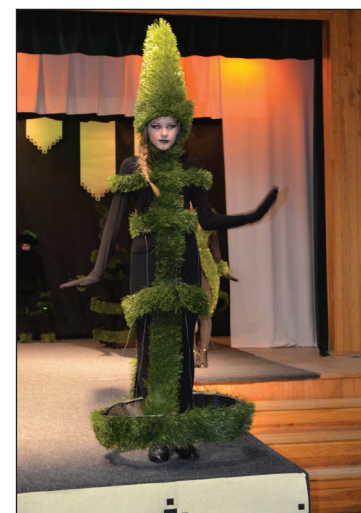
BPVV tērpu kolekcijas „Zāles rakstiem izrakstītas” tērps