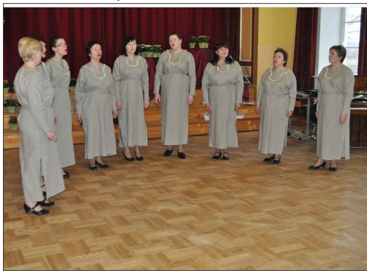
Tilžas Kultūras nama sieviešu vokālais ansamblis „Rasa” skatē ieguva 41,5 punktus un 1.pakāpi