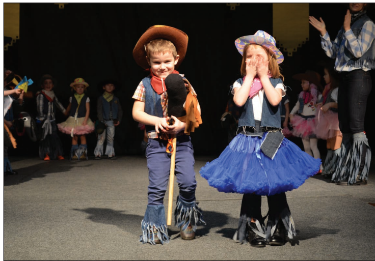
Gaisa bučas pasākuma apmeklētājiem sūtīja mazie kovboji no Balvu PII „Sienāzītis” 4-5 gadīgās grupiņas