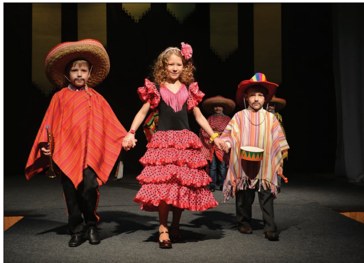
Balvu PII „Sienāzītis” kolekcija „Meksikāņi Latvijā”