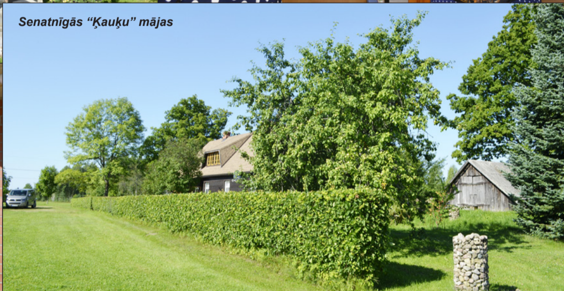
Senatnīgās "Ķauķu" mājas