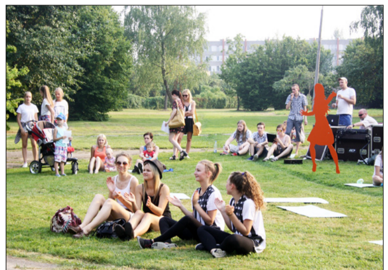
Skatītāji enerģiski atbalstīja un baudīja pasākumu par spīti svelmīgajam karstumam.