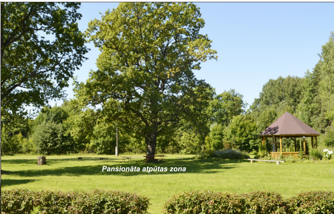
Pansionāta atpūtas zona