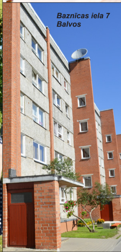
Baznīcas iela 7 Balvos