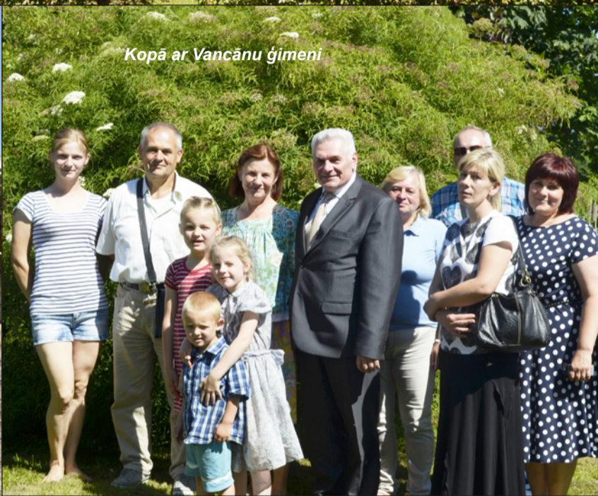
Kopā ar Vancānu ģimeni