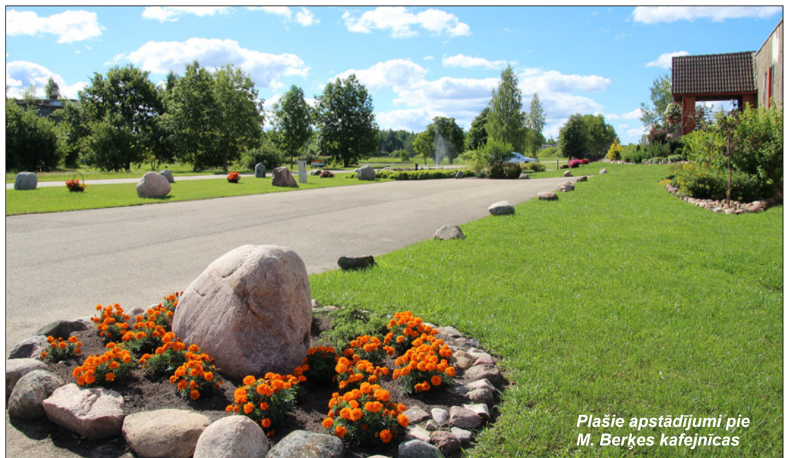
Plašie apstādījumi pie M. Berķes kafejnīcas