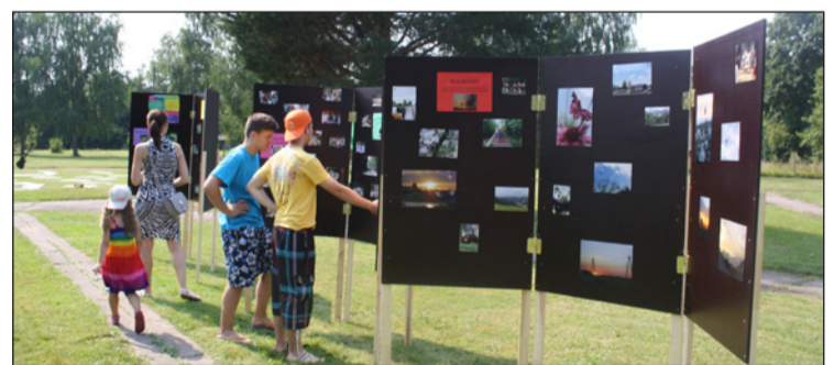
Pasākuma laikā bija skatāma izstāde ar visām radošajām darbnīcām no projekta „Katram amatam savs pamats”, kā arī Balvu novada jauniešu izpratne par to, kas, viņuprāt, ir AUGSTĀK!