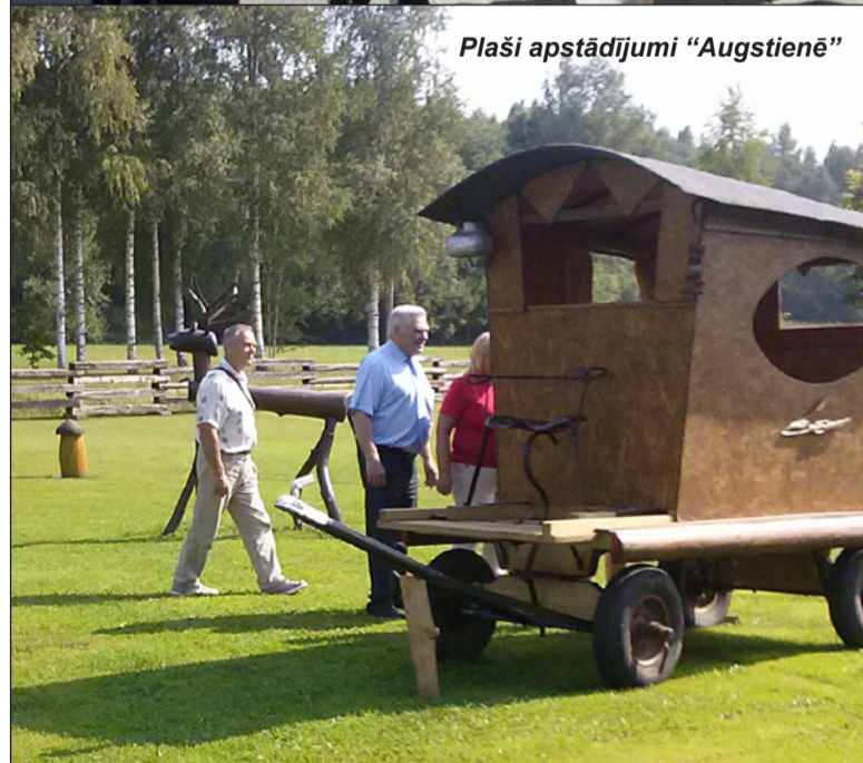
Plaši apstādījumi "Augstienē"