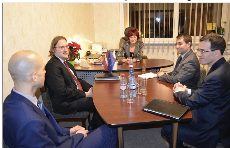
Sarunu laikā ASV vēstniecības pārstāvji izteica atzinību par Ziemassvētkiem saposto pilsētu

Vēstniecības pārstāvjiem bija iespēja apmeklēt arī Balvu Profesionālo un vispārīglobojošo vidusskolu, kur tika aplūkotas skolēnu radītās tērpu kolekcijas, kā arī koka izstrādājumi.