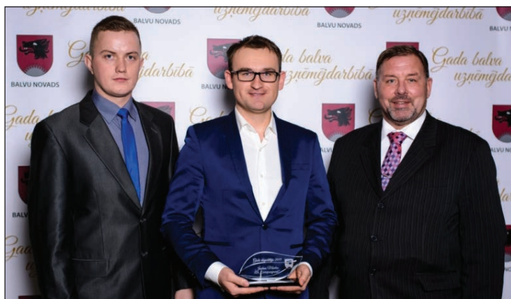
SIA „Compaqpeat” pārstāvji pasākuma laikā saņēma balvu nominācijā „Gada eksportētājs 2015”