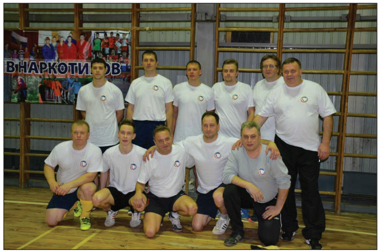
Biedrības "Eiroteģions "Pleskava-Livonija" komanda