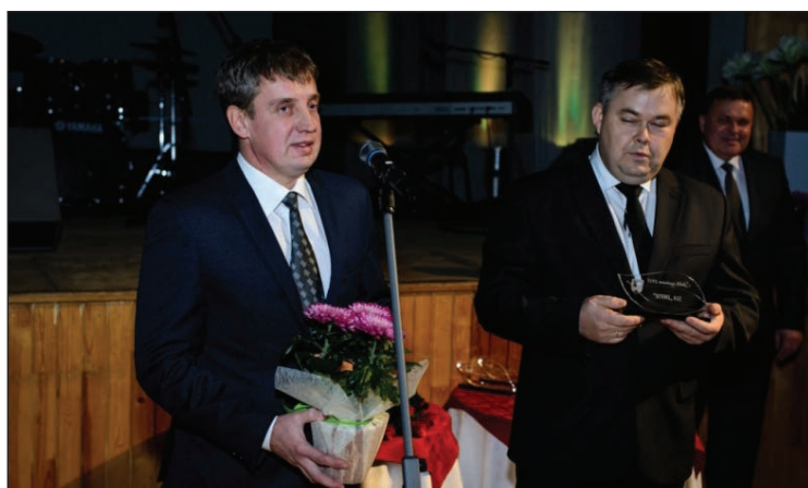
SIA „INVIK” pārstāvji saņēma balvu kā „Stabils uzņēmums 2015”